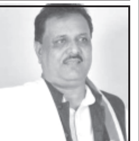
પુર્વ સાંસદ/ધારાસભ્ય વિરજીભાઈ હુંમરે ગુજરાત રાજ્યના મુખ્યમંત્રી ભુપેન્દ્રભાઈ પટલને સત્વરે આ વિસ્તારમાં કામગીરી ઝડપી થાય તે અંગે લેખિત માંગણી કરી છે લોકોની સહનશકિત ઘટતી રહી છે. કોન્ટ્રાક્ટરો / અધિકારીઓ ગામલોકોને ઉદ્દત જવાબ આપી રહ્યા છે ત્યારે આ બાબત ગંભીર ગણી આપના લેવલેથી તાકીદે યોગ્ય સુચના થવા રજૂઆત કરી હતી. તેમ એક યાદીમાં પુર્વ સાંસદે જણાવ્યું હતું.

અમરેલી, તા. ૨૯ પુર્વ સાંસદ/ધારાસભ્ય વિરજીભાઈ હુંમરે તાજે તરમાં ચૂંટણી પ્રચાર અર્થે મહુવા -રાજુલા - જાફરાબાદ પ્રવાસ કરેલ. પ્રવાસ દરમ્યાન મહુવા -રાજુલા -જાફરાબાદ -વેરાવળ જે બની રહ્યો છે તે હાલ એકદમ બંધ હાલતમાં કામગીરી થતી હોય તેવું લાગી રહ્યું છે. વાહન-ચાલકો અતિ મુશ્કેલીમાં મુકાયા છે. ગઈકાલે આ વિસ્તારનાં પસાર થતાં સર્વિસ રોડના કારણે ગામડા સંપૂર્ણ દબાઈ ગયા છે. આ વિસ્તારના નાગેશી, મીઠાપુર, બાલાની વાવ, કાગવદર, છતડીયા વિગેરે ગામોમાં પસાર થતા સર્વિસ રોડમાં બળદગાડા ને પણ મુશ્કેલી પડી રહી છે. આ ગામોથી તાલુકા સથકે જવા માટે અતિશય હાલાકી શામજનો ભોગવી રહ્યા છે ત્યારે આ મંદગતી એ થતી કામગીરી અને નબળી કામગીરી સંબંધે સાંસદે જણાવ્યું હતું.