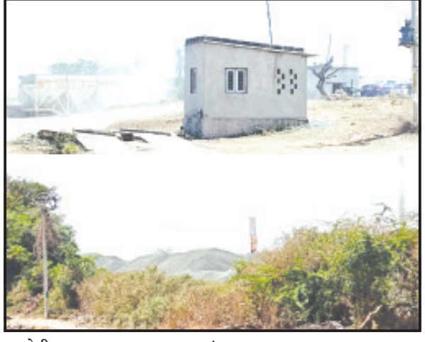
અમરેલી, તા. ૨ | પત્રમાં જણાવેલ છે કે, ખનીજ ચોરીના હલ બનેલા ગીર સોમનાથ જિલ્લામાં ગીરગઢડાના વડવીયાળા ગામે પ્રાંત અધિકારી તેમજ ગીર ગઢડા મામલતદાર દ્વારા રેડ પાડી તપાસ બાદ ખનીજ ચોરોને ટંડ ફટકારેલ અનુસંધાન પાના ૬ ઉપર

લાયન નેચર ફાઉન્ડેશન દ્વારા ખાણ-ખનિજ વિભાગને પત્ર પાઠવેલ છે