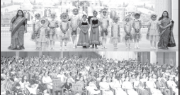
માર્ગદર્શક સાબિત થઈ રહી છે.

૧૮મી સદીમાં જયારે સામાજિક, ધાર્મિક, નૈતિક અને રાજકીય ક્ષેત્રે મહિલાઓની સ્થિતિ દુષ્કાંડી હતી, ત્યારે ભગવાન શ્રી સ્વામિનારાયણે મહિલા ઉત્કર્ષની જ્યોત પ્રગટાવી. ભગવાન શ્રી સ્વામિનારાયણે કરેલા નારી ઉત્કર્ષનાં કાર્યોમાં તેઓના સર્વતોમુખી ઉત્કર્ષ અને આધ્યાત્મિક વિકાસની ખેવના હતી.