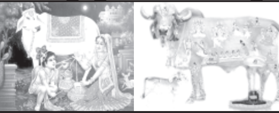
અમરેલી, તા. ૧૬

દુધ એ 'સંપૂર્ણ આહાર' તરીકે ઓળખાય છે. તેમાં વિટામિન 'સી' સિવાય તમામ વિટામિન રહેલા છે. સામાન્ય રીતે ભેંસ, ગાય અને બકરીના દુધનો ઉપયોગ આહાર તરીકે થાય છે, જેમાં ગાયનું દુધ શ્રેષ્ઠ ગણવામાં આવે છે. દુધને ખોરાકમાં રાજા ગણવામાં આવે છે, કારણકે દુધમાં તે દરેક પોષક તત્ત્વો છે જે શરીરનાં સંપૂર્ણ વિકાસ માટે સર્વોત્તમ છે. દુધથી આપણા શરીરને ભરપૂર માત્રામાં કેલ્શિયમ મળે છે. દુધમાં પ્રોટીનની માત્રા પણ સારા પ્રમાણમાં છે. સામાન્ય રીતે તેમાં ૮૫ જેટલું પાણી હોય છે અને બાકીના ભાગમાં તમામ પોષક તત્ત્વો હોય છે. દુધમાં પ્રોટીન, કેલ્શિયમ સૌથી વધારે પ્રમાણમાં હોય છે. આ ઉપરાંત વિટામિન એ, ડી, કે અને ઈ તથા ફોસ્ફરસ, મેગ્નેશિયમ, આયોડીન તેમજ અન્ય ખનીજો અને ચરબી હોય છે. દુધમાં રહેલું પ્રોટીન ઈન્ફેક્શનથી પણ બચાવે છે. ઘણી એવી માન્યતાઓ છે કે દુધ કેલ્શિયમમાં કારણે સકેટ હોય છે, પરંતુ એવું નથી ગાયના દુધમાં દર લિટરે ૧.૨ ગ્રામ કેલ્શિયમ અને ૩૩ ગ્રામ કે તેથી વધુ પ્રોટીન હોય છે. પ્રોટીનની ઘણી જાત છે. પરંતુ દુધમાં કેસીન જાતનું પ્રોટીન હોય છે. આ જાતનું પ્રોટીન બીજા કોઈપણ પોષક પદાર્થમાં હોતું નથી. કેસીનની હાજરીથી દુધનો રંગ સકેટ હોય છે. ગાયનાં દુધ કરતાં ભેસનાં