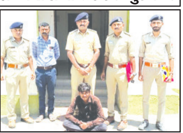
પાર્ટ-સી હેઠળ આરક્ષિત વન્ય જીવ લીલો કાચિંડો (ઇન્ડિયન કેમેલીયન), નાગ (ઇન્ડિયન કોબ્રા) ને પકડી મોબાઇલમાં ફોટોગ્રાફી કરેલ તથા શેડ્યુલ-૧નાં પાર્ટ-સી હેઠળ આરક્ષિત વન્ય જીવ ગ્રામણ (કોમન રેટ સ્પેક) ને આરોપી દ્વારા હાથ વડે પકડી લાકડી વડે મારી મૃત્યુ નીપજાવેલ. જે અન્વયે સાવરકુંડલા રેન્જના સાવરકુંડલા રાઉન્ડ અનુસંધાન પાના ૬ ઉપર