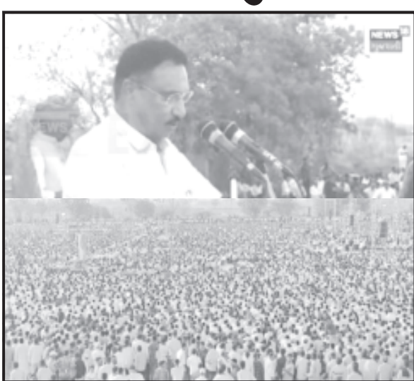
આપેલી છે આવી પરોપકાર કરનારી પુષ્ટપોત્તમભાઈરૂપાલાએ કર્યું છે તેક્ષમા ક્ષત્રિયશાંતિને આજે કલંકિત કરવાનું કામ ને પાત્ર નથી.

અમરેલી, તા. ૧૬ અડતાળા સ્ટેટ જુતુભાઈ વાળાએ રાજકોટનાં ક્ષત્રિય સંમેલનમાં જણાવ્યું હતું કે આપણે સૌએવાવર્ગમાંથી આવીએ છીએ કે દેશની સભ્યતા અને સંસ્કૃતિનો જતન કર્યું છે આપણે નિઃસ્વાર્થ ભાવે દેશની જનતાનું રક્ષણ કર્યું છે આપણે ને બતાવતા ગૌરવ અનુભવ છું કે સરદાર પટેલના અખંડ ભારતના સપનાને સાકાર કરવા આપણા રાજવીઓએ પ્રેમથી પોતાના રજવાડા આપી આપી દીધા છે અને આવી ખમીરવંતી શાંતિને આપણે સૌ પનોતા પુત્ર છીએ અને દેશના પ્રથમ વડાપ્રધાન જવાહરલાલ નેહરુ મને યાદ છે ત્યાં સુધી ૧૯૫૨માં ખેરે તેની જમીનનો કાયદો બનાવી અને ખેતીની જમીનથી વંચિત લોકોને હજારો અને લાખો એકર જમીન આપણા ગરસદારોએ જમીનદારો ને