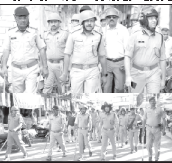
ઉના, તા. ૧૬