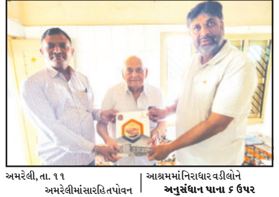
અમરેલી, તા. ૧૧ : આશ્રમમાં નિરાધાર વડીલોને અનુસંધાન પાના ૬ ઉપર

કાબરોયા પરિવારનું પ્રેરણાદાયક કાર્ય અમરેલી : સારહિ તપોવન આશ્રમને રૂપિયા એક લાખનું અનુદાન