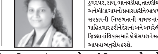
તેઓ સવારે ૯ કલાકે રાણીગામ, બાદમાં ઝડકલા, કાંગોડી, પા.

અમરેલી, તા. ૧૧ અમરેલી લોકસભા બેઠકનાં કૌંગી ઉમેદવાર જેની હુંમર આવાવી કાલ શુક્રવારે જે.સર પંથકનો પ્રવાસ કરશે.