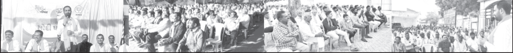
અમરેલી, તા. ૧૧ આવનાર લોકસભા ૨૦૨૪ની ચૂંટણી અંતર્ગત ભારતીય જનતા પાર્ટીનાં ઉમેદવાર ભરત સુતરીયાનાં સમર્થનમાં અમરેલી વિધાનસભામાં મોદી પરિવાર સભાની બેઠક સળી હતી જેમાં મોદી સંખ્યામાં સામાજિક તથા રાજકીય આગેવાનો જોડાયેલા હતા. ૨ થી ૩ શક્તિ કેન્દ્રો દીક તાલુકા પંચાયતનાં સીટને ધ્યાને રાખીને યોજવામાં આવેલ મોદી પરિવાર સભામાં કેન્દ્ર સરકારની કલ્યાણકારી યોજનાઓને સંબોધીને મોદી સુધી લઈ જવા તેમજ સરકારના કરેલ કાર્યોની વાત છેવાડાના લોકો સુધી પહોંચાડવા ધારાસભ્ય કૌશિક વેકરિયા ધ્વારા કાર્યકર્તાઓને આહવાન કરવામાં આવ્યું હતું. વધુમાં આવનાર લોકસભા ચૂંટણી ૨૦૨૪નાં અનુસંધાને પ્રધાનમંત્રી મોદી જયારે ત્રીજી વાર વડાપ્રધાન બનવા જઈ રહ્યા હોય ત્યારે અમરેલી વિધાનસભામાંથી મોદી સંખ્યામાં ભાજપ તરફી મતદાન કરાવીને તમામ મતદારો જ નરેન્દ્ર મોદીનાં પરિવાર છે એવું ચરિત્રાંત કરવાની હાંકલ કરવામાં આવી. ઉપરોક્ત મોદી પરિવાર સભામાં મોદી સંખ્યામાં રાજકીય-સામાજિક આગેવાનો સહિત જિલ્લા પંચાયત, તાલુકા પંચાયતના ચૂંટાયેલા આગેવાનો તેમજ સંગઠનના હોદ્દાદારો સહિત મોદી સંખ્યામાં ગ્રામજનો ઉપસ્થિત રહ્યા હતા.

ગામેગામ ભાજપનાં ઉમેદવારને જબરદસ્ત આવકાર મળતાં ભાજપનાં આગેવાનોને ઉત્સાહ વધ્યો