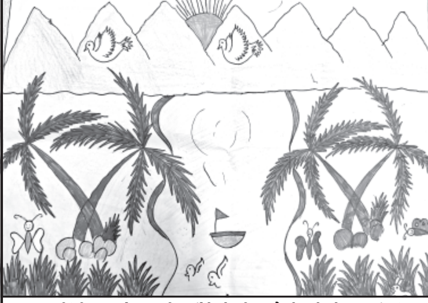
અહિં દિપક હાઈસ્કુલના વિદ્યાર્થીએ એક ચિત્ર મોકલેલ છે. તેના પરથી સુંદર વાર્તા બનાવી લખી મોકલો તો બાલ એક્સપ્રેસમાં છાપીએ...