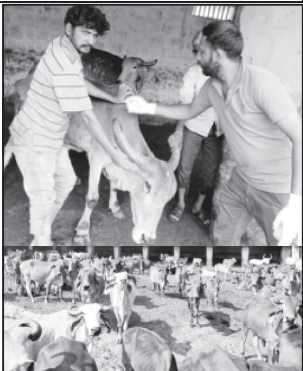
ગુજરાત સરકારનો હૃદયપૂર્વક આભાર પ્રગટ કરે છે.