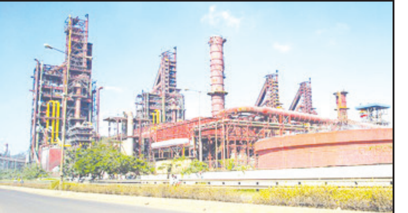
જિલ્લાની જનતા જેની વર્ષોથી ઈચ્છા સેવી રહી છે તેની પ્રતિકાત્મક તસ્વીર

અમરેલી, તા. ૩ મહેતાની સ્વપ્નસમી ભૂમિ છે અને તેઓનાં મુખ્યમંત્રી કાળમાં જિલ્લામાં આર્ટસ, કોમર્સ, સાયન્સ કોલેજ, અદ્યતન સિવિલ હોસ્પિટલ, ખોડિયાર સહિતનાં જગ્યાશયો, મુખ્ય મથક જેવી મહત્વની અનેક સુવિધાઓ મળવા પામી હતી. તેઓનાં પછીનાં રાજકીય આગેવાનોએ મહેતાની વિકાસયાત્રાને આગળ વધાવવામાં નિષ્ફળ સાબિત થયા છે. તાજેતરમાં કેન્દ્ર અને રાજ્ય સરકારે લાખો કરોડો રૂપિયાનું બજેટ જાહેર કર્યું. તેમાં અમરેલી જિલ્લાનાં ખેડૂતો, યુવાઓ, વેપારીઓ, હીરા ઉદ્યોગ, મહિલાઓનાં સર્વાંગી વિકાસ માટે સ્પેશ્યલ કોર્ટ રાહત આપવામાં આવી નથી તો અમરેલીને બ્રોડગેજ, અમરેલી-બાબરા અને અમરેલી-ચાવંડ વચ્ચેનાં માર્ગને ફોરલેન કરવાની કે કોઈ મહત્વનાં ઉદ્યોગ કે યુનિવર્સિટીની સ્થાપના સહિતની કોઈ (અનુસંધાન પાના ૬ ઉપર)