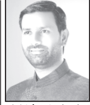
પાતે સૌની યોજનાની પાઈપલાઈનમાં વાલ્વ મુકવાના આ કામને સૈધ્ધાંતિક મંજૂરી આપી દેવામાં આવી છે.

સમયથી પડતર રહેલી માંગણીને આખરે સરકારના સિંચાઈ વિભાગ દ્વારા સ્વીકારીને મંજૂર કરવામાં આવેલ છે. ગુજરાત સરકારના જળ સંપતિ, પાણી પુરવઠા અને કલ્પસર વિભાગ, સચિવાલય, ગાંધીનગરના તા. ૨૭/૧૨/૨૦૨૩ના હુકમથી મોણપુર ગામ