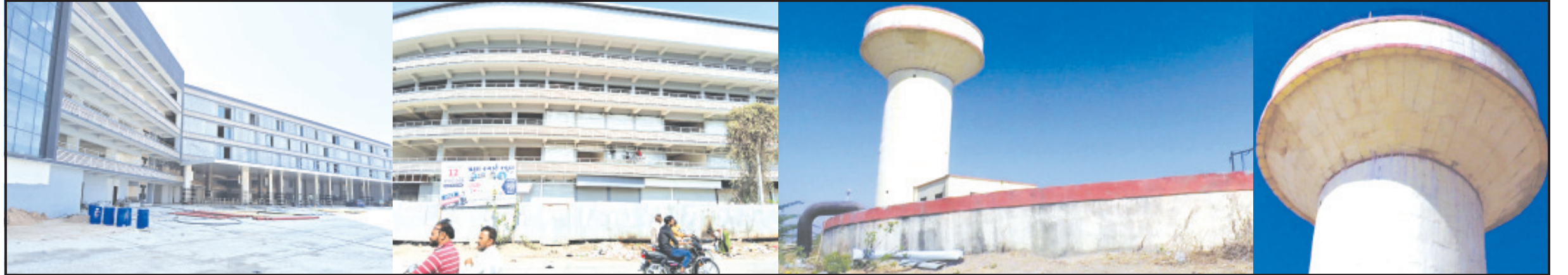
અમરેલી, તા. ૨૪ | અમરેલી શહેરમાં વિકાસકાર્યોની ગતિ ચોકચાઈથી ચાલે છે. આજના ટેકનોલોજીનાં યુગમાં વિકસિત દેશો ગણતરીનાં દિવસોમાં મહાકાય મકાનો, પુલ કે અન્ય વિકાસ કાર્યો પૂર્ણ કરી દેતા હોય તેવા સમયે અમરેલીમાં સામાન્ય કામમાં પણ બેથી સાત વર્ષનો સમય પસાર થાય છે.

રીવરફ્લોની જાહેરાત તો થઈ પણ કાર્ય શરૂ થતાં હજુ ૬ મહિના પસાર થાય તો નવાઈ નહીં