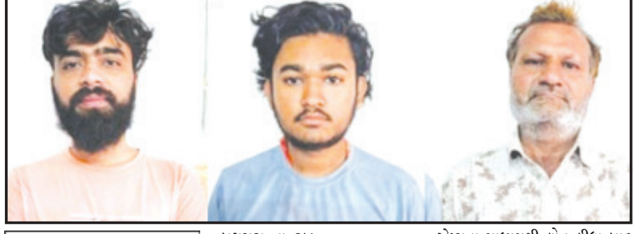
બગસરા, તા. ૨૪ | કેરળના વાયનાડ જિલ્લાના મીનંગાડી ગામે એક યુવકે લોન એપ્સના માધ્યમથી લોન લીધા બાદ ભરપાઈ કરી ન શકતા આ યુવાનને અનુસંધાન પાના ૬ ઉપર

ત્રણ આરોપીઓને સુલતાન બથેરી કોર્ટમાં રજૂ કરતાં ૧૪ દિવસનાં રીમાન્ડ મંજૂર