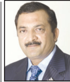
કોઈ પણ વ્યક્તિ ગેર-ટીથી પોતાને ટિકિટ મળશે તેવું કહી શકે તેમ નથી. કારણ કે અમરેલી સહિત રાજ્યની તમામ ૨૬