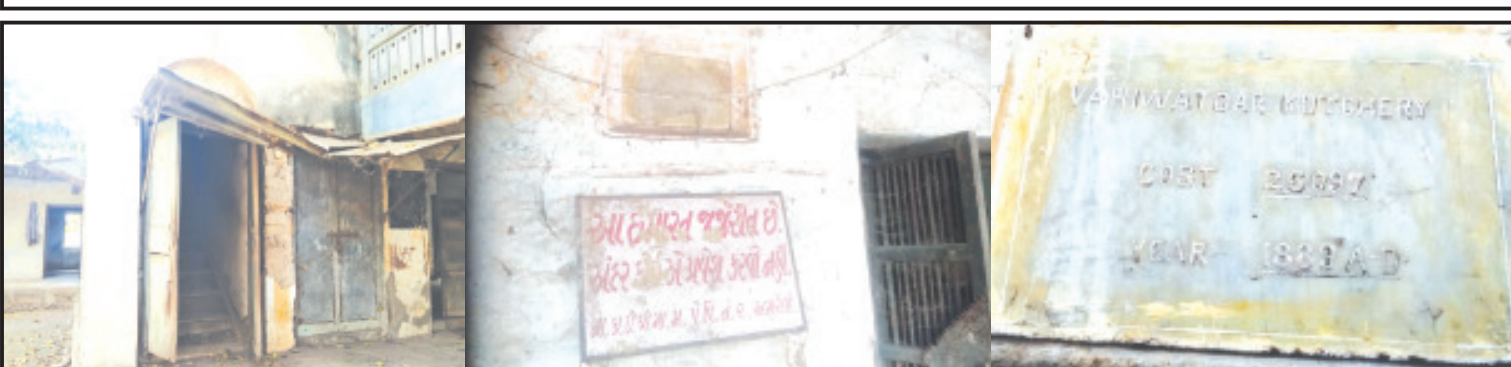
દામનગર, તા. ૨૪ | જૂની સાંસ્કૃતિક પરંપરા ભલે હોય પણ પૂર્વ સરકારી ઈમારતોની જાળવણી કરવામાં અમરેલી તંત્ર નીરસ...! કે ભલે દુર્ઘટના થાય એવા વિચારોમાં, વિકાસ કંઈ રીતે થશે...!! ઉઠેલા સવાલોના જવાબ સરકારી તંત્ર આપે એવી લાગણી છે. દેશને આઝાદી મળી ગઈ તેને પણ આજે ૭૫ વર્ષ થયા

નગરસેવકથી લઈને સાંસદ સુધીનાં પદાધિકારીઓ દરમિયાનગીરી કરે