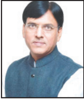
જિલ્લાનાં રાજકીય કાર્યકરો અને મતદારોમાં અનેકવિધ અટકળો અને ચર્ચાઓ જોર પકડેલ છે. કારણ કે વર્તમાન