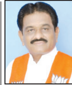
બેઠકો ઉપર પ્રધાનમંત્રી નરેન્દ્ર મોદી અને ગૃહમંત્રી અમિત શાહની જે કોઈ અનુસંધાન પાના ૬ ઉપર