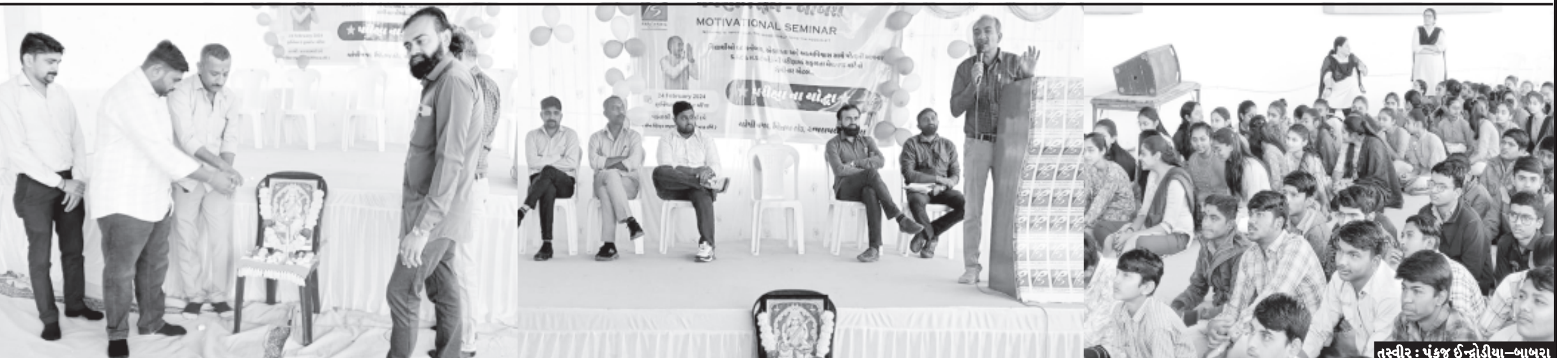
બાબરામાં પંચશીલ વિદ્યાલયમાં ધોરણ ૧૦ અને ૧૨ માં અભ્યાસ કરતા વિદ્યાર્થીઓમાં માટે શાળા પરિવાર દ્વારા પરીક્ષાના ચોક્કા શીર્ષક હેઠળ એક સેમિનારનું આયોજન કરવામાં આવ્યું હતું. જેમાં રાષ્ટ્રપતિ દ્વારા શ્રેષ્ઠ શિક્ષક એવોર્ડ વિજેતા અને કવિ શ્રી પ્રકાશભાઈ દવે દ્વારા વિદ્યાર્થીને પરીક્ષા અંગે ખૂબ સારું માર્ગદર્શન આપવામાં આવ્યું હતું અને બહોળી સંખ્યામાં વિદ્યાર્થી અને વાલીઓ હાજર રહ્યા હતા. શાળાના ટ્રસ્ટ મંડળ દ્વારા વિદ્યાર્થીઓ ભવિષ્યમાં આગળ વધે અને સફળતાના શિખર સુધી પહોંચે તેવી શુભેચ્છાઓ પાઠવી હતી.