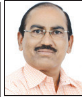
થશે અને જો સર્વસંમતિ ન થાય તો અન્ય કોઈ ઉમેદવાર બની શકે. ભારતીય જનતા પાર્ટીમાં