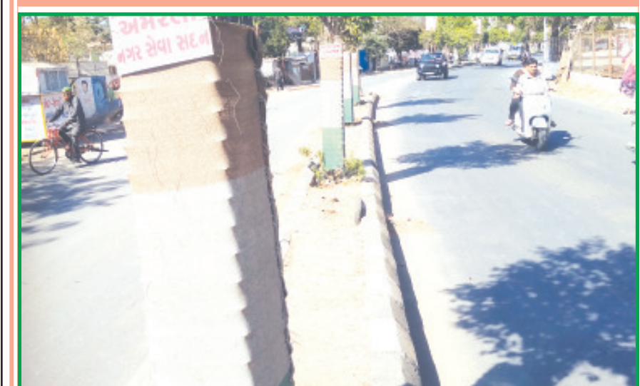
અમરેલી જિલ્લાનું મથક છે અને વિકસતા શહેરનાં માર્ગો પરનાં ડિવાઈડરમાં બંને બાજુ જાળી કીટ કરેલ ન હોય લોકો ગમે ત્યારે રસ્તો ક્રોસ કરતા હોય અકસ્માત થવાનો ભય રહેતો હોય છે. સત્તાધીશો આ પ્રશ્ન હલ કરે તે ખાસ જરૂરી છે.