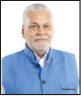
અમરેલી, તા. ૨૪ અમરેલી લોકસભા બેઠકનાં ભાજપનાં ઉમેદવાર કોણ હશે તેને લઈને

ભાજપ માટે સુરક્ષિત ગણાતી અમરેલી બેઠક પર અન્ય મુરતીયાઓ પણ મહેનત કરી રહ્યા છે