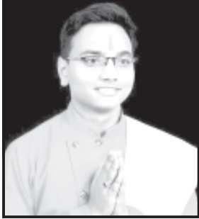
શિવકથાનું આયોજન કરવામાં આવ્યું છે. ભગવાન શ્રી નાગનાથ

બાબરા, તા. ૨૧ અમરેલીમાં આગામી તા. ૨૭ ફેબ્રુઆરીથી ૬ માર્ચ સુધી અહીં શહેરમાં પોરાણીક અને સમગ્ર શહેરના આસ્થા સમાન ભગવાન શ્રી નાગનાથ મહાદેવના મંદિરમાં ભવ્ય અને દિવ્ય શ્રી શિવમહાપુરાણ જ્ઞાન યજ્ઞનું દિવ્ય અને મંગળ આયોજન કરવામાં આવ્યું છે.