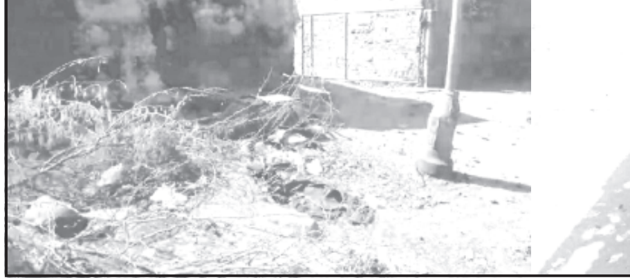
દામનગર, તા. ૨૧ સ્વચ્છતા અભિયાન, સ્વચ્છતા સર્વેક્ષણ, સ્વચ્છતા ત્યાં

પાલિકાનાં શાસકો વિકાસની વાતોને બદલે ખરા અર્થમાં વિકાસ કરે તે જરૂરી