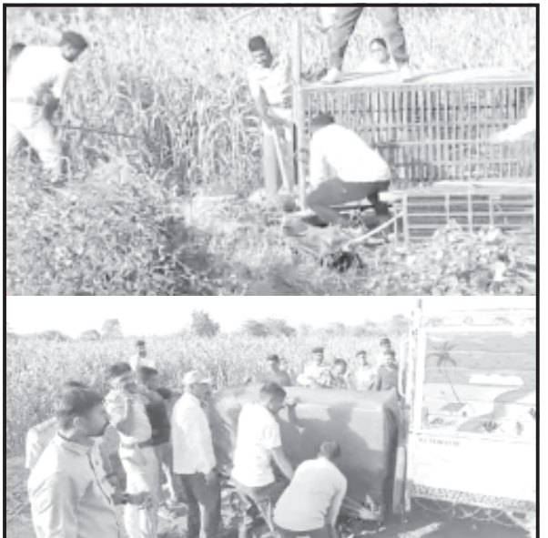
વાડીમાં આવેલ કૂવામાં ખાબક્યો હતો અને શિકાર નાશી ગયો હતો. જે અંગે

અમરેલી, તા. ૨૧ અમરેલી જિલ્લામાં વન્ય પશુઓ છાશવારે વાડી ખેતરમાં આવેલ કૂવામાં ખાબકતા હોવાના બનાવો સામાન્ય બન્યા છે. ત્યારે આજે ઢળતી સંધ્યાએ એક કદાવર દીપડાએ શિકારની પાછળ દોટ મુકતા ખૂદ શિકારી દીપડો એક વાડીમાં આવેલ કૂવામાં ખાબક્યો હતો. જે અંગે વાડીની આજુબાજુમાં રહેતા લોકોએ વન વિભાગને જાણ કરતાં વન વિભાગ ઘટના સ્થળે પહોંચ્યું હતું અને ઢળતી સંધ્યાએ વન વિભાગ દ્વારા દીપડાને રેસ્ક્યુ કરી કૂવામાંથી બહાર કાઢવામાં આવ્યો હતો.