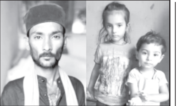
(પ્રતાપ ખુમાણ દ્વારા) સાવરકુંડલા, તા. ૧૯

મૃતક યુવકની બે બાળકીઓ અને તેમનાં જીવલસોયા પિતા આવવાના નથી છતાં રાહ જુએ છે