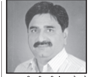
વતી અંતરથી આભાર માન્યો હતો. તેમ પ્રકાશ કારીયાની યાદીમાં જણાવેલ છે.