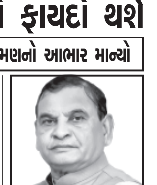
અમરેલી, તા. ૧ આજ રોજ સાંસદમાં કેન્દ્રીય નાણામંત્રી દ્વારા પ્રસ્તુત કરવામાં આવેલ વર્ષ-૨૦૨૪ના વચગાળાના બજેટને અમરેલીના સાંસદ નારણભાઈ કાછડીયાએ આવકારેલ છે. અને છેલ્લા ૧૦ વર્ષમાં સબક સાચ, સબક વિકાસના ઉદ્દેશ્યને સાકળીને દેશના ખેડૂતો, મહિલાઓ, યુવાનો અને ગરીબોને ધ્યાનમાં રાખી દેશના વિકાસમાં આગળ વધીને આજે વડાપ્રધાન નરેન્દ્રભાઈ મોદીના માર્ગદર્શન અને નિતુલ હેઠળ કેન્દ્રીય નાણામંત્રી શ્રીમતી નિર્મલા સીતારામણ દ્વારા આત્મનિર્ભર ભારતને વધુ મજબૂતી પ્રદાન કરવામાં આધારભૂત બજેટ રજુ કરવા બદલ સાંસદ પ્રધાનમંત્રી અને કેન્દ્રીય નાણામંત્રીનો સહકથ આભાર વ્યક્ત કરેલ છે.