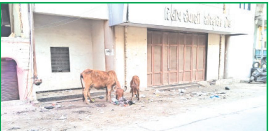
અમરેલીનાં એકમાત્ર સાંસ્કૃતિક હોલનાં દરવાજા નજીક અને જાહેર માર્ગ ઉપર ગંદકીનાં ગંજ અને તેમાં ગો-માતાનાં ખાખાખોળાની રોજિંદી ઘટનાથી શહેરીજનોમાં અરેરાટી જોવા મળતી હોય પાલિકાનાં શાસકો ગંદકી દૂર કરાવે તે જરૂરી છે.