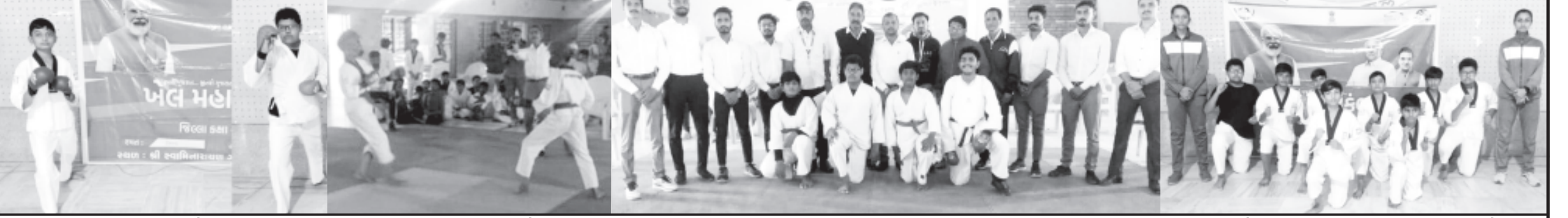
યુગ નિર્માણ ગાયત્રી યોજાયેલ ખેલ મહાકુંભમાં કરાટે સ્પર્ધામાં પહિવાર ટ્રસ્ટ સંચાલિત ગાયત્રી સંસ્કાર વિદ્યાલયની વિદ્યાર્થી જીલ્લા કક્ષાએ જીતા હતા. આ બજેટમાં કોઈ વર્ગને કાચા થયેલ નથી. હજુ પણ ગેસના ભાવ તેમજ જીવન જરૂરીયાત ચીજ - વસ્તુઓના ભાવ વધવાના છે તેના કારણે મધ્યમ વર્ગ વધુ મુશ્કેલીમાં મુકવાનો છે. માર્કેટમાં કુડના ભાવ સતત નીચા જઈ રહ્યા છે. તેનો લાભ હિન્દુસ્તાનની પ્રજાને આપવા માટેનો સામાન્ય પણ પ્રયાસ ભાજપ સરકારે આ બજેટમાં કર્યો નથી.