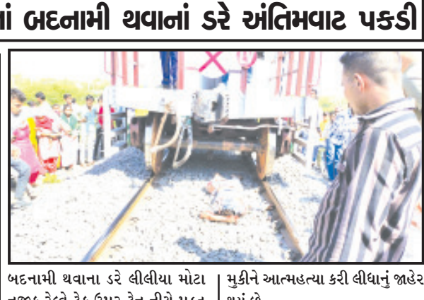
બદનામી થવાના ડરે લીલીયા મોટા નજીક રેલ્વે ટ્રેક ઉપર ટ્રેન નીચે પડતુ મુકીને આત્મહત્યા કરી લીધાનું જાહેર થયું છે.