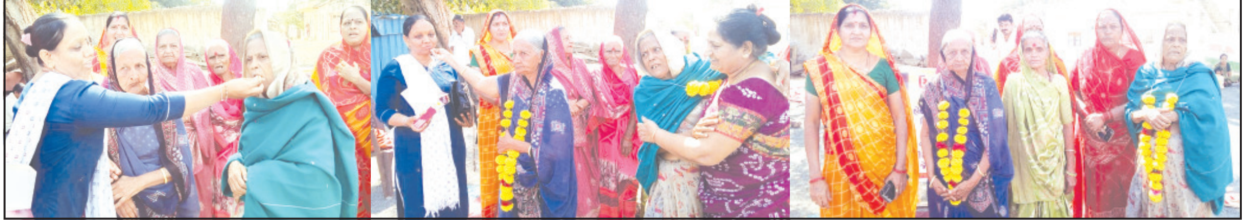
અમરેલી, તા. ૮ | બાબરાનાં ધરાઈ ગામનાં વૃદ્ધ અને તેમની પુત્રવધુએ પોલીસ ફરિયાદ નોંધવાની માંગ સાથે ઉપવાસ શરૂ કરતાં પોલીસે એકઠાઈઆર નોંધતાં વૃદ્ધા અને પુત્રવધુએ આજે પારણા કર્યા હતા.

વૃદ્ધા અને તેમની પુત્રવધુએ આરોપી સામે પોલીસ ફરિયાદ નોંધાવવા ઉપવાસ શરૂ કર્યા હતા | સ્થાનિક પોલીસે ૪ થી ૫ સામે નામજોગ અને ૨૦ થી ૨૫ અનામી વ્યક્તિઓ વિરૂદ્ધ ફરિયાદ નોંધી | આરોપીઓએ ૮ થી ૧૦ તોલા સોનાની ચોરી પણ કર્યાનો ફરિયાદમાં ઉલ્લેખ | ૭ મહિનાનાં અંતે વૃદ્ધાને ન્યાય મળતાં વૃદ્ધાએ સહકાર આપનારનો આભાર માન્યો