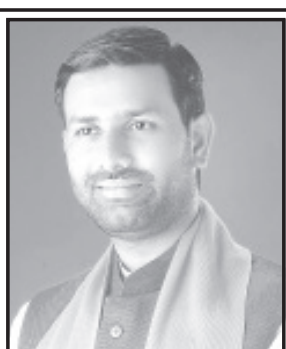
કામ મંજૂર થતાં દૂક સમયમાં આ કામ માર્ગ અને મકાન વિભાગ દ્વારા હાથ