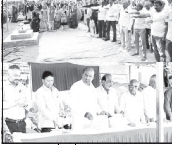
સરકારી જનકલ્યાણકારી યોજનાઓની વિસ્તૃત જાણકારી આપીને લાભાર્થીઓને સરકારી યોજનાઓનો લાભ લેવા જણાવ્યું હતું. આ તકે લાભાર્થીઓને સરકાર તરફથી આપવામાં આવેલા લાભોનું વિતરણ કરવામાં આવ્યું હતું. મેરી કહાની, મેરી જુબાની હેડબે લાભાર્થીઓએ યાત્રાનાથી થયેલા ફાયદાઓ અંગે અનુભવો વર્ણવ્યા હતા. યાત્રાની સાથે વિવિધ સરકારી વિભાગોના કર્મચારીઓ સર્વ