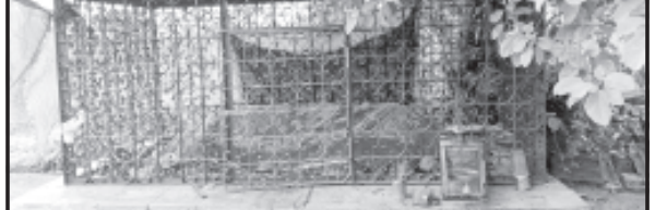
વીજપડી, તા. ૮