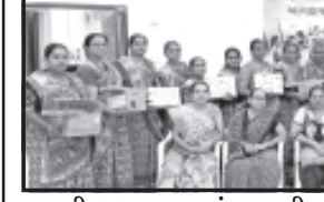
તસ્વીર : વાઘ સુમરા - કોવાયા

કોવાયા, તા. ૮ અલ્ટ્રાટેક સિમેન્ટ ગુજરાત સિમેન્ટ વર્કસનાં કોવાયા વિભાગ દ્વારા બાળકોના સર્વાંગી વિકાસ માટે હમેશા તત્પર રહે છે. વિવિધ જાગૃતતા કાર્યક્રમો, પ્રવેશ ઉત્સવ, જરૂરીયાતનું એજ્યુકેશનલ મટીરીયલ વગેરેનું વિતરણ જેવા વિવિધ આયોજનો દ્વારા બાળકોનો ઉત્સાહ વધારવાનો પ્રયાસ રહે છે.