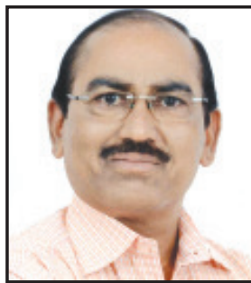
રામ મંદિર પ્રાણ પ્રતિષ્ઠા મહોત્સવને

લઈને ભાજપ અને સંગલગ્ન સંસ્થાઓ સક્રીય બની છે અને ત્યારબાદ એટલે કે આગામી મહિનેથી લોકસભા ચૂંટણીનો