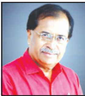
અમરેલી, તા. ૮

જો કે ભાજપ હાઈકમાન્ડ દ્વારા આગામી મહિનામાં પેનલ બનાવવામાં આવે બાદ ચિત્ર સ્પષ્ટ થશે