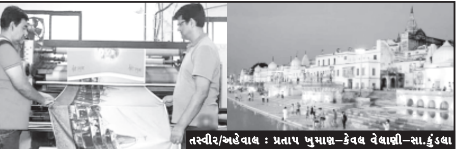
તસ્વીર/અહેવાલ : પ્રતાપ ખુમાણ-કેવલ વેલાણી-સા.કુંડલા

રામ મંદિરનાં તમામ કપડા આપવાનું વચન અપાયું