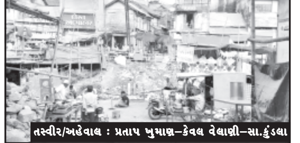
તસ્વીર/અહેવાલ : પ્રતાપ ખુમાણ-કેવલ વેલાણી-સા.કુંડલા બારેમાસ આ વિસ્તારનો ઘણો ટ્રાફિક હળવો થઈ શકે. આ સંદર્ભે સાવરકુંડલા નગરપાલિકા દ્વારા યોગ્ય સર્વે કરાવી અહીં પાકો આરસીસી પુલ બનાવવામાં આવે એવું આ વિસ્તારનાં રહીશો ઈચ્છે છે. પ્રસ્તુત તસ્વીર જોઈને

સાવરકુંડલા, તા. ૮ સાવરકુંડલા શહેરમાં નદી બજાર પાસે આવેલ કંસારા બજાર અને શહેરની મધ્યમાંથી પસાર થતાં હાઈવેને જોડતો એક પુલ બને તો કંસારા બજાર તરફ જતાં આવતાં રાહદારીઓ અને વાહન ચાલકોને ઘણી રાહત મળે. આમ તો શહેરની વયોવર્ય મધ્યમાંથી નાવલી નદી વહે છે. ખાસ કરીને ચોમાસામાં આવતાં પૂરને કારણે આ નદીનાં પટમાં વહેતાં ધસમસતા પાણીનાં વહેણમાં પાકો આરસીસી પુલ હોય તો જ ટકી શકે. પુલનું નિર્માણ થાય તો માત્ર ચોમાસામાં જ નહીં પરંતુ