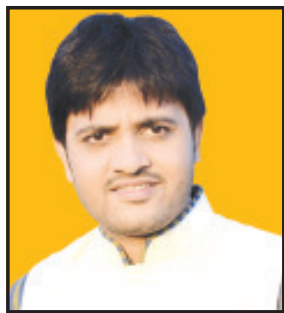
દેશમાં ૨૨ મી જાન્યુઆરીએ