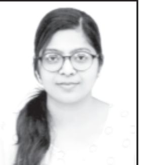
સેમેસ્ટર-૩માં ઉત્તીર્ણ થયેલ તમામ વિદ્યાર્થીઓને કોલેજ સ્ટાફ તથા અમરેલી કેળવણી મંડળ ટ્રસ્ટી ગણના ખુબ ખુબ હાર્દિક અભિનંદન પાઠવવામાં આવ્યાં હતાં.