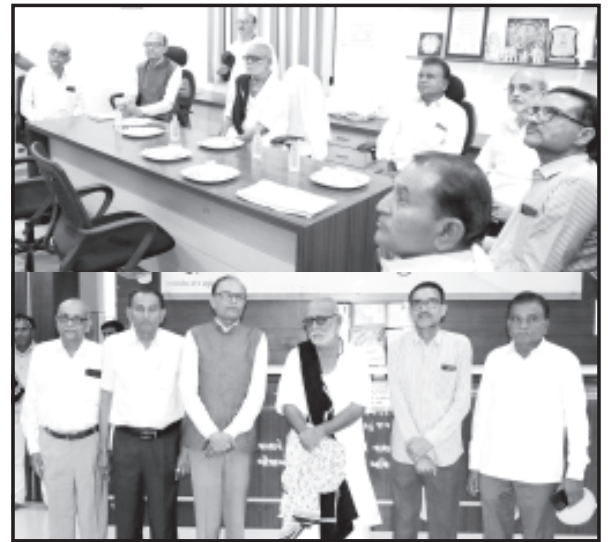
દાખલ દર્દીઓને રૂબરૂ મળીને ખબર અંતર પૂછ્યા હતાં. પૂ. બાપુએ હોસ્પિટલને સહાયરૂપ થવાનાં

ટીબી, તા. ૬ સ્વામી શ્રી નિર્દોષાનંદજી માનવસેવા હોસ્પિટલ-ટીબી(જી. ભાવનગર)માં તા. ૫/૧/૨૦૨૪નાં રોજ આંતરરાષ્ટ્રીય સંત એવા પરમવંદનિય પુ.શ્રી મોરારિબાપુએ પધરામણી કરી હતી. પૂજ્ય બાપુનું હોસ્પિટલનાં સ્થાનિક ટ્રસ્ટીઓ દ્વારા પુષ્પહાર અને પુષ્પગુચ્છથી સ્વાગત, સન્માન કરી આશિર્વાદ પ્રાપ્ત કર્યા હતા. પૂજ્ય બાપુએ હોસ્પિટલ અંગેની વિસ્તૃત માહિતી મેળવી રાજ્યપો વ્યકત કર્યો હતો. પૂજ્યબાપુ સદગુરુદેવ શ્રી નિર્દોષાનંદ સરસ્વતીજી મહારાજની પ્રેરણા, અનુકંપા તેમજ આશિર્વાદથી ચાલતા તદ્દન નિ:શુલ્ક આરોગ્યલક્ષી સેવાકાર્યની ખુબ જ પ્રશંસા વ્યકત કરી હોસ્પિટલ ટ્રસ્ટીમંડળ, ઉદારદિલ દાતાઓ, શુભેચ્છકો, ડોક્ટરો અને સમગ્ર હોસ્પિટલ સ્ટાફ પરિવારને આશિર્વચન પાઠવ્યા હતા. ત્યારબાદ હોસ્પિટલમાં