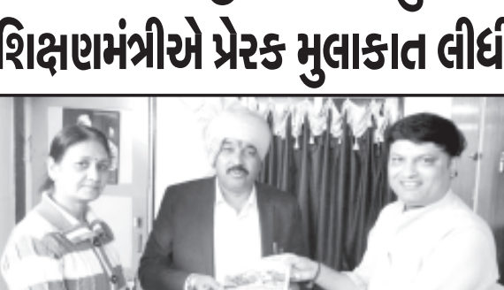
અમરેલી, તા. ૬ ગુજરાતનાં શિક્ષણમંત્રી કુબેરભાઈ ડિંડોરએ અમરેલીનાં જાણીતા શ્રીજી વિદ્યાર્થી ભુવનની પ્રેરક મુલાકાતે આવ્યા હતા. આ સંસ્થાની શૈક્ષણિક પ્રવૃત્તિઓ અને શાળા પરિસરનું શૈક્ષણિક વાતાવરણ જોઈને હૃદયથી પ્રસન્નતા વ્યકત કરી હતી. સંસ્થાનાં બાળકો સાથે ખૂબ જ રસપૂર્વક વાતો કરી હતી.