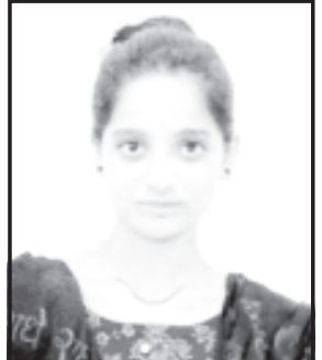
અમરેલી, તા. ૬ અમરેલી કેળવણી મંડળ ટ્રસ્ટ સંચાલિત નૂતન કોમર્સ કોલેજનાં એસ.વાય.બી.કોમ. સેમેસ્ટર-૩ માં કોલેજ પ્રથમ ત્રણ આવનાર