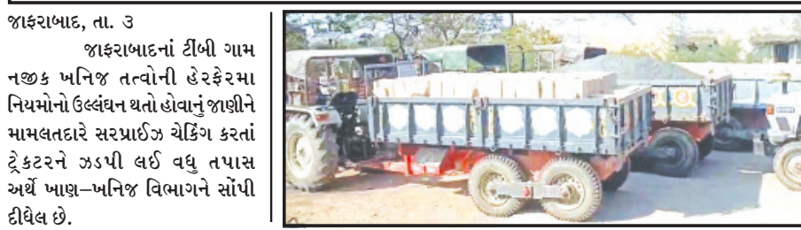
ખાંભા, તા. ૩ ખાંભા-તુલસીશ્યામ રેન્જમાં ટીબી નજીક ખનિજ તત્વોની હેરફેરમાં ઓવરલોડ થતાં ટ્રેક્ટરને મામલતદારે ઝડપી લીધા અને વધુ તપાસ અર્થે ખાણ-ખનિજ વિભાગને સોંપી દીધેલ છે.