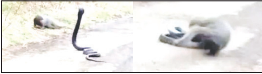
રાજુલા, તા. ૩ ખાંભા-તુલસીશ્યામ રેન્જ પર સાપ અને નોળિયાની લડાઈનો વિડિયો આવ્યો સામે. બાબરપરા રેલવે અનુસંધાન પાના ૬ ઉપર