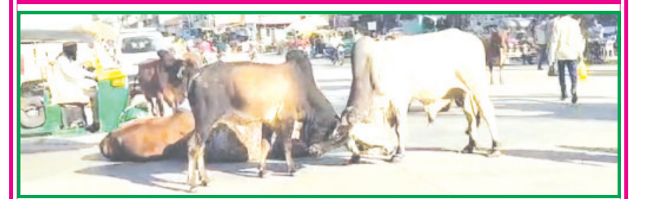
અમરેલીનાં ડો. જીવરાજ મહેતા ચોકમાં અવારનવાર રખડતા પશુઓ અડિંગો જમાવીને બેઠા હોય છે અને આજે તો બે આખલાઓ વચ્ચે ઘમાસાણ યુધ્ધ શરૂ થતાં શહેરીજનોમાં ફફડાટ ફેલાયો હતો.