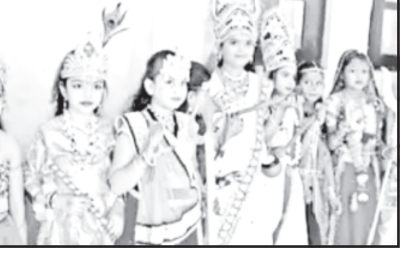
અમરેલી પટેલ સંકુલ હોસ્ટેલ નિવાસી ૫૦૦૦ વિદ્યાર્થીનીઓએ પોતાનાં ગુપ પ્રમાણે ૩૧ ડિસેમ્બર ૨૦૨૩ની ઉજવણી ડાન્સીંગ, સિંગિંગ અને વેશભૂષા સાથે ઘો. કેજ થી પીજી સુધીની વિદ્યાર્થીનીઓ સાથે પોતાને મનગમતી વેશભૂષા તેમજ પોતાની મનગમતી કૃતિઓ ગીત-સંગીતની કૃતિઓ રજૂ કરી આનંદભરે ઉમંગથી સંકુલનાં સ્ટેજ પરથી રજૂ કરી.

અમરેલી, તા. ૩ અમરેલી પટેલ સંકુલ હોસ્ટેલ નિવાસી ૫૦૦૦ વિદ્યાર્થીનીઓએ પોતાનાં ગુપ પ્રમાણે ૩૧ ડિસેમ્બર ૨૦૨૩ની ઉજવણી ડાન્સીંગ, સિંગિંગ અને વેશભૂષા સાથે ઘો. કેજ થી પીજી સુધીની વિદ્યાર્થીનીઓ સાથે પોતાને મનગમતી વેશભૂષા તેમજ પોતાની મનગમતી કૃતિઓ ગીત-સંગીતની કૃતિઓ રજૂ કરી આનંદભરે ઉમંગથી સંકુલનાં સ્ટેજ પરથી રજૂ કરી.