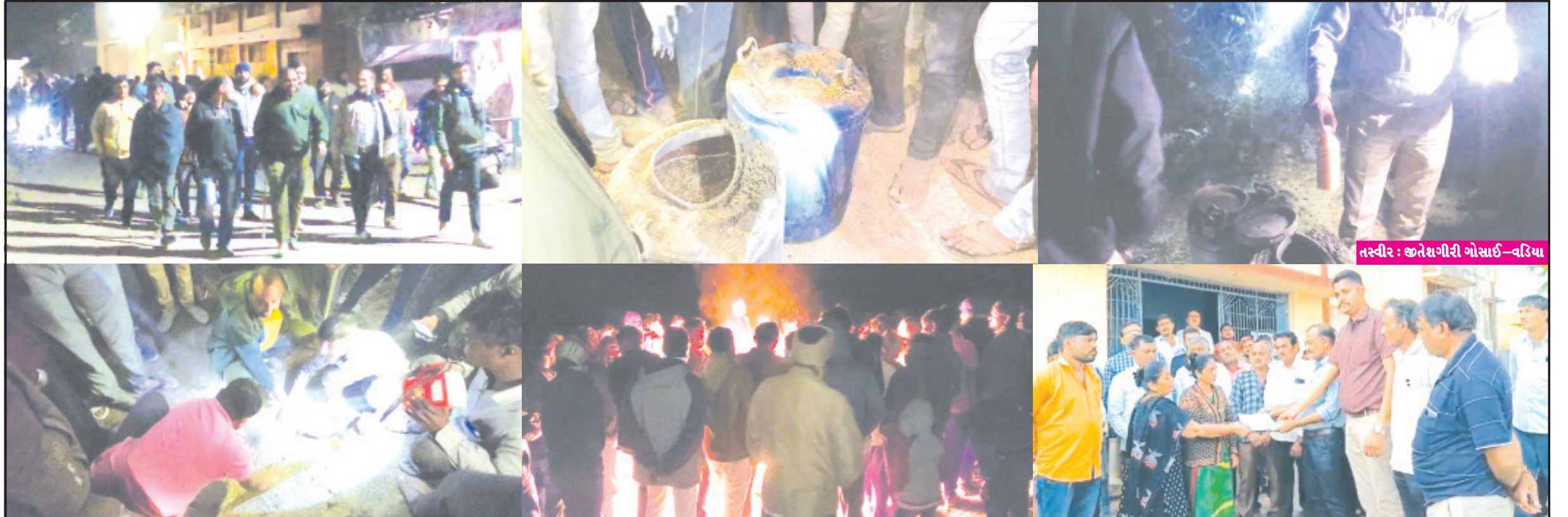
અમરેલી, તા. ૨૪ વડિયાનાં હનુમાન ખીજડીયાનાં ગામજનોએ રાજ્યનાં ૧૮ હજાર ગામની જનતા માટે એક પ્રેરણાદાયી કાર્ય કર્યું છે અને ગામમાં દેશી દારૂ કે માંસ મટનનાં વેચાણ સામે જનતા રેડ કરીને ગાંધીનાં ગુજરાતને (અનુસંધાન પાના ૬ ઉપર)

નાના એવા ગામમાં મોટા રાજકીય પક્ષોનાં આગેવાનોનો વસવાટ છતાં પણ દેશી દારૂનું વેચાણ ઝડપાયું ગામજનોએ શ્રીરામ મંદિરની પ્રાણ પ્રતિષ્ઠા બાદ ગામમાંથી અસામાજિક પ્રવૃત્તિ બંધ કરાવવાની ભિષ્મ પ્રતિજ્ઞા લીધી સતત ૩ દિવસ સુધી ગામજનોએ જબ્બરી જાગૃતતા દાખવીને બે વખત જનતા રેડ કરી સ્થાનિક પોલીસને પણ સાથે લીધી અને સરપંચને પણ લેખિતમાં રજૂઆત કરી