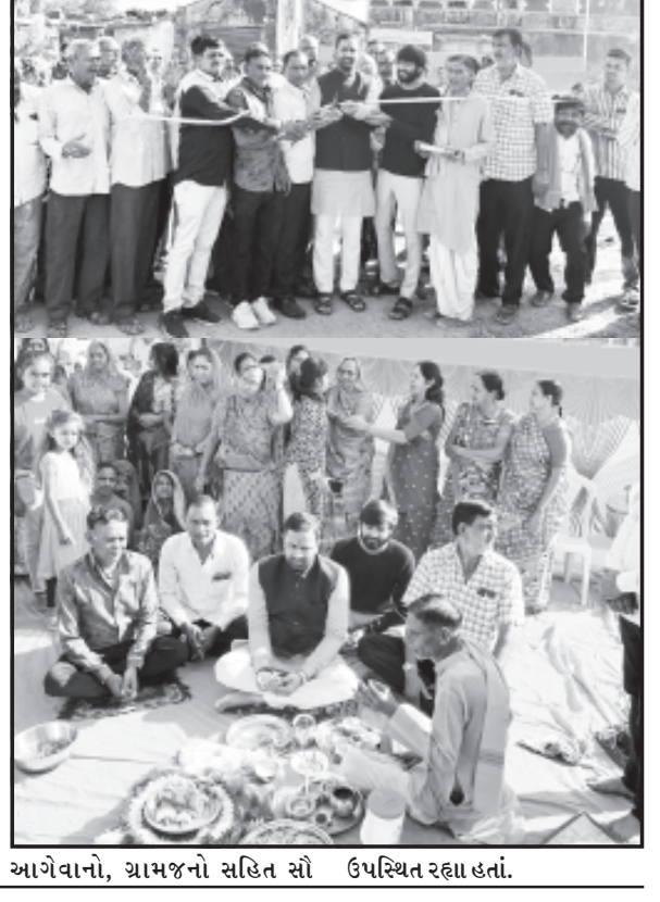
આગેવાનો, ગ્રામજનો સહિત સૌ ઉપસ્થિત રહ્યા હતાં.

અમરેલી તા. ૨૪ અમરેલી જિલ્લામાં વિકાસકાર્યો તેજ ગતિથી આગળ ધપી રહ્યા છે. અમરેલીના કુંડાવાવ તાલુકાના કોલડા મુકામે વિવિધ વિકાસકાર્યોના લોકાર્પણનો કાર્યક્રમ યોજાયો હતો. વિધાનસભાના નાયબ મુખ્ય દંડક અને અમરેલી વિસ્તારના ધારાસભ્ય કૌશિકભાઈ વેકરિયાની પ્રેરક ઉપસ્થિતિમાં અંદાજિત કુલ રૂ. ૩૦ લાખના ખર્ચે તૈયાર થયેલ નવનિર્મિત બસ સ્ટેશનનું લોકાર્પણ સંપન્ન થયું હતું. ઉપરાંત સરદાર વલ્લભભાઈ પટેલ સ્ટેચ્યુ, ગામ પ્રવેશ દ્વાર સહિત પાણી પુરવઠા વિભાગ અંતર્ગત પાણીની ટાંકીનું પણ લોકાર્પણ કરવામાં આવ્યું હતું. રાજ્ય સરકાર દ્વારા સમગ્ર ગુજરાતમાં વિકાસકાર્યો તેજ ગતિથી આગળ ધપી રહ્યા છે ત્યારે અમરેલી જિલ્લામાં પણ વિવિધ વિકાસકાર્યો વેગવેગા છે. નાગરિકોની સુવિધાઓમાં વધારો થાય ઉપરાંત આંતરમાળ પાકીય સુવિધાઓ ડેવલપ થાય તે માટે સરકાર પ્રતિબદ્ધ છે. કુંડાવાવ તાલુકાના કોલડા મુકામે વિવિધ વિકાસકાર્યોના લોકાર્પણ કાર્યક્રમમાં સ્થાનિક