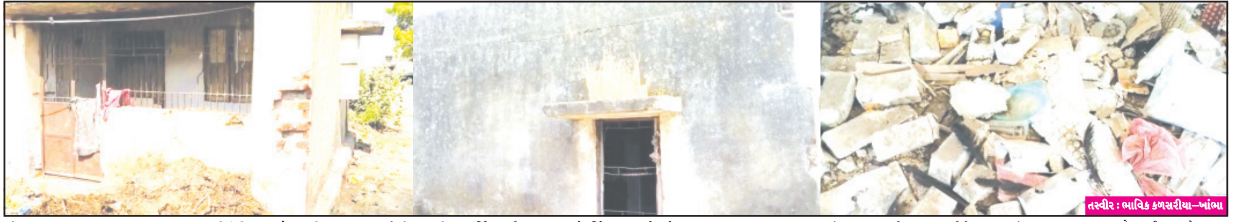
ખાંભા, તા. ૨૪ અમરેલી જિલ્લા આરોગ્ય વિભાગ દ્વારા ૨૫ વર્ષ પહેલા બનાવેલ નર્સિંગ ક્વાર્ટર ચાલુ ન કરાતા કે નર્સિંગ સ્ટાફને રહેવા ન ફાળવતા વગર વપરાશ ખંડેર હાલતમાં જોવા મળી રહ્યા છે. ખાંભાના ભગવતીપરા ખાતે જિલ્લા આરોગ્ય વિભાગ દ્વારા ૨૫ વર્ષ પહેલા સંપૂર્ણ સુવિધાજનક બે ક્વાર્ટર્સ બનાવવામાં આવ્યા બાદ નર્સિંગ સ્ટાફને ફાળવવા વગરના ખાલી પડેલા બંને ક્વાર્ટર્સ ભંગારના ડેવા સમાન જોવા મળી રહ્યા છે. હાલ બારી-દરવાજા (અનુસંધાન પાના ૬ ઉપર)

અઠી દાયકા પહેલા બનેલ આરોગ્યકર્મીઓ માટેના ક્વાર્ટર વગર ઉપયોગે ખંડેર બની ગયા બંને ક્વાર્ટરમાં સરકારી ફાઇલો અને દવાઓ સહિતનો મુદ્દામાલ ભંગાર હાલતમાં જોવા મળે બારી-દરવાજા વગરનાં ક્વાર્ટરમાં અસામાજિક તત્વોની પ્રવૃત્તિ વધી હોય તેવું જોવા મળે છે જિલ્લાનાં આરોગ્ય વિભાગનાં ઉચ્ચ અધિકારીઓ આગળ ખંખેરી યોગ્ય કરે તેવી માંગ ઉભી થઈ