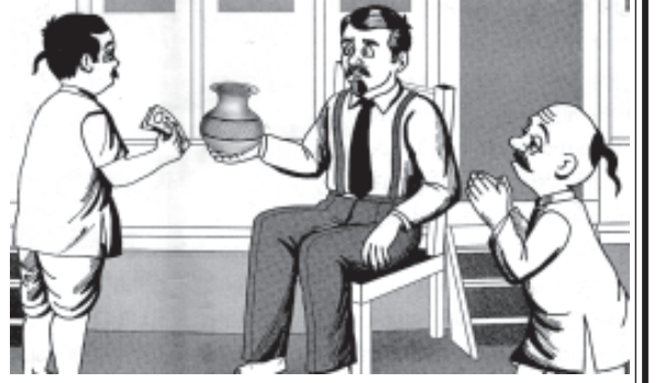
આવી અને લોટો પણ જુનો-પુરાણો ઘોલાવણો હતો જે લાલાજીને બિલકુલ પસંદ નહોતો.

કાશીની મુખ્ય બજારમાં જ મકાન ધરાવતા લાલા જાઉલાલને ખાવા-પીવાના ખર્ચની ખોટ નહોતી. તેઓ ઉપલા માળે રહેતા અને નીચેની દુકાનોનું જુના જમાનામાં રૂ. ૧૦૦ ભાડું આવતું હતું. તેમાં બંને માણસનો જીવન-નિર્વાહ ચાલતો હતો. એક દિવસ તેમની પત્નીએ એકીસાથે અડીસો રૂપિયાની માંગણી કરી, જેનાથી લાલાજી નડસ થઈ ગયો. તેની દશા જોઈને તેની પત્નીએ કહ્યું, 'ગભરાવ નહીં, તમારી ત્રેવડ ન હોય તો હું મારા ભાઈ પાસેથી લઈ આવીશ!' આ મીઠાં મારથી લાલા સમસમી ઊઠ્યા અને રોષ સાથે કહ્યું, 'અડીસો રૂપિયા માટે તારા ભાઈ પાસે ભીખ ન માંગતી, હું આપીશ.' પત્ની બોલી, 'પણ મારે આ ભવમાં જ જોઈએ!' લાલાજીએ કહ્યું, 'આ સપ્તાહમાં જ લઈ લેજે.' પત્નીએ પૂછ્યું, 'આ મર્દની જબાન છે?' લાલાજીએ કહ્યું, 'આજથી સાતમા દિવસે અડીસો રૂ.' જેમતેમ કરી લાલાજીના પાંચ દિવસ વીતી ગયા, પણ કોઈ પ્રબંધ ન થઈ શક્યો. છટે દિવસે ગભરાઈને લાલાજીએ તેના મિત્ર પંડિત વ્રજવાસીને વિપદા સંભળાવી, પણ સંજોગ એવા હતા કે પંડિતજી પણ ત્યારે સાવ લુખ્ખા હતા. છતાં આશ્વાસન આપતાં કહ્યું, 'પૈસાનો જોગ થશે તો હું કાલ સાંજ મળીશ.' અને એ સાંજ આવી પહોંચી. સપ્તાહનો અંતિમદિવસ હતો. લાલાજી અગાસી પર ટહેલી રહ્યા હતા. ચિંતાથી ગળું સુકાઈ રહ્યું હતું. તેણે પાણી માટે અણજ ટીથો અને તેની પત્ની પાણી લઈને આવી, પણ ગલાસ લાવતા ભૂલી ગઈ. બંધરીયા લોટામાં પાણી લઈને