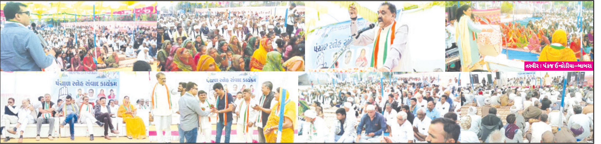
બાબરા, તા. ૯ બાબરા તાલુકાનાં પંચાળ વિસ્તારમાં સુખપુર મુકામે સ્નેહ સંવાદ કાર્યક્રમ અદી હજારથી ઉપરની વિશાળ સંખ્યામાં બહેનોની વિશાળ હાજરીમાં યોજાયો હતો. કાર્યક્રમનાં પ્રમુખ સ્થાને પ્રતાપભાઈ દુધાતે તેના વક્તવ્યમાં જણાવ્યું હતું કે, જેણે ગામડા જોયા નથી તેવા લઈકો ચૂંટાયા છે તેના કારણે ગરીબ લોકો પરેશાન થઈ રહ્યા છે. વિસ્તારની ચિંતા કરતાં લોકો હાયાં છે ઉમેદવાર નથી હાયાં, જનતા હારી છે, અમરેલી જિલ્લો હાયાં છે, સરકારી ખર્ચ કાર્યક્રમો કરે છે પણ ગણ્યા-ગાંઠ્યા લોકો પણ સભામાં ભેગા થતા નથી તે સરકારની નિષ્ફળતા છે, કોંગ્રેસની સરકાર ગામડાનાં સામાન્ય લોકોની ચિંતા કરતી હોય તેમ દાખલો આપી પૂર્વ મુખ્યમંત્રી માધવસિંહ સોલંકીની આજે પૂણ્યતિથિ છે તેમણે મધ્યાહન ભોજન યોજના દાખલ કરી ગરીબ પરિવારોના બાળકોને ભળવા અનુસંધાન પાના ૬ ઉપર

કોંગ્રેસ પ્રમુખ જણાવ્યું કે જેઓએ ગામડા બેચા નથી તેવા વ્યક્તિઓ ચૂંટાયા હોવાથી ગરીબ જનતા પરેશાન થઈ રહી છે પૂર્વ સાંસદે સમગ્ર જનતાને ડરમાંથી બહાર નીકળવા માટે હાંકલ કરી હતી ગુજરાતની મહિલાઓ પર અત્યાચારો વધ્યા અને ગેસનાં ભાવમાં ઉઘાડી લૂંટ : જેનીબેન હુમર દિ'ઉગેને ખોટું બોલનારને હાંકી કાટવાનું જણાવતા ઠાકરશીભાઈ મેતલીયા