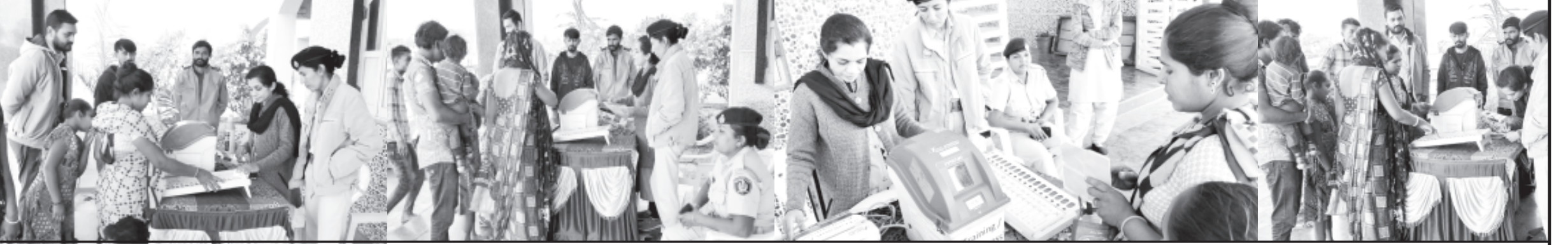
લોકસભા સામાન્ય ચૂંટણી-૨૦૨૪ અન્વયે ધવીએમ તથા વીવીપેટ નિદર્શન અને મતદાર જાગૃતિ અર્થે રથ પરિભ્રમણ કરી રહ્યા છે. આ અંતર્ગત અમરેલી જિલ્લાના બગસરા તાલુકાના હામાપુર સહિતના ગામોમાં મતદાર જાગૃતિ રથ પહોંચ્યા હતા. ચૂંટણી ફરજ પરના કર્મચોગીઓ દ્વારા આ રથ દ્વારા ઈ.વી.એમ. વિશેની માહિતી અને માર્ગદર્શન આપવામાં આવ્યા હતા. મતદાર માટેની પ્રક્રિયા અંગે જાગૃતિ પ્રસારવામાં આવી હતી.