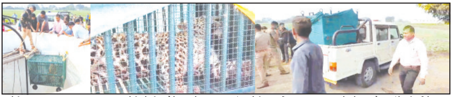
અમરેલી, તા. ૯ અમરેલી શહેરની ભાગોળે આજે સવાર સવારમાં અમરેલીના બાયપાસ રોડ ઉપર આવેલ કેલાસ મુક્તિધામ સ્મશાન પાછળ આવેલ એક વાડી ખેતરના કુવામાં દીપડો ખાબક્યો હતો. આ અંગે વાડી માલિકે અનુસંધાન પાના ૬ ઉપર

વન વિભાગને ખબર જ નથી કે દીપડા, સિંહ ક્યાં આંટાફેરા મારી રહ્યાં છે