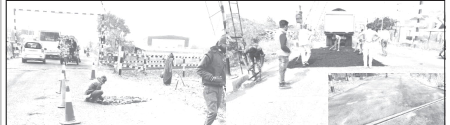
અમરેલી, તા. ૯ અમરેલીનાં સાંસદ નારણભાઈ કાછડીયા દ્વારા ડી.આર.એમ., વેસ્ટર્ન રેલવેને કરવામાં આવેલ તાકીદના અનુસંધાને અમરેલી સંસદીય ક્ષેત્ર હેઠળ આવેલ વિવિધ રેલ્વે ફાટકો પરના જર્જીત માર્ગોનું મરામત કાર્ય તાત્કાલિક અસરથી ચાલુ કરવામાં આવેલ છે. અમરેલીના લોકો તેમજ રાહદારીઓ તરફથી રેલ્વે ફાટકો પરના જર્જીત માર્ગોના લીધે વાહન ચાલકોને પડતી મુશ્કેલીઓ અંગે સાંસદને કરવામાં આવેલ રજૂઆતના અનુસંધાને સાંસદએ તાત્કાલિક રેલ્વે વિભાગ તેમજ ડી.આર.એમ.ને ટેલીફોનિક જાણ કરી અમરેલી ક્ષેત્ર અંતર્ગત આવેલ રેલ્વે વિભાગ હસ્તકના તમામ જર્જીત માર્ગોનું મરામત કાર્ય કરવા માટે જરૂરી સુચના આપેલ હતી. જેના પરીણામ સ્વરૂપે રેલ્વે વિભાગ દ્વારા અમરેલી જિલ્લાના વિવિધ ફાટકો પર મરામત કાર્ય ચાલુ કરવામાં આવેલ છે. જે પૈકી એલ.સી. નં. ૬૭ સહીતના ફાટકોનું મરામત કાર્ય એક દિવસમાં જ પૂર્ણ થવા પામેલ છે.