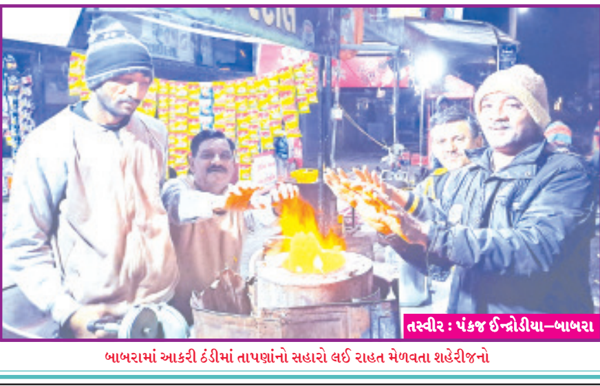
બાબરામાં આકરી ઠંડીમાં તાપણાનો સહારો લઈ રાહત મેળવતા શહેરીજનો