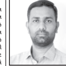
અન્યથે સરકારનાં માર્ગ અને મકાન વિભાગનાં પંચાયત હસ્તકનાં આ કામ

અમરેલી, તા. ૯ અમરેલીનાં યુવાન ધારાસભ્ય અને ગુજરાત વિધાનસભાનાં નાયબ મુખ્ય દંડક કૌશિક વેકરિયાએ પોતાનાં મત વિસ્તારનાં રસ્તાઓનો કામો તાત્કાલિક ધોરણે મંજૂર થાય અને વરસાદથી નુકશાન પામેલા રોડનાં રિકાપેટ કરવાનાં કામ જલદી હાથ ધરાય એ માટે રાજ્યનાં મુખ્યમંત્રી ભુપેન્દ્રભાઈ પટેલને ભારપૂર્વક રજૂઆત કરેલ. જે