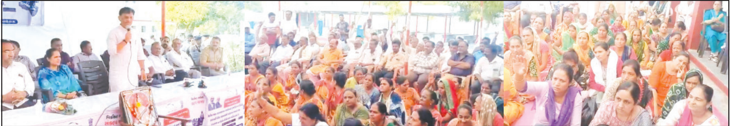
અમરેલી, તા. ૬ સરકાર ધ્વારા તેમની વિવિધ ઇલાજાનાં ગામ સુધી પહોંચે તે માટે દર ભારત અને ગુજરાત જનકલ્યાણ યોજનાઓનો લાભ મહિને કોઈને કોઈ યાત્રા, અભિયાન

બે દિવસ પહેલા યોજાયેલ કાર્યક્રમનો વિડીયો સોશયલ મીડિયામાં વાયરલ થયો