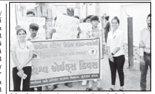
એઈડ્સ દિવસની ઉજવણી કરવામાં આવેલ હતી. તે જોતા હાલ ૧

અમરેલી, તા. ૧ લોકોને એચ.આઈ.વી./એઈડ્સ વિશે સાચી અને સંપૂર્ણ જાણકારી અને માહિતી મળે તેના વિશેની ગેરમાન્યતાઓ દૂર થાય, જેથી એચ.આઈ.વી. ગ્રસ્ત વ્યક્તિઓ પ્રત્યે ધુણા તથા ભેદભાવ દૂર થાય અને તેઓના હક તથા સન્માનની જાળવણી થાય તે હેતુથી ૧લી ડિસેમ્બરના રોજ સમગ્ર વિશ્વમાં 'વિશ્વ એઈડ્સ દિવસ' ની ઉજવણી કરવામાં આવે છે. સન ૧૯૮૮ (ઓગણીસો અઠ્યાસી)ની ૧લી ડિસેમ્બરના રોજ પ્રથમ વિશ્વ