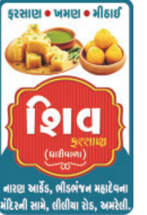
નારણ આઈડ, ભીડભંજન મહાદેવના મંદિરની સામે, લીલીયા રોડ, અમરેલી.

તંત્રી, પ્રકાશક, માલિક : મનોજ એચ. રૂપારેલીયા, કાર્યાલય : જુલ્લા મધ્યસ્થ બેન્ક પાછળ, અમરેલી : મુદ્રણ સ્થાન : આજકાલ પ્રિ.પ્રેસ સ્વપુતપરા, શેલ પેટ્રોલ પંપ પાછળ રાજકોટ ખાતેથી છપાવી અમરેલી એક્સપ્રેસ કાર્યાલયથી પ્રસિધ્ધ કર્યું : વિક્રમ સર્વત ૨૦૦૯ કારતક વદ-૬ વર્ષ : ૧૫ અંક : ૨૯૦