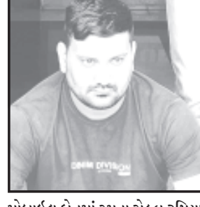
મોબાઈલ ફોનમાં રમતા રોકડા રૂપિયા

અમરેલી, તા. ૧૬ અમરેલી સરકારવાડા રામજી મંદિર પાસે રહેતા ઈન્દિયાજ્ઞિન કચીરીએ આઈ.ડી. પરમાતી ઓરેટ્ટીયા ટી-૧૦ વિરુદ્ધ ઈંગ્લેન્ડ ટી-૨૦ વચ્ચે ચાલતી ક્રિકેટ મેચમાં ગત તા. ૧૫ના રાત્રીના સમયે અમરેલીમાં આવેલ હરિરોડ ઉપર એક દુકાનના ઓટા ઉપર રૂપિયા ૫૦ના ઓનલાઈન બેલેન્સ વાળી આઈ.ડી. વડે હારજીતનો ક્રિકેટ સડો પોતાના