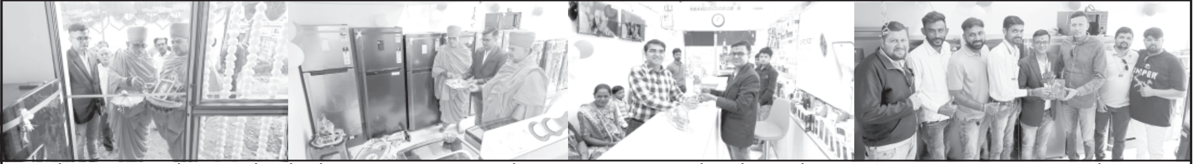
વડિયા ખાતે મોવલીયા પરિવાર દ્વારા અવધ મોબાઈલ એન્ડ ઈલેક્ટ્રોનિક્સ શો-રૂમનો દબદબાભેર પ્રારંભ સ્વામીનારાયણ સંપ્રદાયના સંતોના હસ્તે કરવામાં આવેલ. જ્યાં સુપ્રસિદ્ધ કંપનીઓનાં ઈલેક્ટ્રોનિક્સ ઉપકરણોનું વેચાણ અને સર્વિસ આપવામાં આવશે. આ તકે સાહજિક અને વેપારી આગેવાનો ઉપસ્થિત રહ્યા હતા.