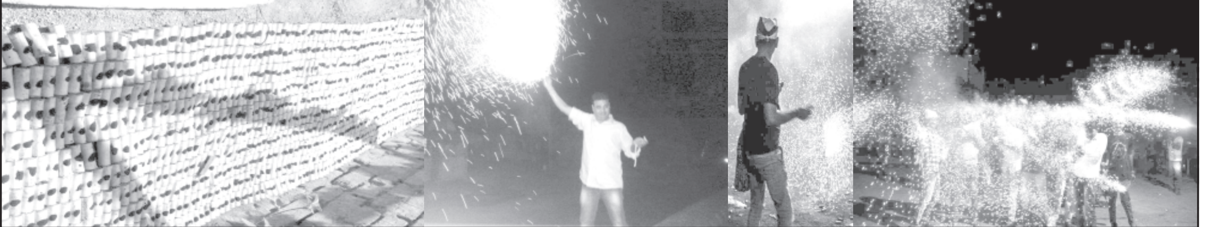
સાવરકુંડલા, તા. ૮ દીપાવલીની રાત્રે સાવરકુંડલા શહેરમાં જન્મતું ઈગોરીયા યુદ્ધ છ દાયકા પહેલાથી રમાતી આ

ઈગોરીયા યુદ્ધને નિહાળવા દૂર-દૂરથી જનતા જનાર્દન ઉપસ્થિત રહેશે