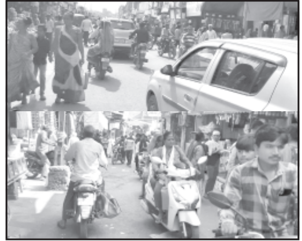
સાવરકુંડલા, તા. ૮ સાવરકુંડલા શહેરમાં હવે

દિવાળી દેખાઈ. આમ તો આજના ૭૬૫થી બદલતાં સમયના વહેણમાં ટેકનોલોજી દિનપ્રતિદિન અપ્રેક્ષ્ય થતી હોય ધરવખરીની ઘણી ચીજો લોકો બદલતાં હોય છે. વેપારીઓ પણ એક્સચેન્જ જુનું આપી જાવ અને નવું લઈ જવાના સૂત્ર સાથે દિવાળીના દિવસો દરમિયાન પોતાની અનેક આઈટમ વેચવા માટે સ્પર્ધા કરી રહ્યા હોય છે. એટલે આમ ગણીએ તો દિવાળીના દિવસો ભારતીય અર્થતંત્રને પણ એક અનોખો બુસ્ટર ડોઝ આપતો હોય છે. હાલ સોના ચાંદીના વેપારી, કટલેરી, ગારમેન્ટ્સ તેમજ દિવાળી સમય દરમિયાન અવનવી સ્કીમો દ્વારા વેચાણ કરતાં વેપારીઓ પણ જોવા મળે છે. આમ હવે દિવાળી ખૂબ ઢકડી આવતાં વેપારી વર્ગ પણ છેલ્લા પાંચ છ દિવસ વેપાર જામશે એવી આશા સેવી રહ્યાં છે. દરેક દુકાન કે મોલ કે શો રૂમમાં અવનવી વેરાઈટીઓનો ખડકલો થતો જોવા મળેલ છે. દિવાળી અનુસંધાને વિશેષ સેલ પણ ભરાતા જોવા મળે છે.