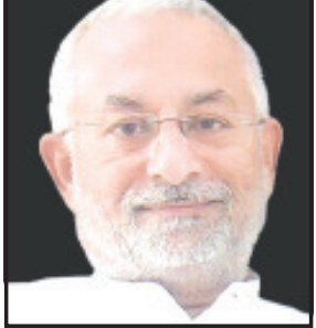
સાવરકુંડલા, તા. ૨૭ સાવરકુંડલામાં થોડા

ભોગ બનનારને સવારે ૧૦ કલાકે નાયબ કલેક્ટર કચેરીનાં મેદાનમાં ઉપસ્થિત રહેવા અનુરોધ