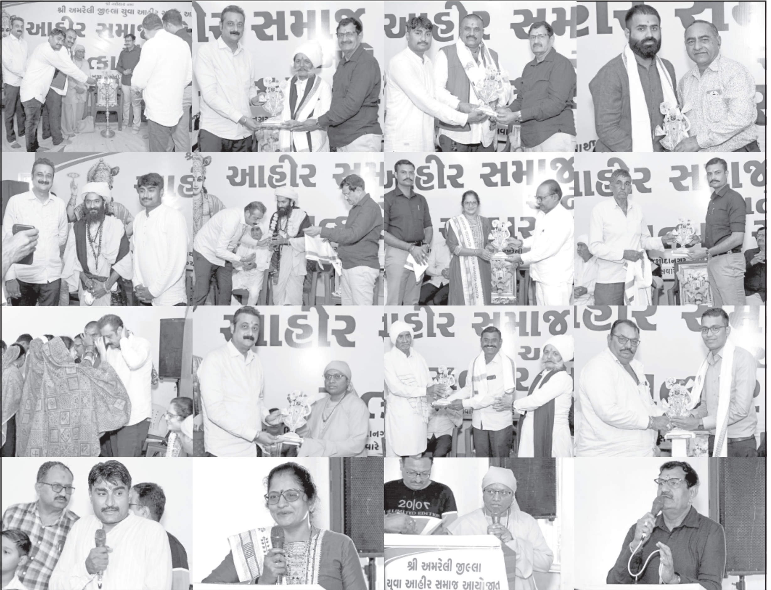
અમરેલી, તા. ૨૭ અમરેલી જિલ્લામાં

રાજકીય, સામાજિક અને શૈક્ષણિક ક્ષેત્રે સિદ્ધિ પ્રાપ્ત કરનાર સમાજ શ્રેષ્ઠિઓનુ કરાયું સન્માન