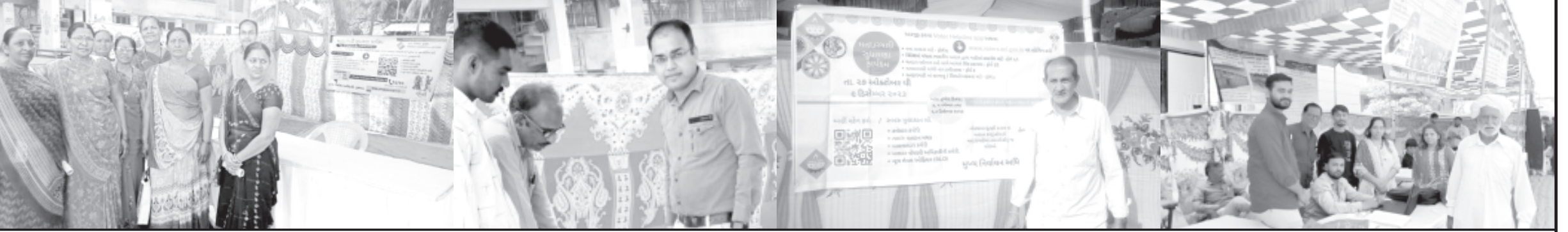
નાગરિકો મતદાર સુધારણા કાર્યક્રમનો લાભ મેળવી શકે તે હેતુને પ્રધાને લઈ વિવિધ સ્થળો અને કાર્યક્રમોમાં મતદાતાઓને માહિતગાર કરવામાં આવી રહ્યા છે. ૨૧ કૃષિ મહોત્સવ કાર્યક્રમના વિવિધ સ્થળો પર સ્ટોલ બનાવવામાં આવ્યા અને મતદાર સુધારણા કાર્યક્રમો પ્રારંભ થયા છે ત્યારે કાર્યક્રમના સ્થળે મતદાતાઓએ મતદાતા સુધારણા કાર્યક્રમની માહિતી મેળવી હતી. મહત્વનું છે કે, અમરેલી જિલ્લાના ૧,૩૭૧ મતદાતા મથકોએ આગામી તા. ૨૬ નવેમ્બર, ૨૦૨૩ને રવિવારના રોજ સવારે ૧૦ થી સાંજે ૫ વાગ્યા દરમિયાન મતદાર સુધારણા કાર્યક્રમ ખાસ અભિયાન યોજાશે. નાગરિકોએ નામ નોંધણી, નામ સુધારા, નામ કમી કરવાવા સહિતની કાર્યક્રમોમાં આગામી તા. ૨૬ નવેમ્બર, ૨૦૨૩ને રવિવારના રોજ સવારે ૧૦ થી સાંજે ૫ વાગ્યા દરમિયાન મતદાર સુધારણા કાર્યક્રમ ખાસ અભિયાન યોજાશે. નાગરિકોએ નામ નોંધણી, નામ સુધારા, નામ કમી કરવાવા સહિતની કાર્યક્રમોમાં આગામી તા. ૨૬ નવેમ્બર, ૨૦૨૩ને રવિવારના રોજ સવારે ૧૦ થી સાંજે ૫ વાગ્યા દરમિયાન મતદાર સુધારણા કાર્યક્રમ ખાસ અભિયાન યોજાશે. નાગરિકોએ નામ નોંધણી, નામ સુધારા, નામ કમી કરવાવા સહિતની