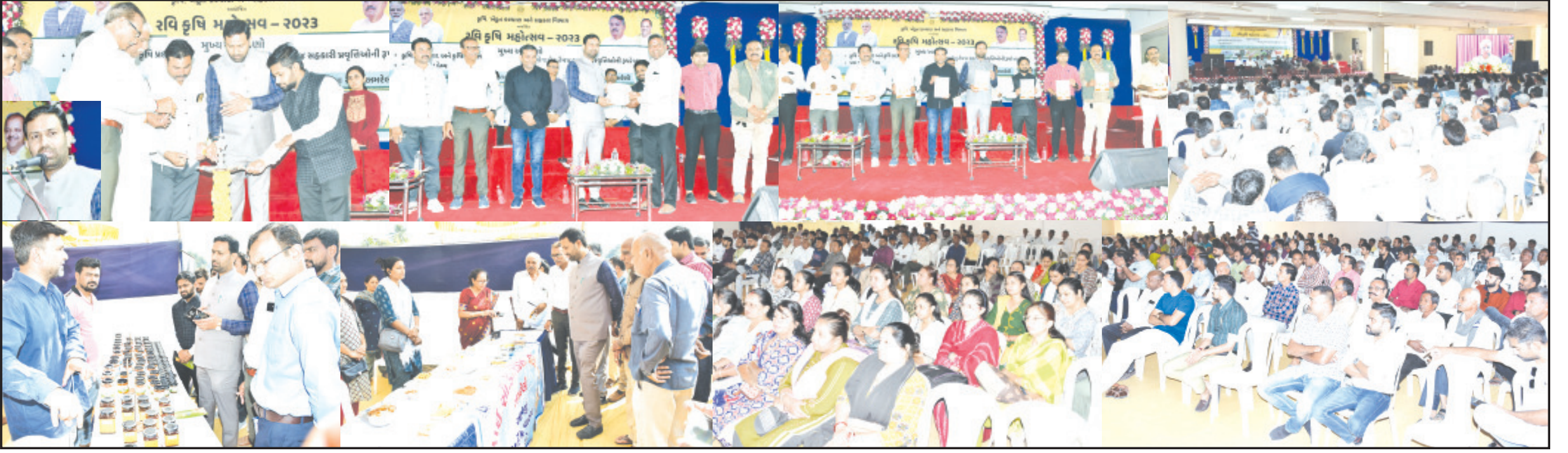
અમરેલી, તા. ૨૪ વડાપ્રધાન અને ગુજરાત રાજ્યના તત્કાલીન મુખ્યમંત્રી નરેન્દ્રભાઈ મોદીએ કૃષિમાં આધુનિક ટેકનોલોજીને પ્રોત્સાહન આપવા, ખેડૂતોને નવીનતમ ટેકનોલોજીના મળી રહે, ખેડૂત હિતલક્ષી યોજનાઓની માહિતી ખેડૂતોને પુરી પાડવા અને ખેડૂતોના સશક્તિકરણના ઉમદા ઉદ્દેશ સાથે કૃષિ મહોત્સવનો પ્રારંભ કરાવ્યો હતો. જેના ઉમદા પરિણામો ખેડૂતોને મળી રહ્યા છે. મુખ્યમંત્રી ભૂપેન્દ્રભાઈ પટેલના વરદ્વહસ્તે અમદાવાદ જિલ્લાના પીરાણા ખાતેથી 'રવી કૃષિ મહોત્સવ ૨૦૨૩' નો રાજ્યવ્યાપી શુભારંભ કરવામાં આવ્યો હતો. અમરેલી સ્થિત ખેડૂત તાલીમ કેન્દ્ર ખાતે વિધાનસભાના નાયબ મુખ્ય દંડક અને અમરેલી-કુંકાવાવ-વડીયા વિસ્તારના ધારાસભ્ય કૌશિકભાઈ વેકરિયાના અધ્યક્ષ સ્થાને તાલુકા કક્ષાનો રવી કૃષિ મહોત્સવ-૨૦૨૩ કાર્યક્રમ યોજાયો હતો. અનુસંધાન પાના ૬ ઉપર

પાકની વાવણીથી લઈને વેચાણ સુધી રાજ્ય સરકાર ખેડૂતોની સંગાથે : વેકરિયા તાલુકાનાં ખેડૂતોને પ્રાકૃતિક કૃષિનાં મોડેલ ફાર્મની મુલાકાતે લઈ જવાશે નાયબ દંડકે ઓર્ગેનિક મધ, કૃષિ એગ્રો, આરોગ્ય સહિત વિવિધ પ્રદર્શન સ્ટોલની મુલાકાત લીધી જિલ્લા કલેક્ટર, જિલ્લા વિકાસ અધિકારી, પ્રાંત અધિકારી વિગેરે ઉપસ્થિત રહ્યા