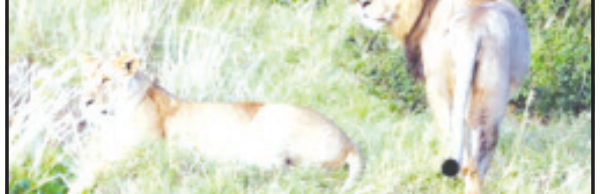
બાબરા, તા. ૨૪ બાબરા તાલુકાનાં ગ્રામ્ય વિસ્તારોમાં વન્ય પ્રાણીઓની અવરજવર વધતા અહીં માલધારીઓ તેમજ ખેડૂતો અને ખેત મજૂરોમાં ભયની લાગણી તેમજ માલદોરની ચિંતા સતાવવા લાગી છે. તાલુકાનાં ટેવળીયા, ફૂલજર ગામ પાસે એક ખાનગી જીનમાં ટીપડાએ ધામા નાખતા વન વિભાગ ધ્વારા લોકોને જાણકારી મળે તે માટે

પશુઓને વાડામાં બાંધવા અને રાત્રિનાં સમયે લાઈટ અને લાકડી સાથે રાખવી