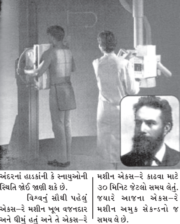
અંદરનાં હાડકાંની કે સ્નાયુઓની સ્થિતિ જોઈ જાણી શકે છે. વિશ્વનું સૌથી પહેલું એક્સ-રે મશીન ખૂબ વજનદાર અને ધીમું હતું અને તે એક્સ-રે મશીન એક્સ-રે કાઢવા માટે ૩૦ મિનિટ જેટલો સમય લેતું. જ્યારે આજના એક્સ-રે મશીન અમુક સેકન્ડનો જ સમય લે છે.

૧૮૯૫ની સાલના એક દિવસે જર્મન પ્રોફેસર વિલહેમ રોન્ટજન પોતાની પ્રયોગશાળામાં કામ કરી રહ્યાં હતા ત્યારે અચાનક જ તેમણે એક વિચિત્ર શોધ કરી. તેમણે જોયું કે જો તેઓ વેક્યુમ ટ્યૂબ (હવા વગરની તદ્દન ખાલી નળી)માં વીજળીનો પ્રવાહ પસાર કરી તેમની વચ્ચે પોતાનો હાથ રાખે તો તેમના હાથનો પડછાયો પડવાના બદલે તેમના હાથની અંદરનાં હાડકાં અને સ્નાયુઓનો પડછાયો પડવાનાં બદલે તેમના હાથની અંદરનાં હાડકાં અને સ્નાયુઓનો પડછાયો પડતો હતો. આ શોધનાં પરિણામે ડોક્ટરો પોતાનાં દર્દીનાં શરીરમાં કોઈ વાહકાપ કર્યા વગર આ કિરણોની મદદથી