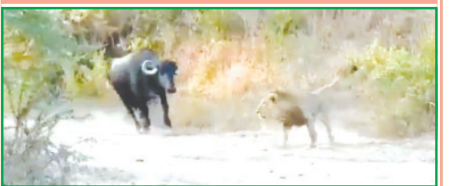
ગીરનાં જંગલ વિસ્તાર નજીક રસ્તાના કેડે આરામ કરમાવતા એક સિંહ અને સિંહણ સામે એક ભગરી ભેસ આવી જતા આ ભેસે સિંહ બેલડી સામે દોટ મૂકી હતી અને આરામ કરમાવી રહેલ સિંહ અને સિંહણને ભગડી મુક્યા હતા. આક્રિયા જંગલોમાં જોવા મળતી ઘટનાઓ ગીરના વિસ્તારોમાં જોવા મળી હતી. આ સિંહ બેલડીને ઉભી પૂંછડીએ ભગાડતી ભેસનો વિડીયો સોશયલ મીડિયામાં વાયરલ થયો હતો. જેમાં અમરેલી જિલ્લાનાં સિંહ પ્રેમીઓ આ સિંહ બેલડીને નાસી છૂટવા મજબૂર કરતો વિડીયો હિટ થયો હતો. આ વાયરલ થયેલ વિડીયો ગીરનાં જંગલ આસપાસનો હોવાનું અનુમાન છે.

સિંહ બેલડીને ઉભી પૂંછડીએ ભગાડતી ભગરી ભેસ