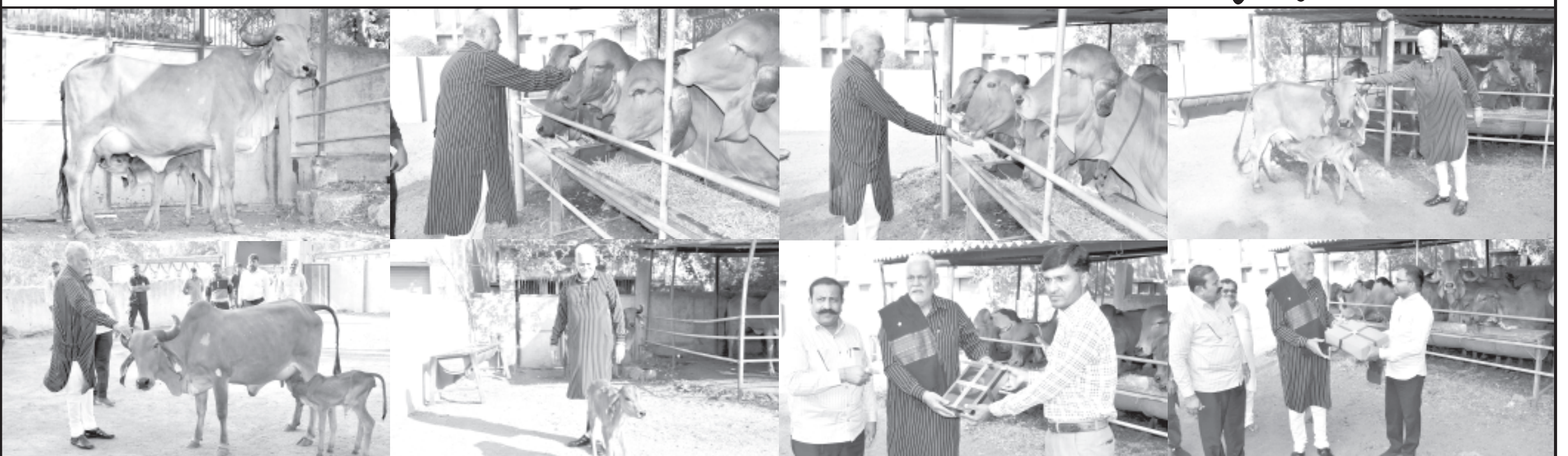
ભારત સરકારના બ્રીડ સુધારણા કાર્યક્રમ હેઠળ આઈ.વી.એફ. ટેકનોલોજીના પ્રયોગ દ્વારા અમરેલીની અમર ડેરીના ગીર ગાયના સંવર્ધન માટે તૈયાર કરવામાં આવેલા સેન્ટર ઓફ એક્સેલન્સ હેઠળ ગીર ગાયના એમ્બ્રીયોથી આઈ.વી.એફ. ટેકનોલોજી દ્વારા જન્મેલી પ્રથમ વાછરડીના કેન્દ્રીય