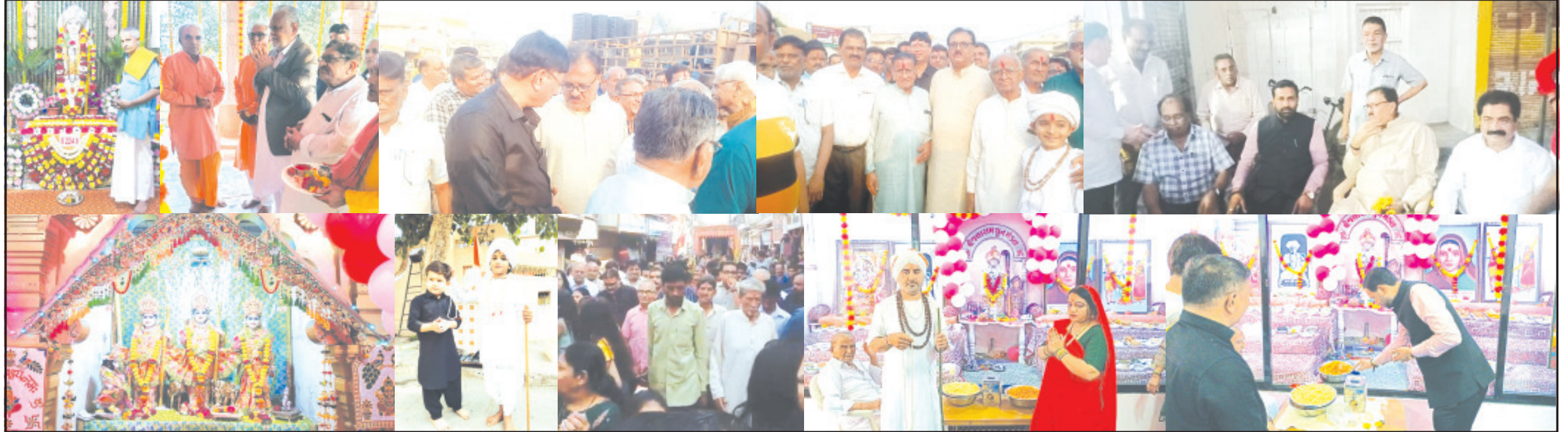
અમરેલી, તા. ૨૦ અમરેલી જિલ્લામાં રવિવારે સંત શિરોમણી પૂ.

જિલ્લાનાં રઘુવંશી સમાજ દ્વારા આયોજિત પ્રાગટ્ય દિવસની ઉજવણીમાં દરેક ક્ષેત્રનાં આગેવાનો જોડાયા