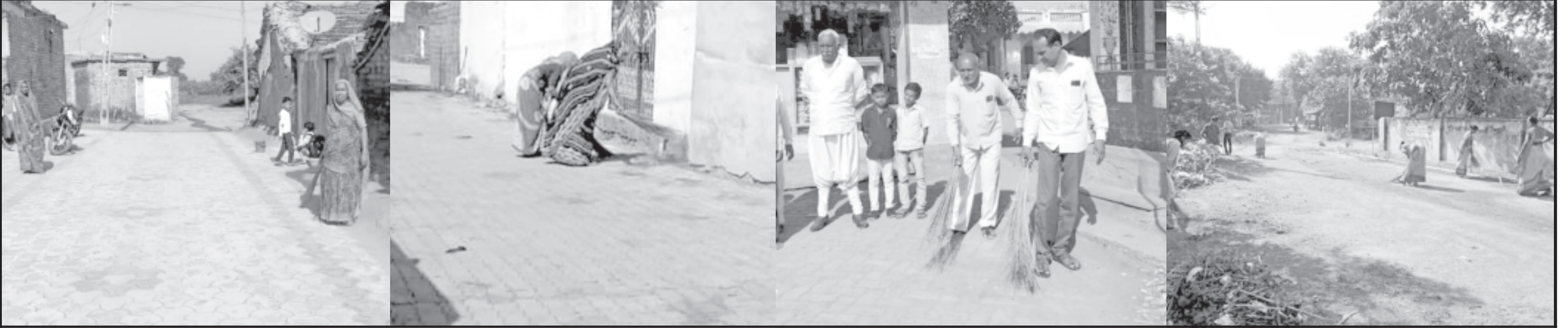
બે માસના મહા સ્વચ્છતા અભિયાન 'સ્વચ્છતા હી સેવા' અંતર્ગત અમરેલી જિલ્લાના બાબરા અને રાજુલા તાલુકાના ગામડાઓમાં