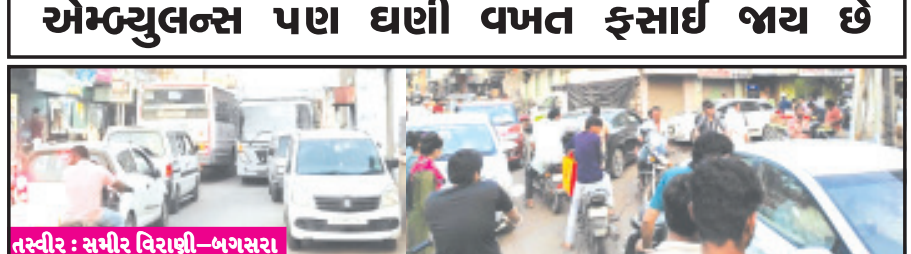
અમરેલી, તા. ૨૦ બગસરામાં ટ્રાફિક સમસ્યા એટલે માથાનો દુખાવો ભરબજારમાં ટ્રાફિક જામની સમસ્યા સમગ્ર વિસ્તારમાં કોઈપણ જગ્યાએ બજારમાં

વન વે હોવા છતાં કોઈ કાળજી લેવાતી નથી બગસરા શહેરમાં ટ્રાફિકની સમસ્યા શહેરીજનો માટે માથાનાં દુઃખારૂપ બની