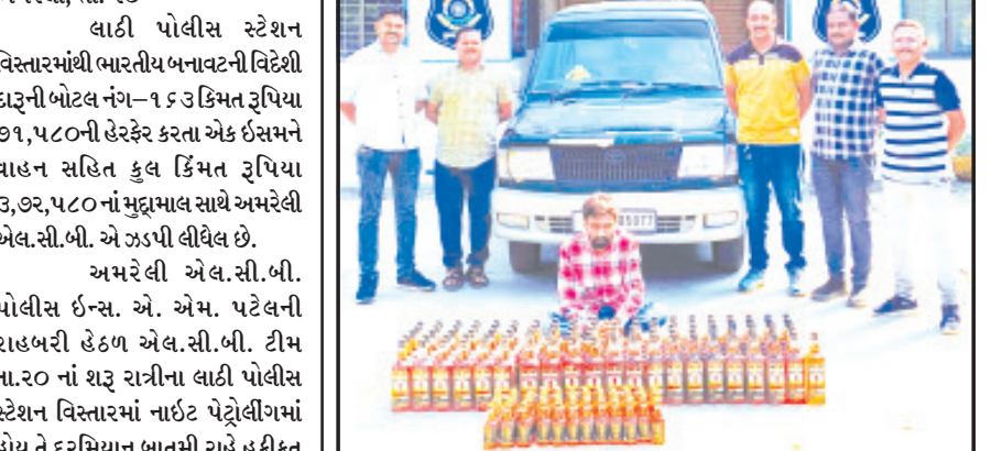
બોટલો ભરી ચાવંડ ગામથી અમરેલી તરફથી જવાની છે જે બાતમી આધારે