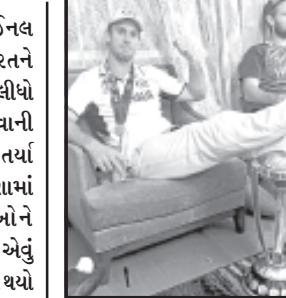
થયું નથી. પરંતુ ક્રિકેટ ચાહકોને બહુ લાગી આવ્યું છે. તેમનું કહેવું છે કે ઓસ્ટ્રેલિયન ક્રિકેટરો જીતના નશામાં ભાન ભુલ્યા છે. નહીંતર જે ટ્રોફીને માથે ચઢાવવાની હોય તેના પર આ રીતે પગ રાખીને બેસવાનું ન હોય. ઓસ્ટ્રેલિયન ક્રિકેટ ટીમ તરફથી પણ હજી સુધી કોઈ સ્પષ્ટતા કરવામાં નથી આવી. વર્લ્ડકપ એક એવી ટ્રોફી છે જેના માટે ૧૦ ટીમો વચ્ચે જોરદાર મુકાબલો થયો હતો અને જે ટીમો વિગ મેચ અથવા સેમી ફાઈનલમાં હારી જતી હતી તેમની આંખોમાં આંસુ આવી જતા

અમદાવાદ, તા. ૨૦ ક્રિકેટ વર્લ્ડકપના ફાઈનલ મુકાબલામાં ઓસ્ટ્રેલિયાએ ભારતને હરાવીને છઠ્ઠી વખત વર્લ્ડકપ જીતી લીધો છે. જોકે, ટ્રોફીને સન્માન આપવાની બાબતમાં ઓસ્ટ્રેલિયનો ઉણા ઉતર્યા હોય તેમ લાગે છે. વિજયના નશામાં ઓસ્ટ્રેલિયન ટીમના ખેલાડીઓને પોતાની વર્તણૂકનો પણ ખ્યાલ નથી એવું લાગે છે. હાલમાં એક ફોટો વાઈરલ થયો છે જેમાં ઓસ્ટ્રેલિયન ખેલાડીઓ વર્લ્ડકપની ટ્રોફી પર બે પગ રાખીને બેઠા છે. આ તસવીરના કારણે સોશિયલ મીડિયા પર હોળાખો મચી ગયો છે અને તમામ ક્રિકેટ ચાહકો ઓસ્ટ્રેલિયાની ટીકા કરે છે. ઓસ્ટ્રેલિયન ટીમના કેપ્ટન પેટ કમિન્સ દ્વારા આ ફોટો શેર કરવામાં આવ્યો છે. વાઈરલ તસવીરમાં જોવા મળે છે કે ઓસ્ટ્રેલિયન બેટ્સમેન મિચેલ માર્શે તેના બંને પગ વર્લ્ડકપની ટ્રોફી પર રાખેલા છે. આ ફોટો ક્યારે અને કેવી સ્થિતિમાં પાડવામાં આવ્યો તથા તેની પાછળની સચ્ચાઈ શું છે તે હજી સ્પષ્ટ