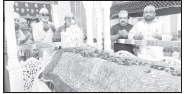
ક્રિકેટમાં મહાજંગ સમાનના વર્લ્ડ કપ ૨૦૨૩માં દેશની શાન સમો તિરંગે મસ્જીદોમાં આન. બાન અને શાનથી લહેરાઈ રહ્યો છે તે મુસ્લિમો પણ મસ્જીદો, દરગાહમાં દુઆએ ખૈર કરીને ભારત પ વારના ચૈમ્પિયન ગણાતા ઓસ્ટ્રેલિયાને ધૂળ ચાટતુ કરીને ફાઈનલ મેચમાં ભવ્ય જીત હાંસિલ કરે તે માટે નમાજ, દુઆઓ શરૂ કરવામાં આવી છે. મોહમદ સમી, શિરાજ, ભુમરાહ, જાહેજ જેવા બોલેરો ઓસ્ટ્રેલિયન બેટ્સમેનોની ઠાંડી ગુલ કરી નાખે તે ભારતના સ્ટાર બેટ્સમેન વિરાટ કોહલી વર્લ્ડકપની ચોથી સેન્યુરી ફટકારે તે શુભમન ગીલ અને રોહિત ધુવાધાર બેટિંગ કરીને ૨૦નો બડકલો કરી આપે તેવી દુઆઓ મુસ્લિમ અગ્રણીઓએ મસ્જીદના મોલવીએ પણ કરેલ હતી. જયારે શ્રેયસ એયર, સુર્યકુમાર, જાહેજ કોઈ કયાશ બાકી ના રાખે તે પ વાર વર્લ્ડ કપ વિજેતા ઓસ્ટ્રેલિયા ને ભો ભીતર કરીને દેશની શાન સમા વર્લ્ડકપની ફાઈનલમાં જીત મેળવે તેવી દુઆઓ મસ્જીદોમાં મુસ્લિમો કરી રહ્યા છે.

સાવરકુંડલા, તા. ૧૮ દેશભરમાં ભારત-ઓસ્ટ્રેલિયાની વર્લ્ડ કપની ફાઈનલ મેચને લઈને ઉત્સાહ બેવડાયો છે. ત્યારે ભારત ત્રીજવાર ક્રિકેટના મહાજંગ સમાન વર્લ્ડકપ ૨૦૨૩ માં અજય સાહનિ થયેલ ટીમ ઈન્ડિયા ફાઈનલમાં જુસ્સો બરકરાર રાખીને વર્લ્ડ કપ જીતે તે માટે મુસ્લિમો દ્વારા મસ્જીદ દરગાહમાં દુઆએ ખૈર કરી હતી.