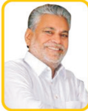
શ્રી પરશોતમભાઈ રૂપાલા કેબીનેટ મંત્રીશ્રી, ભારત સરકાર સંસ્થાના પ્રેરણાસ્ત્રોત, સ્થાપક ડાયરેક્ટરશ્રી