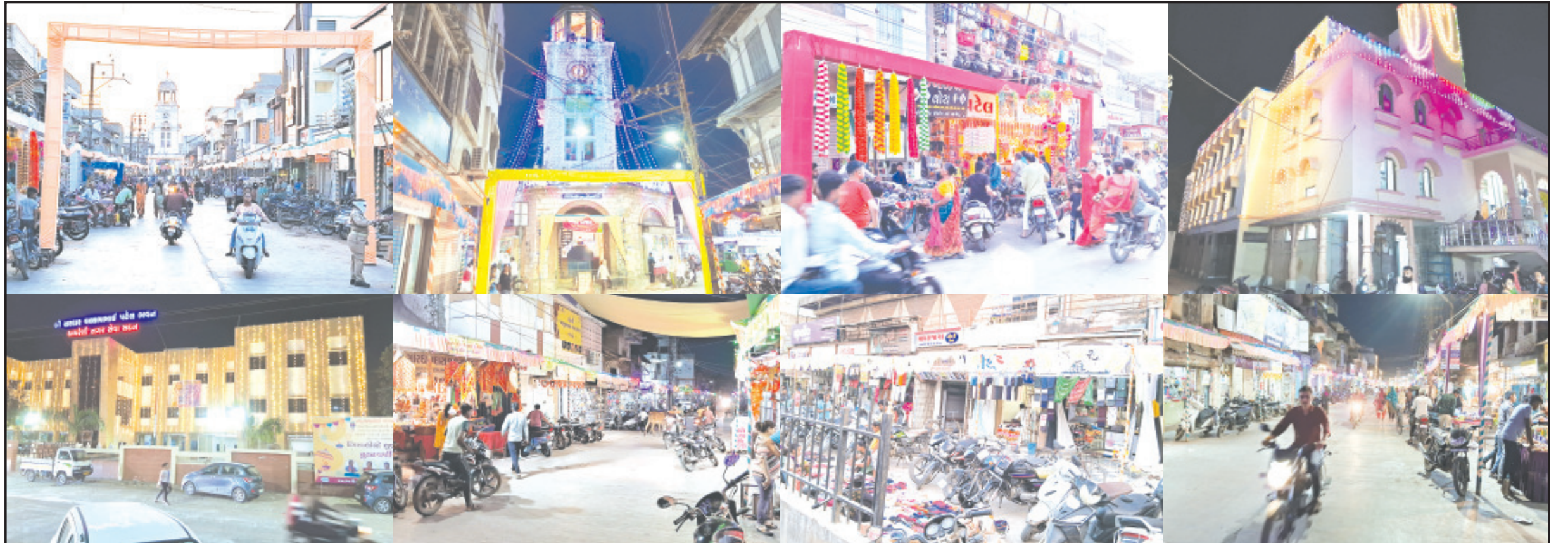
અમરેલી, તા. ૧૧ અમરેલી જિલ્લામાં “દિપોત્સવી” પર્વની ઉત્સાહભરે ઉજવણીનો પ્રારંભ થયો છે. જિલ્લાનાં આબાલ-વુધ્ધ, ગરીબ-અમીર સહિત સૌ કોઈ દિપોત્સવીનાં રંગે રંગાયેલા જોવા મળી રહ્યા છે. જિલ્લાનાં મુખ્ય મથક સૌથી વધુ રોશનીનો ઝગમગાટ ઉભો કરવામાં આવ્યો છે. શહેરની મુખ્ય બજારોમાં નવોટા જેવો શણગાર ઉભો કરવામાં આવેલ છે. ટાવર ચોક અને મોટા બસ સ્ટેન્ડ ચોક વેપારી એસોસીએશન તેમજ લાઠી માર્ગનાં વિવિધ મોલ, શો-રૂમ, પાલિકા કચેરીને પણ શણગાર સર્જવામાં આવ્યો છે. બીજી તરફ શહેરમાં ફટાકડા, ફૂટવેર, મિઠાઈ, ગારમેન્ટ સહિતનાં વેપારીઓને ત્યાં ગ્રાહકો ઉમટી પડ્યા છે તો ઈલેક્ટ્રોનીક્સ અને ઓટો શોરૂમ અને જવેલર્સને પણ સારી એવી કમાણી થઈ રહી છે. જિલ્લાનાં સાવરકુંડલા, રાજુલા, બાબરા, બગસરા, ધારી, ચલાલા, કુંકાવાવ સહિતનાં શહેરો તેમજ જિલ્લાની સરહદે આવેલ ઉના, દિવ, ગીર ગઢણ સહિતનાં શહેરોમાં પણ અનુરો ઉત્સાહ જોવા મળી રહ્યો છે તો જિલ્લાનાં તમામ ધાર્મિક સ્થાનોને પણ રોશનીથી સુશોભિત કરવામાં આવેલ છે. અમરેલી જિલ્લાની જનતા નિર્ભય અને મુક્તપણે દિપોત્સવી પર્વની ઉજવણી કરી શકે તે માટે પોલીસ વિભાગ ધ્વારા ચાંપતો બંદોબસ્ત ગોઠવવામાં આવ્યો છે. તો આતશબાજીનાં કારણે આગે જેવી ઘટના બને તો તેને પહોંચી વળવા ફાયર બ્રિગેડનાં જવાનો ખડેપગે જોવા મળી રહ્યા છે. સોમવારે ઘોડો હોય મંગળવારે નૂતનવર્ષને આવકારવા માટે ઠેકઠેકાણે સ્નેહમિલન તેમજ ધાર્મિક સ્થાનોમાં “અન્નકૂટ” પ્રસાદ ધરવામાં આવશે. હિન્દુ ધર્મનાં સૌથી મોટા અને મહત્વનાં તહેવારની ઉજવણીને લઈને સમગ્ર જિલ્લામાં અનેરો ઉત્સાહ જોવા મળી રહ્યો છે.

હિન્દુ ધર્મનાં સૌથી મોટા તહેવાર ગણાતા દિપોત્સવી પર્વની ઉજવણી પણ ભવ્ય રીતે થઈ રહી છે