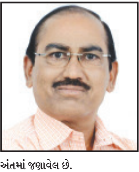
અંતમાં જણાવેલ છે.