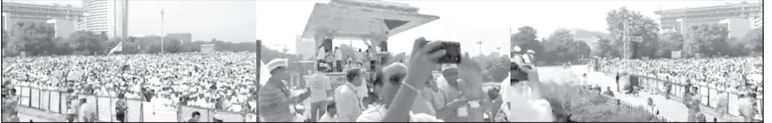
નવી દિલ્હી, તા. ૨ દેશનાં પાટનગર નવી દિલ્હી ખાતે મહાત્મા ગાંધીની જયંતિનાં આગળનાં દિવસે "રામલીલા" મેદાન દેશભરમાંથી આવેલ લાખો કર્મચારીઓથી ખીચોખીચ ભરાયેલ હતું. જેમાં અમરેલી જિલ્લાનાં પણ અનેક કર્મચારીઓ જોડાયા હતા. અમરેલીથી લઈને સમગ્ર ગુજરાત અને અલગ-અલગ રાજ્યોનાં લાખો કર્મચારીઓ ઘણા સમયથી નવી પેન્શન પદ્ધતિ બંધ કરીને જુની પેન્શન પદ્ધતિ લાગુ કરવા જે-તે રાજ્યનાં મુખ્યમંત્રીથી લઈને પ્રધાનમંત્રી સુધી રજુઆત કરી રહ્યા છે. પરંતુ કોઈ જગ્યાએથી ન્યાય ન મળતાં તેઓએ પોતાનો અવાજ પ્રધાનમંત્રી સુધી પહોંચે તે માટે પાટનગર ખાતે વિશાળ રેલી યોજી હતી. જેમાં લાખોની સંખ્યામાં કર્મચારીઓ જોડાયા હતા. જો કે ૧૦-૧૨ વર્ષ પહેલા અન્ના હજારેનાં આંદોલનની યાદ તાજુ કરાવે તેવા દ્રશ્ય અંગે દેશનાં મહત્વનાં મીડિયા જગતે અકળ કારણોસર દૂર રહેવાનું પસંદ કરેલ. જો કે સોશયલ મીડિયામાં માધ્યમથી દેશનાં કરોડો મોબાઈલમાં કર્મચારીઓની વિશાળ રેલી દેશવાસીઓએ નિહાળી હતી.

સોશયલ મીડિયાનાં માધ્યમથી દેશનાં કરોડો મોબાઈલમાં કર્મચારીઓની ભીડ જોવા મળી