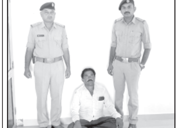
અન્યથે ગુન્હો નોંધી કાયદેસરની રો. ૭૦ હજાર ઈંડ વસુલ કરવામાં આવ્યો.