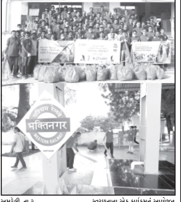
અમરેલી, તા. ૨ સ્વચ્છતા ત્યાં પ્રભુતા - આ સુત્ર આપણે અવાર-નવાર વાંચ્યું છે. અથવા તો તેનો ઉપયોગ કર્યો છે. પરંતુ આપણે જ આપણી આજુબાજુની સ્વચ્છતા બાબતે ઉદાસિનતા દાખવીએ છીએ તે પણ હકીકત છે. કહેવાય છે કે ઈશ્વરને સ્વચ્છતા ખુબ જ પસંદ છે એટલે તો વહેલી સવારે વૃક્ષો, વેલા અને પુષ્પોને તે ઝાકળ વડે નવરાવે છે! જ્યાં સમજ ત્યાં સ્વચ્છતા, જ્યાં સ્વચ્છતા ત્યાં આરોગ્ય અને જ્યાં આરોગ્ય ત્યાં સંપત્તિ. સ્વચ્છ શરીર હોય તો વિચારો પણ સ્વચ્છ આવે છે. અને જ્યાં સ્વચ્છ વિચારો હોય ત્યાં ચારે તરફ સ્વચ્છતા હોવાની આ એક બીજા ઉપર આધારિત છે અને તેથી જ આપણા વડાપ્રધાન નરેન્દ્રભાઈ મોદીએ સ્વચ્છ ભારત-સ્વચ્છ ભારતનું સુત્ર આપી સમગ્ર દેશમાં સ્વચ્છતા અભિયાન શરૂ કરાવેલું છે. સૌરાષ્ટ્ર - કચ્છ વિસ્તારનાં દુધ ઉત્પાદકોની સંસ્થા માહી ડેરી દ્વારા ગાંધી જયંતિ નિમિત્તે તા. ૨ ઓક્ટોબર, સોમવારનાં રોજ રાજકોટનાં ભકિતનગર રેલ્વે સ્ટેશન ખાતે સ્વચ્છતાના એક કાર્યક્રમનું આયોજન કરવામાં આવ્યું હતું. જેમાં ડેરીનાં અધિકારીઓ, કર્મચારીઓ તેમજ રેલ્વે કર્મચારીઓએ સફાઈ કાર્યક્રમમાં જોડાઈને રેલ્વે સ્ટેશનમાં સફાઈ કાર્ય કરી સમગ્ર સ્ટેશનને કચરામુક્ત કર્યું હતું. આ રાષ્ટ્રીય અભિયાનના કાર્યક્રમમાં માહી ડેરીનાં ચીફ એક્ઝિક્યુટિવ ડો. સંજય ગોવાણીની આગેવાની હેઠળ સંસ્થાનાં તમામ કર્મચારીઓ, અધિકારીઓ વગેરેએ ઉપસ્થિત રહી સ્વચ્છતા કાર્ય હાથ ધરી લોકોને કચરો કચરા પેટીમાં જ નાંખવા અનુરોધ કર્યો હતો. આ અંગે માહી ડેરીનાં ચીફ એક્ઝિક્યુટિવ ડો. સંજય ગોવાણી જણાવ્યું હતું કે, મહાત્મા ગાંધીજીએ આપેલા સ્વચ્છતાના સંદેશને આપણે આપણા દૈનિક જીવનનાં ભાગ સાથે વણી લોવા જોઈએ. કચરો જ્યાં ત્યાં નાંખીને આપણે જ આપણા સ્વાસ્થ્ય માટે ખતરો ઉભો કરી રહ્યા છીએ. ત્યારે આપણે આપણી રાષ્ટ્રીય ફરજ સમજીને કચરાનો નિકાલ યોગ્ય જગ્યાએ કરીએ તે આજનાં સમયની માંગ છે.