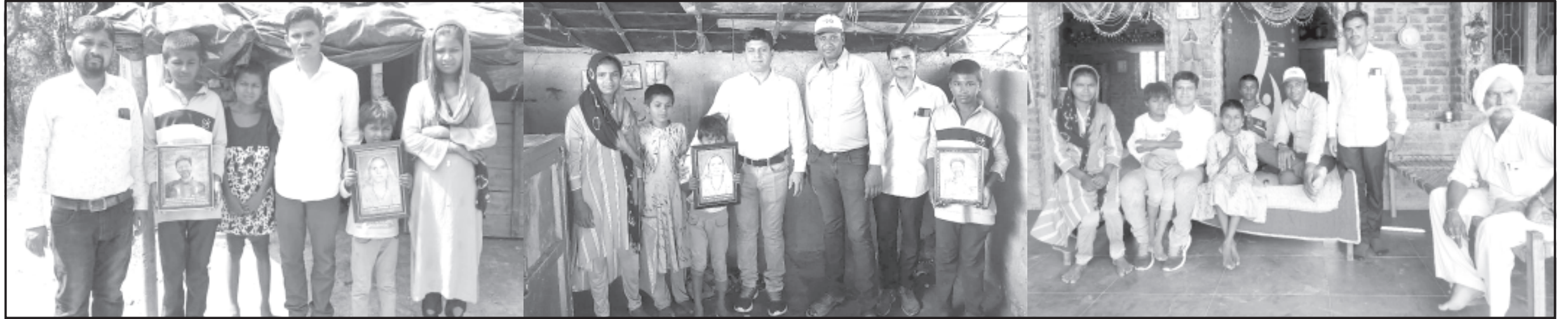
અમરેલી, તા. ૧૮ લાઠી તાલુકાનાં ખોડીયાર નગર સહ સ્ટેશન પાછળના સીમાડાના

સરકાર તરફથી મળતી જે કોઈ સહાય હશે તે ઝડપથી મળે તેવા પ્રયાસની ખાત્રી આપવામાં આવી