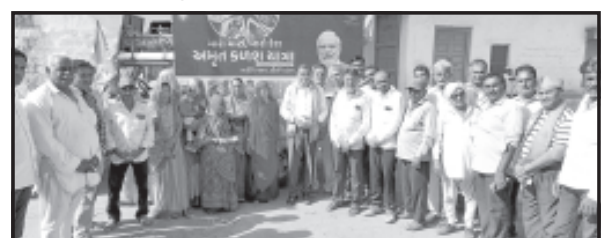
અમરેલી, તા. ૧૨ પ્રધાનમંત્રી નરેન્દ્રભાઈ મોદી દ્વારા તા. ૩૦ જુલાઈ ૨૦૨૩ ના રોજ "મન ક્રી બાત" કાર્યક્રમ દરમ્યાન દેશ માટે બલિદાન આપેલ આપણા વિર શહીદ પુરૂષો અને મહિલાઓના સન્માન માટે મેરી માટી, મેરા દેશ અભિયાનની જાહેરાત કરવામાં આવેલ હતી.

જેમાં અમૃત કળશ યાત્રા અંતર્ગત સમગ્ર દેશના ખુણે ખુણેથી ૭૫૦૦ કળશોમાં માટી લાવી દેશની રાજધાની દિલ્લી લાવી રાષ્ટ્રીય યુધ્ધ સ્મારક પાસે અમૃત વાટીકા