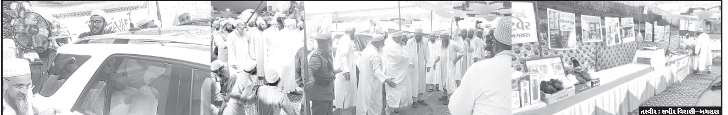
બગસરામાં હોરા સમાજના ધર્મગુરૂ આવેલા છે તેમની હાજરીમાં વિવિધ પ્રકારના કાર્યક્રમોનું આયોજન કરવામાં

આવેલ છે જે પૈકી આજે હોરા સમાજના વેપારીઓ દ્વારા બિઝનેસ એકિઝમિશનનું આયોજન કરવામાં આવ્યું હતું. વિગત અનુસાર હોરા