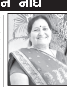
સદગતનું બેસણું તા. ૧૬/૧૦/૨૩, સોમવારનાં સાંજે ૪ થી ૬ સોની શાંતિની વાડી-અમરેલી ખાતે રાખવામાં આવેલ છે.

આવી રીતે પેસાદાર લોકો માત્ર પોતાના પેસાની તાકાતથી પોતાની જાતને ગુન્હામાંથી ન્યાયની પ્રક્રિયામાંથી પસાર થયા વગર છોડાવી લે અને પોતાની જાતને છોડાવવા માટે થઈ નિર્દોષ લોકોનો ભોગ લઈ પોતાના કોલરને બચાવી લઈ સમાજમાં અને ગામમાં વાઈટ કોલરવાળા લોકો થઈ ફરે છે. આ બાબતે સાચી હકીકત તપાસ કરી અને જે હોય તે સામે આવે તે જરૂરી છે તેમ અંતમાં જણાવેલ છે.