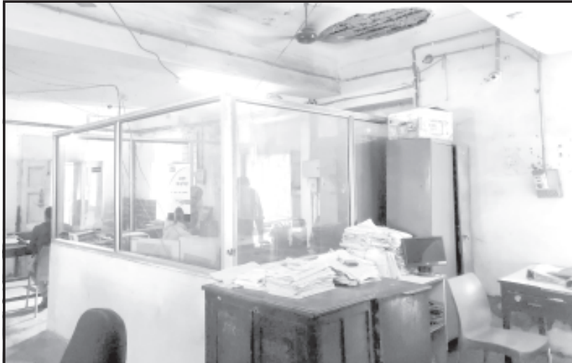
સાવરકુંડલા, તા. ૧૨ સાવરકુંડલા શહેરની જન સંખ્યા ધીમે ધીમે વધી રહી છે. સાવરકુંડલાની પોસ્ટ ઓફિસની હાલત

જનપ્રતિનિધિઓ જનતાની સમસ્યાનું નિરાકરણ કરે તેવી માંગી ઉભી થઈ