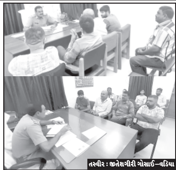
તસ્વીર : જાહેરજનતા ગોસાઈ-વડિયા

સમગ્ર રાજ્યમાં વર્તમાન સરકારનાં ગૃહ વિભાગ દ્વારા લોકોમાં કાયદાનું પાલન થાય અને ગુનાઓ અને કાયદા પાલન બાબતે જાગૃતતા આવે તે માટે રાજ્યનાં ગૃહ વિભાગ દ્વારા રેન્જ આઈજ અને જિલ્લા પોલીસ વડાનાં માર્ગદર્શનથી સ્થાનિક પોલીસ દ્વારા કાર્યક્રમ યોજાઈ રહ્યાં છે. જેમાં વડિયા પીએસઆઈ ડાંગરના અધ્યક્ષ સ્થાને એક મિટિંગ વડિયા પોલીસ સ્ટેશનમાં યોજવામાં આવી હતી જેમાં પીએસઆઈ ડાંગર દ્વારા સાઈબર કાર્ટમ, સ્થાનિક મજૂરોની નોંધણી, ટ્રાફિક નિયમોનું પાલન અને સ્થાનિક સમસ્યાઓ બાબતે માર્ગદર્શન ત્રણ વાત તમારી ત્રણ વાત અમારી કાર્યક્રમ રૂપે સ્થાનિક લોકોનાં પ્રશ્નો પોલીસ સમક્ષ રજૂ કરવા જણાવાયું હતું. બીજી બાજુ વડીઓમાં કામ કરતા મજૂરોની નોંધણી અને ટ્રાફિકનાં નિયમોનું પાલન