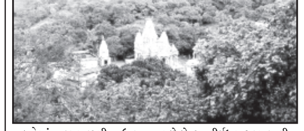
ભકતોમાં જન્માષ્ટમી ઉત્સવ ઉજવવાનો હરખ ચરમસીમાએ છે અને શ્યામ પરિવાર દ્વારા તૈયારીઓ હાથ ધરાઈ છે. અહિં સાતમ આઠમનાં પર્વોમાં સરેરાશ એક થી સવા લાખ દર્શનાર્થીઓની આવન જાવન રહેતી હોય છે. ગાંડી ગીરમાં આહલાદક વાતાવરણ વચ્ચે પ્રકૃતિ અને પરમેશ્વરનો અહિં સંયોગ માણવા મળે છે. આ તીર્થધામ ગરમ પાણીના પવિત્ર કુંડ માટે પણ જાણીતું છે. યાત્રા, પ્રવાસ માટે અહીં લોકોનો અવિરત પ્રવાહ શ્રાવણ માસની શરૂઆતથી જ વહી રહ્યો છે. સાતમ આઠમના દિવસોમાં અહીં માનવમેળો જામશે! તુલસીશ્યામ મંદીર ટ્રસ્ટ દ્વારા યાત્રીઓની સેવા-સુવિધા માટે તૈયારીઓ ચાલી રહી છે.

તુલસીશ્યામ, તા. ૫ ભગવાન સુંદર શ્યામના સ્વયંભૂ તિર્થધામ તુલસીશ્યામ મંદિરે જન્માષ્ટમી ઉત્સવની ભાવભરે ઉજવણી થશે. ગોકુલ આઠમ તા. ૭ સપ્ટેમ્બરને ગુરુવારે રાત્રે ભારનાં ટકોરે ભારે હર્ષોલ્લાસ સાથે ભગવાન શ્યામનાં જન્મોત્સવનાં વધામણાં થશે. આ તકે હજારો ભાવિકો ઉપસ્થિત રહેશે અને પ્રભુ શ્યામના રંગે રંગાશે. તુલસીશ્યામ તીર્થમાં સાતમ આઠમનાં પર્વોની શ્રુંખલાના પ્રારંભ સાથે જ ભાવિકોનો અવિરત પ્રવાહ વહી રહ્યો છે. ગીર સોમનાથ જિલ્લામાં ગીરના જંગલમાં આવેલ આ તીર્થધામ ભગવાન સુંદર શ્યામનું સ્વયંભૂ સ્થાન છે. આથી આ તીર્થસ્થાનનું ધાર્મિક દ્રષ્ટિએ ગોકુલ મથુરા જેટલું જ ભાવિકોને મન મહત્વ રહેલું છે. શ્યામ