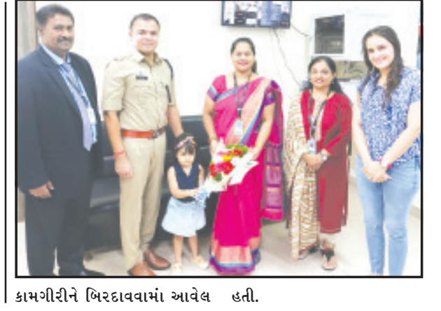
કામગીરીને બિરદાવવામાં આવેલ હતી.