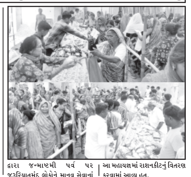
દ્વારા જન્માષ્ટમી પર્વ પર જરૂરિયાતમંદ લોકોને માનવ સેવાનાં આ મહાવજ્રમાં રાશનકીટનું વિતરણ કરવામાં આવ્યું હતું.