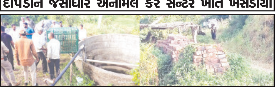
અમરેલી, તા. ૫ સાવરકુંડલા રેન્જના મીતીયાળા ગામે આવેલ એક ખેડૂતના ૭૫ ફૂટ ઊંડા કુવામાં દીપડા પાબકતા વન વિભાગ દ્વારા આ દીપડાનું રેસ્કયુ અનુસંધાન પાના ૬ ઉપર

સાવરકુંડલા રેન્જમાં આવેલ મીતીયાળા ગામે કુવામાં પડી ગયેલા દીપડાને રેસ્કયુ કરી બચાવી લેવું વન તંત્ર દીપડાને જસાદાર એનીમલ કેર સેન્ટર ખાતે ખસેડાયો