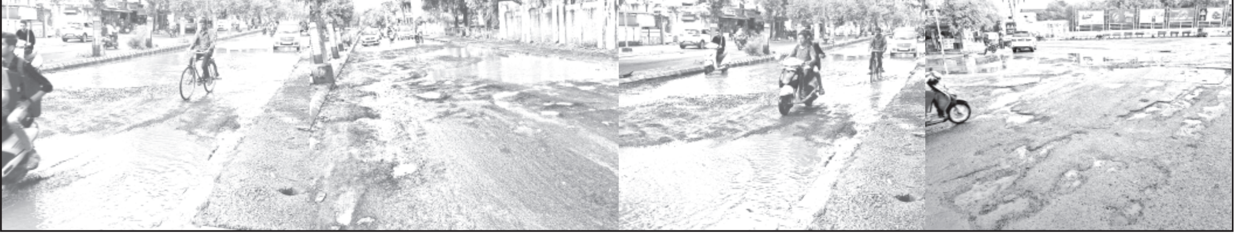
અમરેલી, તા. ૨૯ અમરેલી જિલ્લામાં સોથી વધુ ભ્રષ્ટાચાર સરકારનાં કયાં વિભાગમાં કરવામાં આવે છે જો તેનું

ભ્રષ્ટ બાબુઓ મોઘવારી વધતાં એજન્સી પાસેથી વધારે ટકાવારી પડાવીને તગડી કમાણી કરતાં હોવાની ફરિયાદ