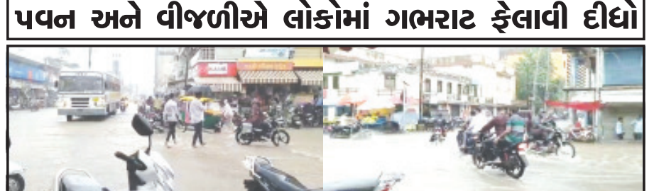
અમરેલી, તા. ૨૯ એક ઈંચ જેટલો વરસાદ નોંધાયો બાદ આજે સતત બીજા દિવસે વીજળીનાં કડાકા-ભડાકા અને જોરદાર પવન અનુસંધાન પાના ૬ ઉપર