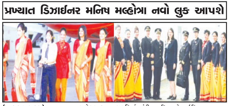
પ્રખ્યાત ડિઝાઈનર મનિષ મલ્હોત્રા નવો લુક આપશે

પાસે પરત આવતા જ પરિવર્તનમાંથી સહિત એર ઈન્ડિયાના તમામ કર્મચારીઓ હવે નવા યુનિફોર્મમાં જોવા અનુસંધાન પાના ૬ ઉપર