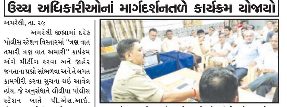
અમરેલી, તા. ૨૯ અમરેલી જિલ્લામાં દરેક પોલીસ સ્ટેશન વિસ્તારમાં "ત્રણ વાત તમારી ત્રણ વાત અમારી" કાર્યક્રમ અંગે મીટિંગ કરવા અને જાહેર જનતાના પ્રશ્નો સાંભળવા અને તે લગત કામગીરી કરવા સુચના થઈ આવેલ હોય. જે અનુસંધાને લીલીયા પોલીસ સ્ટેશન ખાતે પી.એસ.આઈ. એસ.આર. ગોલીનાઓના અધ્યક્ષ સ્થાને જાહેર જનતા આગેવાનો તથા અન્ય રાજકીય હોદ્દદારો અને ગામ લોકો સાથે એક સુંદર મીટિંગનું આયોજન કરવામાં આવેલ. જેમાં ડાહજર રહેલ જનતાને સદરહું બાબતે તેઓના કોઈ પ્રશ્નો હોય તો જણાવવા ભલામણ કરવામાં આવેલ અને કોઈ પણ તકલીફ હોય કે અન્ય કોઈ હેરાનગતી કે અન્ય કોઈ પ્રશ્નો ઉપસ્થિત થયે તુર્ત જ પોલીસ સ્ટેશન ખાતે જાણ કરવા જાહેર જનતાને તથા ડાહજર આગેવાનોને અનુરોધ કરવામાં આવેલ હતો. અને આ કોન્સેપ્ટ અંતર્ગત જનતા અનુસંધાન પાના ૬ ઉપર