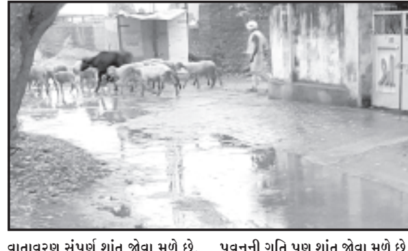
વાતાવરણ સંપૂર્ણ શાંત જોવા મળે છે, પવનની ગતિ પણ શાંત જોવા મળે છે.

સાવરકુંડલા, તા. ૨૩ સાવરકુંડલા શહેરમાં આજરોજ બપોરના ત્રણ વાગ્યા આસપાસ ઘટાટોપ વાદળો વચ્ચે ઝરમરિયો વરસાદ વરસવાનો પ્રારંભ થયો. શહેરના રસ્તાઓ પણ ભીના થયાં. જો કે આ લખાય છે ત્યાં સુધી એટલે કે પાંચ વાગ્યા સુધી તો વાતાવરણ ઘટાટોપ વાદળોથી છવાયેલું જોવા મળે છે પરંતુ મેઘો મન મૂકીને વરસતો નથી. વાતાવરણમાં હજુ પણ ઉકળાટ અનુભવાતો જોવા મળે છે.