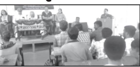
અમરેલી, તા. ૨૩

અમરેલી : કોમર્સ કોલેજમાં ગ્રાહક જાગૃતિ કાર્યક્રમ યોજાયો