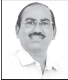
આવતીકાલ રવિવારે સાંજનાં ૬ કલાકે રાધિકા રેસ્ટોરન્ટ ખાતે યોજવામાં આવેલ છે.