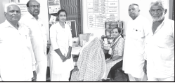
સાવરકુંડલા, તા. ૨૩,

સરંભડા પ્રાથમિક આરોગ્ય કેન્દ્ર ખાતે સર્વરોગ નિદાન કેમ્પ યોજાયો