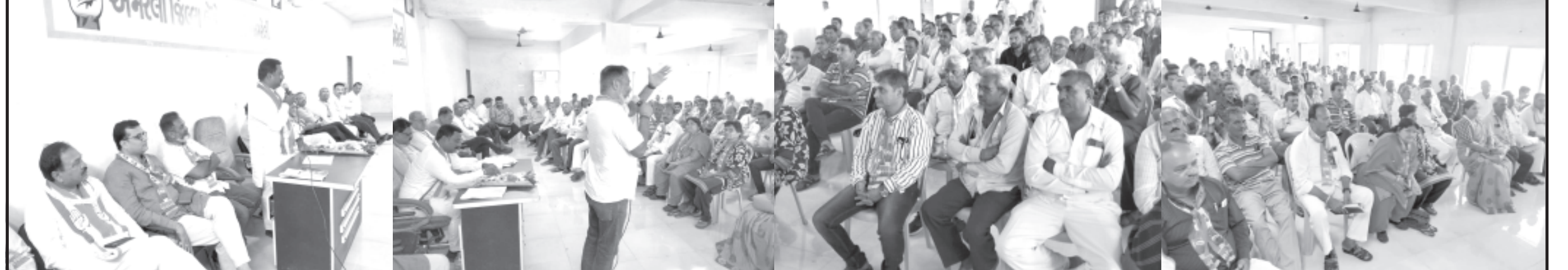
અમરેલી જિલ્લા કોંગ્રેસ કાર્યાલય ખાતે આજે જિલ્લા કોંગ્રેસની મહત્વની બેઠક