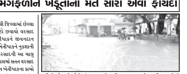
અમરેલી જિલ્લામાં છેલ્લા પાંચ દિવસથી છૂટો છવાયો વરસાદ પડતાં કયાંક ખેતીપાકને જીવનદાન મળ્યું છે તો કયાંક ખેતીપાકને નુકશાની વર્તાઈ રહી છે. વરસાદની આ ચાલુ સીઝનમાં જુલાઈ માસમાં સતત વરસાદ પડતા જગતનો તાત ખેતીપાકના કામો આટોપી હળવાશમાં હતા. પરંતુ ઓગસ્ટ મહિને આખો કોરો થાકડ જતા ખેતીપાકને લઈ ખેડૂતો મુંઝાયા હતા, ખેતીપાકને જીવિત રાખવા પાણીની જરૂરિયાત વર્તા ખેડૂતોએ સારા વરસાદના કારણે કૂવા, તળાવોમાં સંગ્રહિત પાણીથી ખેતીપાકને પાણ પાચ મોલને જીવિત રાખ્યા હતા અંતે ધીમે ધીમે કૂવા, તળાવો, ચેકડમોમાં પણ પાણીની ઘટ થવા લાગી જે ખરીક પાકને

લઈ ખેડૂતો માટે મોટી મૂંઝવણ ગણી શકાય, છેલ્લા પાંચેક દિવસથી અમરેલી જિલ્લામાં છૂટો છવાયો વરસાદ પડતાં ખેડૂતોમાં થોડા ઘણા અંશે રાહત મળી હતી. સાવરકુંડલાના પંથકના આંબરડી સહિત આસપાસના વિસ્તારોમાં દોઢ માસ જેટલા લાંબા સમય બાદ આજે મેઘરાજાએ મુશળ ધાર વરસાદી મહેરબાની થતા ખેડૂતોમાં