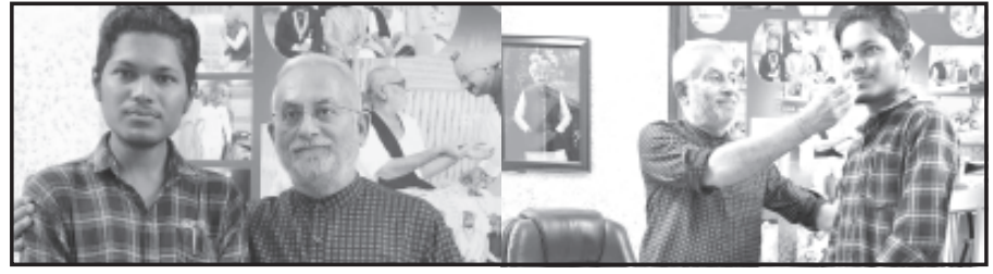
સાવરકુંડલા, તા. ૨૩

યે રિશ્તા ક્યાં કહેલાતા હૈ, ગુરૂ શિષ્ય કા અતૂટ બંધન સાવરકુંડલા સનરાઈઝ સ્કૂલનો વિદ્યાર્થી સરકારી નોકરી મળતા વિદ્યાગુરૂને મળવા પહોંચી ગયો