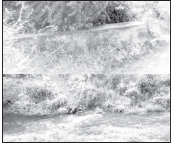
અમરેલી, તા. ૨૩

ચાંદગઢમાં ખોડીયાર સિંચાઈની કેનાલ રીપેર કરવા માંગ