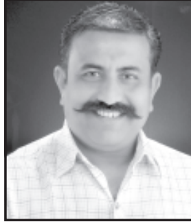
આ બેઠકમાં નાયબ ઇન્ડક કૌશિક વેકરિયા અને સાંસદ કાછડીયા અધ્યક્ષ સ્થાને રહેશે અને અમર કેરીનાં