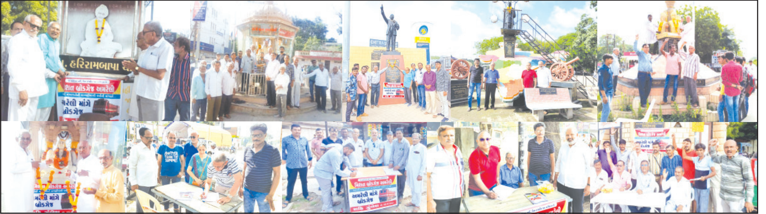
અમરેલી, તા. ૨૩

માત્ર ૩ કલાક ચાલેલી સહી મૂંઝેશમાં સાડા ત્રણ હજાર કરતાં વધારે શહેરીજનો જોડાયા