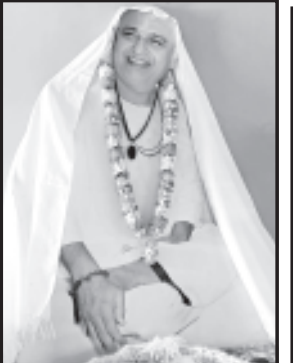
સાવરકુંડલા, તા. ૧૪ | સાવરકુંડલાનાં શ્રી લાલધામ આશ્રમ ખાતે પ્રતિવર્ષની જેમ ભગવાન શ્રી રામદેવજી મહારાજનાં નવરાત્રી નિમિત્તે જુવારા, નેજા ઉત્સવ-પૂજન અર્ચન તથા નવ નવ દિવસ સુધી હોમાત્મક યજ્ઞનું તેમજ મહા આરતી-સંતવાણીનું આયોજન કરવામાં આવેલ છે.

સાવરકુંડલા, તા. ૧૪ | સાવરકુંડલાનાં શ્રી લાલધામ આશ્રમ ખાતે પ્રતિવર્ષની જેમ ભગવાન શ્રી રામદેવજી મહારાજનાં નવરાત્રી નિમિત્તે જુવારા, નેજા ઉત્સવ-પૂજન અર્ચન તથા નવ નવ દિવસ સુધી હોમાત્મક યજ્ઞનું તેમજ મહા આરતી-સંતવાણીનું આયોજન કરવામાં આવેલ છે. આ ધાર્મિક આયોજનમાં શહેર અને બહારગામનાં અનેક ભાવિકો, સેવકો લાભ લેશે.