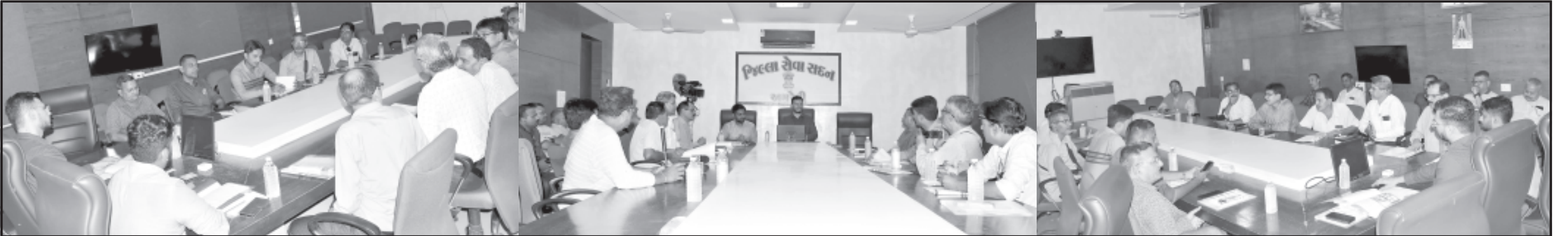
અમરેલી, તા. ૧૪ | અંતર્ગત જિલ્લા કલેક્ટરના અધ્યક્ષસ્થાને અને જિલ્લા વિકાસ અધિકારીની ઉપસ્થિતિમાં અમરેલી ખાતે પ્રેસ કોન્ફરન્સ યોજાઈ હતી.

કલેક્ટરનાં અધ્યક્ષસ્થાને ડીડીઓની ઉપસ્થિતિમાં પત્રકાર પરિષદ યોજાશે