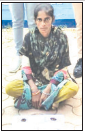
રહે. લાઠી રોડ, ગુરુદત્ત પેટ્રોલ પંપ પાસે, કુટપાથ ઉપર, છેલ્લા ત્રણ