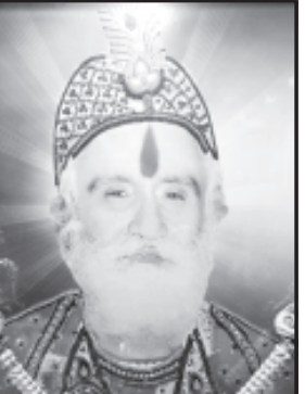
સાવરકુંડલા, તા. ૧૪ | સાવરકુંડલાનાં શ્રી લાલધામ આશ્રમ ખાતે પ્રતિવર્ષની જેમ ભગવાન શ્રી રામદેવજી મહારાજનાં નવરાત્રી નિમિત્તે જુવારા, નેજા ઉત્સવ-પૂજન અર્ચન તથા નવ નવ દિવસ સુધી હોમાત્મક યજ્ઞનું તેમજ મહા આરતી-સંતવાણીનું આયોજન કરવામાં આવેલ છે.