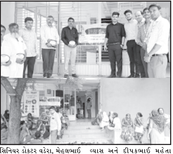
સાવરકુંડલા સાધના સોસાયટીમાં આવેલ શાળા નં. ૯ માં અમી ચેરીટેબલ ટ્રસ્ટ અને સેલ્બી હોસ્પિટલ અમદાવાદનાં સહયોગથી કરોડરજ્જુ અને વૃટ્ટણનો ફ્રી રોગ નિદાન કેમ્પ યોજાયો હતો.

સાવરકુંડલા, તા. ૧૪ | સાવરકુંડલા ખાતે અમી ચેરીટેબલ ટ્રસ્ટ અને સેલ્બી હોસ્પિટલ અમદાવાદનાં સહયોગથી કરોડરજ્જુ અને વૃટ્ટણનો ફ્રી નિદાન કેમ્પ યોજાયો. જેમાં ૨૧૦ લાભાર્થીએ લાભ લીધો હતો.