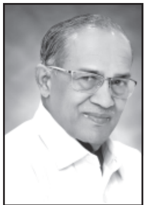
વિના તેમની આ અવિરત યાત્રાને લાંછનનો લાગે તે માટેનાં તેમનાં પ્રયાસો આજે યાદગાર બની ગયા