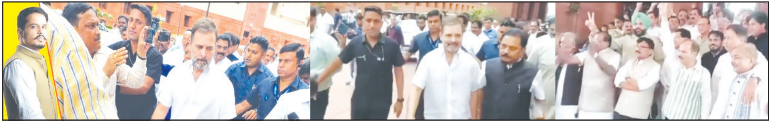
નવી દિલ્હી, તા. ૭ | કોંગ્રેસ નેતા રાહુલ ગાંધીને સુપ્રીમ કોર્ટ દ્વારા રાહત અપાયા બાદ | હવે તેમના સાંસદ સભ્ય પદને લઈ મોટા સમાચાર મળી રહ્યા છે. હવે લોકસભા સ્પીકરે તેમના સાંસદ પદ માટે મંજૂરી આપી દીધી છે. તેમનું સાંસદ પદ બહાલ થઈ ગયું છે. તેઓ હવે ફરી સંસદમાં જોવા મળશે. વિપક્ષી ગઠબંધન માટે આ મોટા સમાચાર માનવામાં આવી રહ્યા છે. ઉલ્લેખનીય છે કે સુરતની કોર્ટે મોદી માનહાનિ કેસમાં ૨ વર્ષની સજા ફટકારી હતી તેના બાદથી તેમનું સાંસદ પદ છીનવી લેવાયું હતું. જોકે આ મામલે ગુજરાત હાઈકોર્ટે પણ તેમને આંચકો આપ્યો હતો અને સજા યથાવત રાખી હતી. જોકે છેવટે સુપ્રીમકોર્ટે આ મામલે સવાલો ઊઠાવતાં તેમને રાહત આપી હતી. જેના પછી રાહુલ ગાંધીની સજા પર રોક લગાવાઈ હતી. લોકસભા સચિવાલય તરફથી આ મામલે નોટિફિકેશન જાહેર કરી દેવામાં આવતા કોંગ્રેસના કાર્યકરો અને અનુસંધાન પાના ૬ ઉપર

વિપક્ષી ગઠબંધન ઈન્ડિયાનાં તમામ સાથીદારોએ કોંગી નેતાને આવકાર્યા | લોકસભામાં આજથી અવિશ્વાસ દરખાસ્ત પર ચર્ચા શરૂ થવાની હોય તેવા સમયે કોંગી નેતાની એન્ટ્રી થઈ | અનેક ઉચલપાથલ બાદ અંતે સુપ્રીમ કોર્ટનાં આદેશથી રાહુલ ગાંધી પુનઃ સાંસદ બની ગયા | મથિપુર બાબતે રાહુલ ગાંધીનાં સવાલો અને પ્રધાનમંત્રી નરેન્દ્ર મોદીના જવાબો કેવા હશે તેના પર દેશવાસીઓની નજર