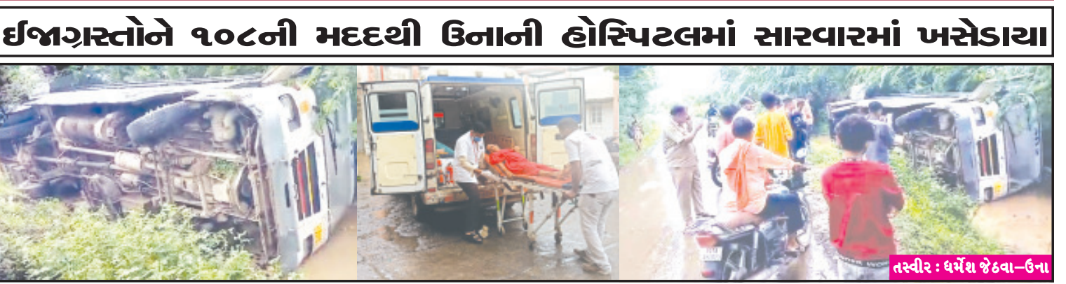
ઉના, તા. ૫ સલામત સવારી એસ.ટી. અમારી સુર ધરાવતી અને ઉંચા ભાડા વસુલતી એસ.ટી. બસ જાફરાબાદ તાલુકાના ટીબી ગામ નજીક પલ્ટી પાઈ જતાં ૪ જેટલા મુસાફરોને ઈજા નાની-મોટી ઈજા થવા પામતા મુસાફરોની ચિચિયારીથી રોડ ગુંજ ઉઠ્યો હતો. જયારે ઈજાગ્રસ્ત ૪ મુસાફરોને ૧૦૮ ઈક્યો હતો. આ બનાવમાં સુત્રોમાંથી જાણવા મળતી વિગત મુજબ સાવરકુંડલા-ઉના રૂટની એસ.ટી. બસ નંબર જી.જે. ૧૮ જેડ ૪૧૮૩ આજે સવારે જાફરાબાદ તાલુકાના ટીબી ગામ નજીક ટીબીથી એક કિ.મી. આગળ આવેલ માણસા રોડ ઉપરથી પસાર થતી હતી ત્યારે કોઈ કારણોસર આ બસ રોડ સાઈડના વરસાદી પાણી ભરેલા ખાળીયામાં પલ્ટી મારી જતાં આ એસ.ટી. બસમાં મુસાફરી કરી રહેલા ૪ જેટલા મુસાફરોને ઈજા નાની-મોટી ઈજા થવા પામતા મુસાફરોની ચિચિયારીથી રોડ ગુંજ ઉઠ્યો હતો. જયારે ઈજાગ્રસ્ત ૪ મુસાફરોને ૧૦૮ વડે ઉના દવાખાને સારવાર માટે ખસેડાયા હતાં. આ બનાવની જાણ એસ.ટી.ના અધિકારીઓને થતાં તેઓ ઘટના સ્થળે પહોંચી ગયા હતાં.