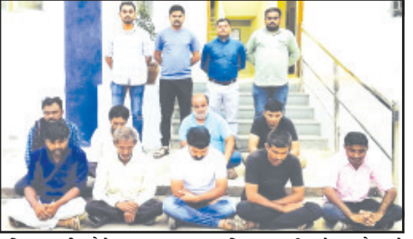
સહિત નવ ઈસમોને જુગાર રમતા રોકડા રૂ.૨૯,૮૦૦ તથા મોબાઈલ ફોન નંગ-૮ કિ.રૂ.૩૫,૫૦૦ મળી કુલ કિ.રૂ. ૬૫,૩૦૦ નાં મુદ્દામાલ સાથે પકડી પાડી, તથા બે ઈસમો રેઈડ દરમિયાન નાશી ગયેલા હોય, જે તમામ ઈસમો સામે જુગારધારા મુજબ ધોરણસર કાર્યવાહી કરી, પકડાયેલ આરોપીઓ તથા મુદ્દામાલ લીલીયા પોલીસ સ્ટેશનમાં સોંપી આપેલ છે.