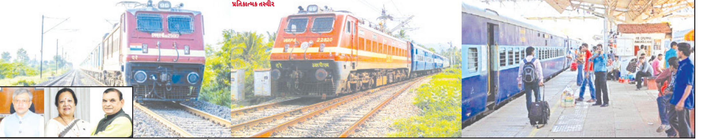
અમરેલી, તા. ૩૦ અમરેલી જિલ્લાને આઝાદીનાં ૭૬ વર્ષ બાદ સૌ પ્રથમ વખત લાંબા અંતરની વેરાવળ-ચિતલ-બનારસ રૂટની રેલ્વે સેવા મળે તો જિલ્લાની જનતામાં ખુશીનો માહોલ જોવા મળી રહ્યો છે અને અમરેલીનાં સાંસદ નારણભાઈ કાછડીયાની સતત રજૂઆત સફળ રહી છે. અમરેલીનાં સાંસદ નારણભાઈ કાછડીયાનાં પ્રયાસોથી ભારત સરકારનાં રેલ્વે મંત્રાલય તરફથી વેરાવળથી બનારસ સુપરફાસ્ટ ટ્રેનને આગામી તા. ૧૧મી સપ્ટેમ્બરથી સંચાલિત કરવાની મંજૂરી પ્રદાન થયેલ છે. આ તકે સાંસદે જણાવેલ છે કે, ઢસાથી જેતલસર સુધી મીટરગેજ લાઈનનું શ્રોડગેજમાં પરિવર્તન થયા બાદ આ ટ્રેક ઉપર લોકલ પેસેન્જર ટ્રેન કાર્યરત થયેલ પરંતુ લાંબા અંતરની એકપણ ટ્રેનનું સંચાલન થતું ન હતું. તેથી ઢસા-જેતલસર શ્રોડગેજ અનુસંધાન પાના ૬ ઉપર

વડિયા-કુંકાવાવ, ચિતલ, ખીજડીયા અને લાઠી થઈને બનારસ પહોંચશે દર સોમવારે સવારે ૪:૧૫ કલાકે વેરાવળથી ઉપડી મંગળવારે બપોરે ૨:૩૫ બનારસ પહોંચશે દર બુધવારે સવારે ૭:૩૦ કલાકે બનારસથી ઉપડી ગુરુવારે સાંજે ૬:૪૫ કલાકે વેરાવળ પહોંચશે અમરેલીનાં સાંસદ કાછડીયાનાં પ્રયત્નોથી જિલ્લાની જનતાને સૌ પ્રથમ લાંબા રૂટની રેલ્વે સેવા મળી