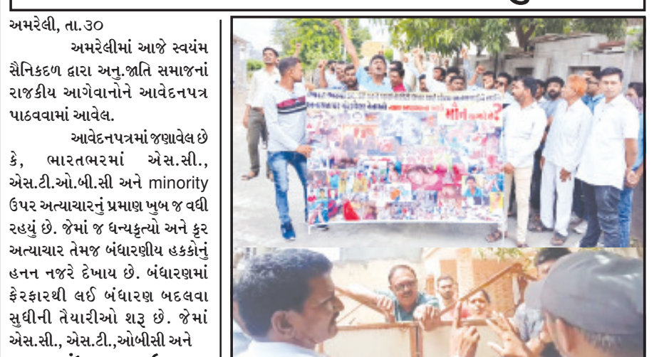
અમરેલી, તા. ૩૦ અમરેલીમાં આજે સ્વયંમ સૈનિકદળ દ્વારા અનુ. જાતિ સમાજનાં રાજકીય આગેવાનોને આવેદનપત્ર પાઠવવામાં આવેલ. આવેદનપત્રમાં જણાવેલ છે કે, ભારતભરમાં એસ. સી., એસ. ટી. એ. બી. સી અને minority ઉપર અત્યાચારનું પ્રમાણ ખુબ જ વધી રહ્યું છે. જેમાં જ ધન્યકૃત્યો અને કૃત અત્યાચાર તેમજ બંધારણીય હકકોનું હનન નજરે દેખાય છે. બંધારણમાં ફેરફારથી લઈ બંધારણ બદલવા સુધીની તૈયારીઓ શરૂ છે. જેમાં એસ. સી., એસ. ટી., ઓબીસી અને અનુસંધાન પાના ૬ ઉપર

સ્વયંમ સૈનિક દળો, રાજકીય આગેવાનોને આવેદનપત્ર પાઠવ્યું અમરેલી જિલ્લાનાં અનુ. જાતિનાં રાજકીય આગેવાનોનાં અકળ મૌનનો વિરોધ શરૂ ડો. બાબા સાહેબનાં માર્ગ પર ચાલવા અનુરોધ કર્યો