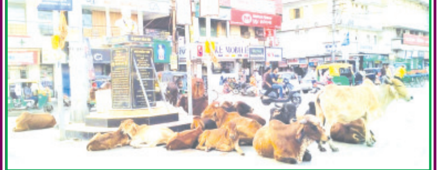
અમરેલી સહિત સમગ્ર જિલ્લામાં રખડતી-ભટકતી ગૌમાતાને કોઈ પણ શાસકો સલામત સ્થળે બસેડતા ન હોય ત્યારે અમરેલીનાં ડો. જીવરાજ મહેતા ચોકમાં આવેલ ડો. જીવરાજ મહેતાની પ્રતિમાની સામે બેસીને ગૌ-માતા પોતાની સમસ્યા વર્ણવતી હોય તેવું દ્રશ્ય સ્વયંભુ ઉભું થવું હોય કેમેરામાં કેદ થયેલ છે.