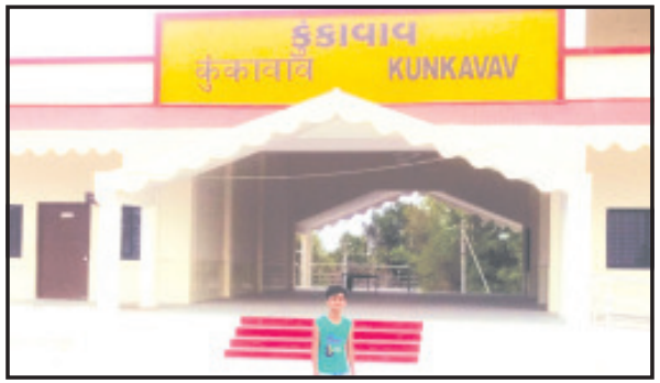
કુંકાવાવ, તા. ૩૦ કુંકાવાવને રેલ્વેની બ્રોડગેજ લાઈન મળી, નવુ રેલ્વે સ્ટેશન મળ્યું પણ ટ્રેન માત્ર એક જ ચાલે છે. જેતલસરથી ઢસા બીજી કોઈ ટ્રેન નથી જ્યારે રેલ્વે તંત્ર દ્વારા નવી ટ્રેન વેરાવળથી બનારસ ટ્રેન ચાલુ કરવામાં આવી છે અને અનુસંધાન પાના ૬ ઉપર

વડિયા અને ચિતલને સ્ટોપ અપાયો વેરાવળ-બનારસ રૂટની નવી ટ્રેનમાં કુંકાવાવને સ્ટોપ ન અપાતા નારાજગી આગેવાનોએ સાસંદ અને ધારાસભ્યને રજુઆત કરી