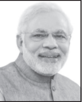
અમરેલી, તા. ૨૯ બંગાળનાં મુખ્યમંત્રી મમતા

કટોકટીકાળ બાદ ચોખચેલ લોકસભાની ચૂંટણી જેવો માહોલ દેશભરમાં પ્રસરી રહ્યો છે