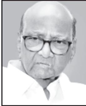
વર્ષનાં શાસનકાળમાંથી મુક્ત કરી દીધો હતો. તેવો જ માહોલ વર્તમાન સમયમાં જોવા મળી રહ્યો છે. નરેન્દ્ર મોદીનો વિકલ્પ કોણ, પ્રધાનમંત્રી માટે વિપક્ષનો કોણ ચહેરો, ભાજપનાં અખૂટ આત્મ વિશ્વાસ વચ્ચે વિપક્ષનાં જયપ્રકાશ