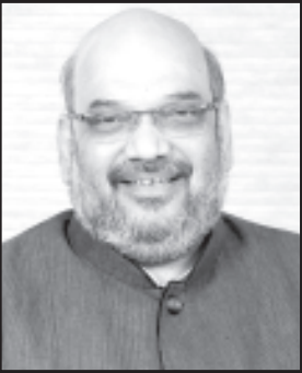
બેનરજીએ ગઈકાલે દેશમાં લોકસભાની ચૂંટણી આગામી ડિસેમ્બરમાં

યોજાવાની શક્યતા દર્શાવતાં દેશભરનાં મીડિયા જગત અને રાજકીય પક્ષોમાં નવી ચર્ચાઓ શરૂ થઈ છે. આગામી નવેમ્બર-ડિસેમ્બરમાં મધ્યપ્રદેશ, રાજસ્થાન, છત્તીસગઢ, તેલંગાણા અને મિઝોરમ વિધાનસભાની ચૂંટણી હોય પ્રધાનમંત્રી નરેન્દ્ર મોદી અને ગૃહમંત્રી અમિત શાહ વિપક્ષી ગઠબંધન "ઈન્ડિયા"નાં પક્ષો વચ્ચે તાલમેલ સર્જાઈ તે પહેલાં જ વ્હેલી ચૂંટણીનો દાવ અજમાવે તેવું સૌ કોઈ ચર્ચા કરી રહ્યાં છે. બીજી તરફ મુંબઈ ખાતે