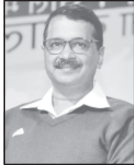
નારાયણ કોણ હશે તેની અટકળો તેજ બની ચુકી છે અને આગામી લોકસભાની ચૂંટણી ડિસેમ્બરમાં કે નિર્ધારિત સમયે યોજાઈ પરંતુ ચૂંટણી જય રસપ્રદ બનશે તેમાં શંકાનો કોઈ સ્થાન નથી.