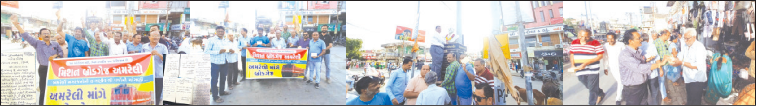
અમરેલી, તા. ૨૯ અમરેલી એ જિલ્લાનું મુખ્ય શહેર હોવા છતાં રાજકીય આગેવાનોની નિષ્કીયતાનાં પાપે આઝાદીનાં અમૃત મહોત્સવની ઉજવણીનાં દિવસોમાં પણ બોડગેજ રેલ્વેથી વચિત હોય મિશન બોડગેજ-અમરેલી અંતર્ગત પ્રધાનમંત્રી સુધી રજૂઆત પહોંચાડવા માટે છેલ્લા ૨ મહિનાથી અભિયાન ચાલી રહ્યું છે. આજે અમરેલીનાં પનોતા પુત્ર, રાજયનાં પ્રથમ મુખ્યમંત્રી સ્વ. ડો. જીવરાજ મહેતાની જન્મ જયંતિએ ડો. જીવરાજ મહેતાની પ્રતિમાને પુષ્પાંજલિ અર્પણ કરીને મિશન બોડગેજ ચલાવતાં જાગૃત નાગરિકોએ પ્રધાનમંત્રીને પોસ્ટકાર્ડ લખીને બોડગેજ રેલ્વેની સુવિધા આપવાની માંગ શરૂ કરી છે. મિશન બોડગેજ અભિયાન ચલાવતાં વિપુલ ભટ્ટી, યોગેશ કોટેયા વિગેરે જાગૃત નાગરિકોએ દરેક શહેરીજનોને પોસ્ટકાર્ડ ઝૂંબેશમાં જોડાવવા અનુરોધ કરેલ છે.

બિનરાજકીય સંગઠન દ્વારા જિલ્લાનાં મુખ્ય શહેરને બોડગેજ રેલ્વેની સુવિધા અપાવવા બે મહિનાથી કાર્ય શરૂ આઝાદીનાં અમૃત મહોત્સવનાં સમયમાં પણ સૌરાષ્ટ્રનાં એકમાત્ર જિલ્લા મથકને અન્યાય રાજકીય આગેવાનોની નિષ્કીયતાના પાપે નાગરિકોને સ્વયંભુ સુવિધા માટે સક્રીય થવું પડી રહ્યું છે દરેક નાગરિકને પોસ્ટકાર્ડ અભિયાનમાં જોડાવવા માટે ‘મિશન બોડગેજ’ સમિતિનો અનુરોધ