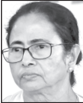
માહોલ જામી રહ્યો છે. તે વખતે પણ "ઈન્ડિયા ઈઝ ઈન્ડિયા" અને ઈન્ડિયા ગાંધીનો વિકલ્પ કોણ તેવું કોંગ્રેસ કહી રહી હતી હતી અને તે જ સમયે જયનારાયણનાં નેતૃત્વમાં વિપક્ષોએ એકતા દર્શાવીને કોંગ્રેસ પક્ષને ઠગ