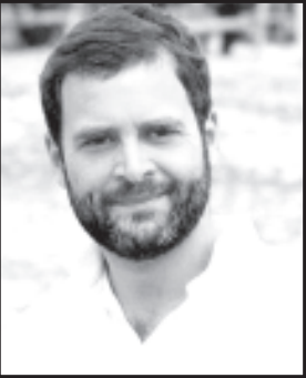
આગામી ૨ દિવસ બાદ વિપક્ષી મહાગઠબંધનની મહત્વની બેઠક યોજાઈ રહી છે. જેમાં દેશનાં કદાવર વિપક્ષી નેતાઓ ઉપસ્થિત રહેવાનાં છે અને ઈન્ડિયા ગઠબંધનનાં ચેરમેન અને કન્વીનરની જાહેરાત, તેમનો લોગો,

યોજાવાની શક્યતા દર્શાવતાં દેશભરનાં મીડિયા જગત અને રાજકીય પક્ષોમાં નવી ચર્ચાઓ શરૂ થઈ છે. આગામી નવેમ્બર-ડિસેમ્બરમાં મધ્યપ્રદેશ, રાજસ્થાન, છત્તીસગઢ, તેલંગાણા અને મિઝોરમ વિધાનસભાની ચૂંટણી હોય પ્રધાનમંત્રી નરેન્દ્ર મોદી અને ગૃહમંત્રી અમિત શાહ વિપક્ષી ગઠબંધન "ઈન્ડિયા"નાં પક્ષો વચ્ચે તાલમેલ સર્જાઈ તે પહેલાં જ વ્હેલી ચૂંટણીનો દાવ અજમાવે તેવું સૌ કોઈ ચર્ચા કરી રહ્યાં છે. બીજી તરફ મુંબઈ ખાતે