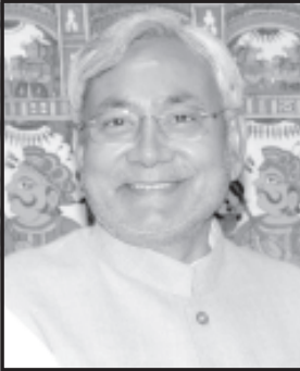
રાજ્ય વાઈઝ બેઠકોની કાળવણી તેમજ અન્ય ૪ થી ૫ રાજકીય પક્ષો પણ મહાગઠબંધનમાં જોડાઈ શકે તેવું અનુમાન લગાવવામાં આવી રહ્યું છે. કટોકટી કાળ બાદ દેશમાં ચોખચેલ લોકસભા ચૂંટણી જેવો