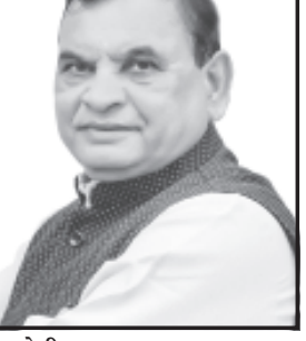
અમરેલી, તા. ૨૬

આરોગ્ય સુવિધા મળી રહે તે માટે બાબરા શહેર ખાતે આવેલ સામુહિક આરોગ્ય કેન્દ્રને સિવિલ હોસ્પિટલનો દરજ્જો આપવા બાબતે આગામી બજેટ જોગવાઈ કરવા સાંસદ મુખ્યમંત્રી, પ્રદેશ અધ્યક્ષ અને સંગઠન મહામંત્રીને બેઠક દરમ્યાન લેખીતમાં રજૂઆત કરેલ હોવાનું સાંસદ કાર્યાલયની અખબારી યાદીમાં જણાવેલ છે.