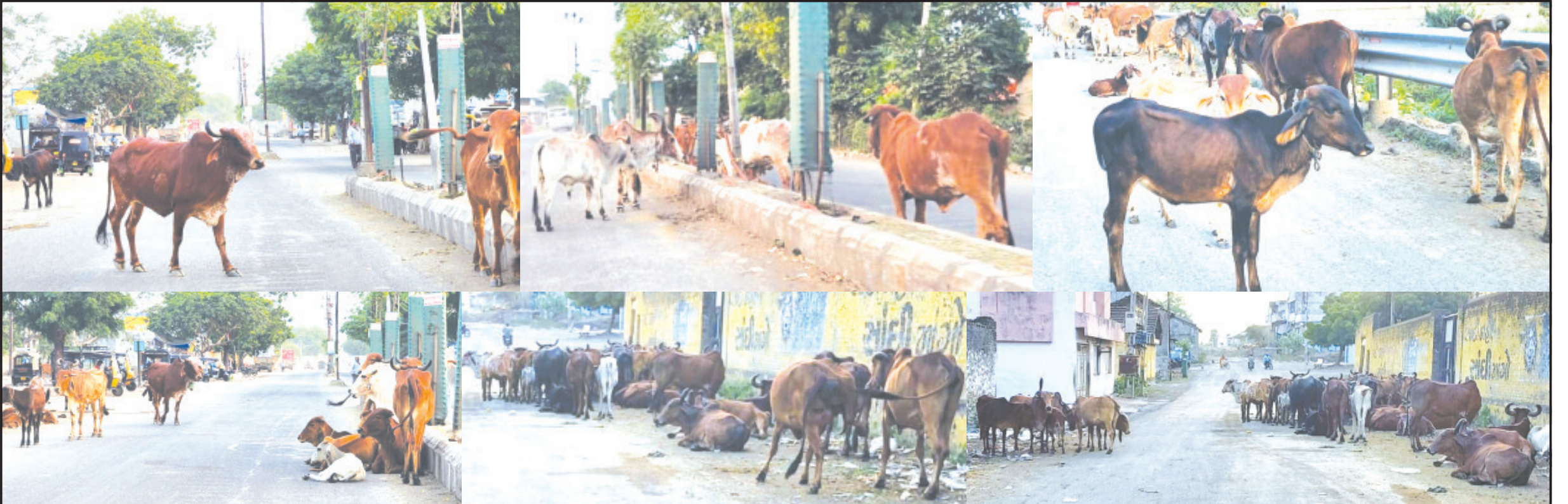
(પ્રતાપ ખુમાણ દ્વારા) સાવરકુંડલા, તા. ૨૬ આ પ્રશ્ન ફક્ત એક જ ગામ

દરેક તાલુકા મથકોએ પણ હોસ્ટેલ બનાવીને રખડતા તમામ પશુઓની જાળવણી કરી શકાય તેમ છે