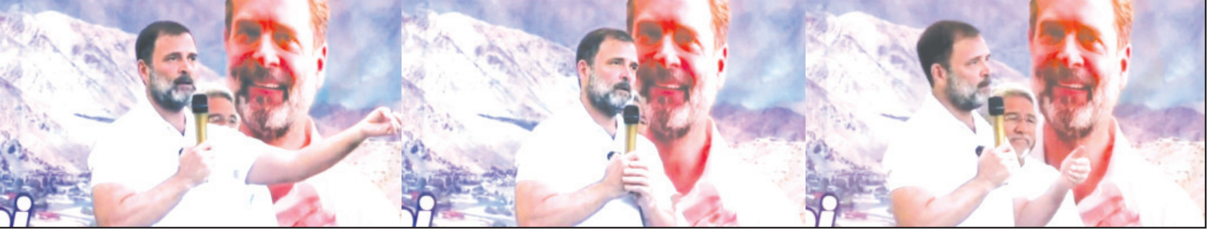
અમરેલી, તા. ૨૬ દેશનાં રાજકારણમાં આગામી ૨૫૦ દિવસ અતિ મહત્વનાં બની રહેવાનાં છે. જેમાં ગુજરાતનાં પડોશી રાજ્ય રાજસ્થાન, મધ્યપ્રદેશ તેમજ છત્તીશગઢ, તેલંગણામાં વિધાનસભાની ચૂંટણી નવેમ્બરમાં યોજાવાની હોય તેમજ આગામી એપ્રિલ-મે માં લોકસભાની ચૂંટણી યોજાવાની હોય સમગ્ર દેશવાસીઓની નજર મંગાવેલી છે. દરમિયાન કોંગી નેતા અને સાંસદ રાહુલ ગાંધીએ દેશનાં સરહદી વિસ્તાર લદ્દાખ ખાતે એક જાહેરસભાને સંબોધતા ગેરંટી સાથે જણાવ્યું કે રાજસ્થાન, છત્તીશગઢ, મધ્યપ્રદેશ, તેલંગણાનાં વિધાનસભાની અને આગામી વર્ષે યોજાનારી લોકસભાની ચૂંટણીમાં કોંગ્રેસ પક્ષ ભાજપને પરાજિત કરશે. કોંગી નેતાનાં આત્મવિશ્વાસ ભરેલ નિવેદનથી દેશનાં રાજકારણમાં મીડિયા જગતમાં નવી ચર્ચા શરૂ થઈ છે કે કોંગી નેતા કયાં અનુસંધાન પાના ૬ ઉપર

રાજસ્થાન, મધ્યપ્રદેશ, છત્તીશગઢ અને તેલંગણામાં કોંગ્રેસ પક્ષ ભાજપને ચોકકસ પરાજિત કરી દેશે આગામી લોકસભાની ચૂંટણીમાં પણ કોંગ્રેસ પક્ષ ગેરંટીથી ભાજપને પરાજિત કરશે રાહુલ ગાંધીનાં આત્મ વિશ્વાસથી દેશનાં રાજકીય માહોલમાં ગરમાવો આવી ગયો દેશનાં ખેડૂતો, યુવાનો, મહિલાઓ, નાના-મોટા વેપારીઓ સહિત દેશની જનતા ભાજપને પરાજિત કરશે