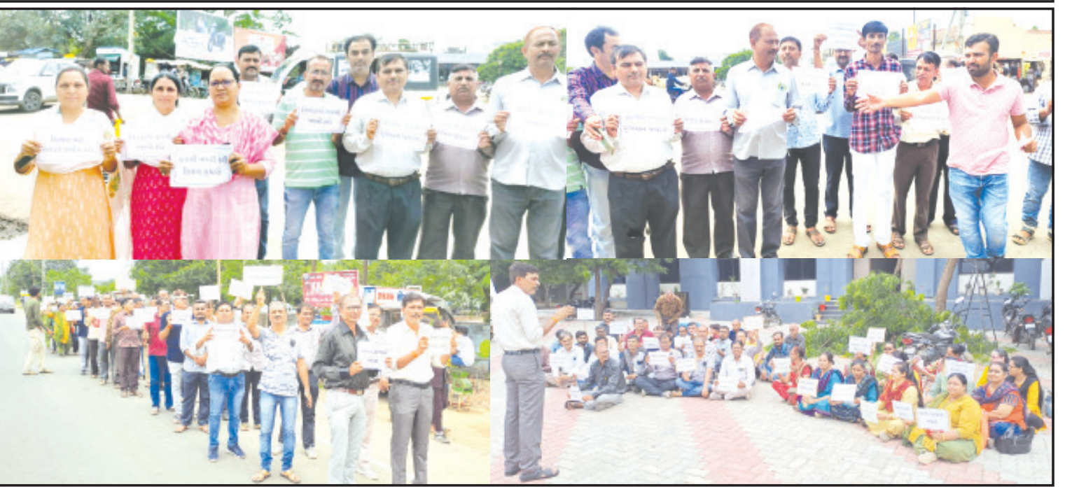
અમરેલી, તા. ૧૨

શિક્ષકોને શિક્ષણ સિવાયની અન્ય સરકારી કામગીરીમાંથી મુક્ત કરવા સહિતની માંગ અપૂર્ણ