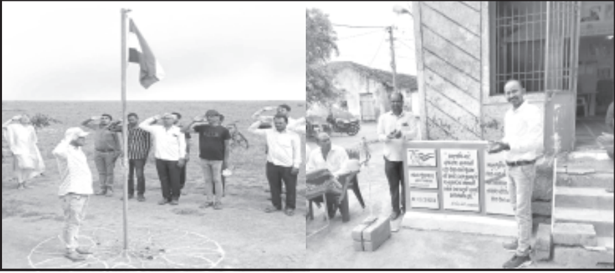
અમરેલી તા.૯ સ્વાતંત્ર્ય પર્વના અવસરે માતૃભૂમિનાં વીર અને વીરાંગનાઓ અને રાષ્ટ્રની માટીને વંદન કરવાનાં હેતુથી કેન્દ્ર અને રાજ્ય સરકાર દ્વારા આગામી તા.૩૦ ઓગસ્ટ-૨૦૨૩ સુધી સગમ્ન દેશમાં 'મારી માટી, મારો દેશ' કાર્યક્રમ યોજાઈ રહ્યો છે.