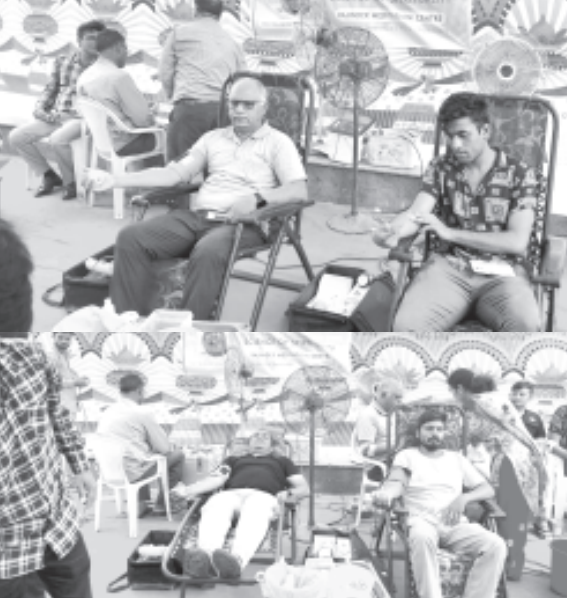
અમરેલી, તા.૯, સાવર કૃપાલ રૂહાની મિશનની અમદાવાદ શાખા દ્વારા રક્ષાદાન શિબિરનું આયોજન રાખવામાં આવ્યું હતું. કેમ્પમાં ૭૪ લોકોએ રક્ષાદાન કયું. મિશનનું આધ્યાત્મિક સાહિત્ય શિબિરમાં આવેલ લોકોને નિ:શુલ્ક આપવામાં આવ્યું હતું. હજૂર બાબા સાવન સિંહજી મહારાજની ૧૬૫ ની જન્મતિથિના ઉલ્લસમાં આ સેવા કરવામાં આવી હતી. મિશન દ્વારા માનવ સેવા માટે જુદા-જુદા સેન્ટર પર આવા રક્ષાદાન શિબિરનું આયોજન રાખવામાં આવે છે.