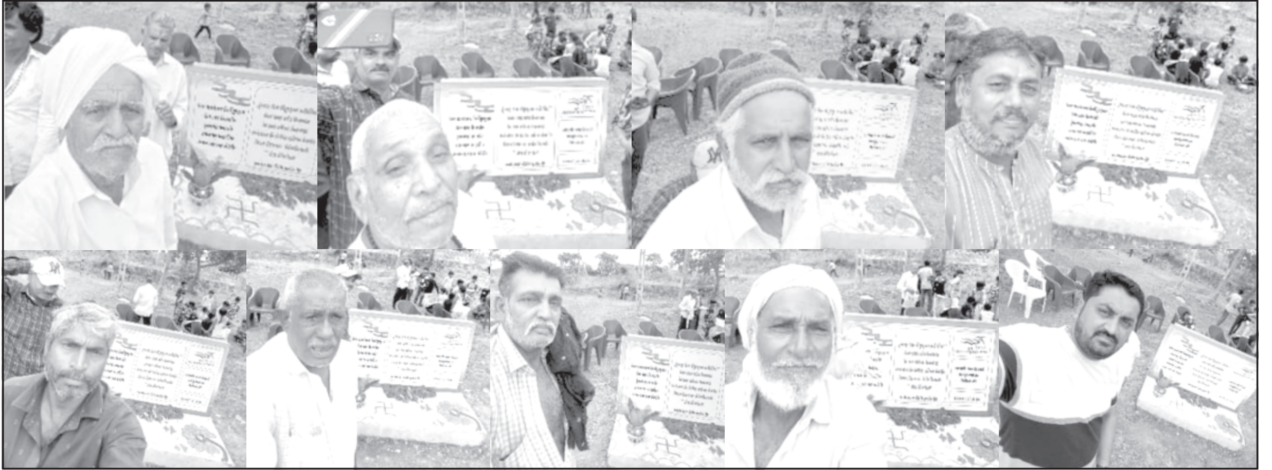
અમરેલી, તા. ૯ સ્વાતંત્ર્ય પર્વના અવસરે માતૃભૂમિના વીર અને વીરાંગનાઓ અને રાષ્ટ્રની માટીને વંદન કરવાના હેતુથી કેન્દ્ર અને રાજ્ય સરકાર દ્વારા આગામી તા. ૩૦ ઓગષ્ટ, ૨૦૨૩ સુધી સમગ્ર દેશમાં 'મારી માટી, મારો દેશ' કાર્યક્રમ યોજાઈ રહ્યો છે. જિલ્લામાં 'મારી માટી મારો દેશ' માટીને નમન વીરોને વંદન' અભિયાનમાં જોડાવાની સાથે વધુમાં વધુ વૃક્ષોનું વાવેતર થાય અને જિલ્લાના વિવિધ વિસ્તારોમાં નાગરિકોએ માતૃભૂમિના વીર અને વીરાંગનાઓ અને રાષ્ટ્રની માટીને વંદન કર્યા હતા. આ અભિયાનમાં જોડાવા માટે વેબસાઈટની લિંક સાથે એક ક્યુ-આર કોડ પણ આપવામાં આવ્યો છે. આ ક્યુ-આર કોડને મોબાઈલમાં ગુગલ લેન્સની બાજુમાં આપવામાં આવેલા કેમેરા અથવા ક્યુ-આર કોડ સ્કેનરથી સ્કેન કરવાથી સીધા સહભાગી થઈ શકાશે. નાગરિકો હાથમાં દીવો લઈ અથવા વૃક્ષારોપણ કરી કે પછી માટી હાથમાં લઈને પોતાની સેફ્ટી ક્લિક કરી આ અભિયાનમાં સહભાગી થઈ શકે છે. આ કાર્યક્રમ અંતર્ગત વિવિધ તબક્કામાં તા. ૯ થી તા. ૧૫ ઓગષ્ટ, ૨૦૨૩ દરમિયાન પંચાયત સ્તરમાં અને તા. ૧૫ થી તા. ૩૦ ઓગષ્ટ, ૨૦૨૩ સુધીમાં બ્લોક અને નગરપાલિકા સ્તરના કાર્યક્રમો યોજાશે. 'મારી માટી મારો દેશ' કાર્યક્રમ અન્વયે, જિલ્લાની દરેક પંચાયતમાં વીરોને નમન કરવાના હેતુથી એક શિલાફલકમ એટલે કે તકતી મૂકવામાં આવશે. જે સ્થળો પર જળાશય ઉપલબ્ધ હોય ત્યાં અમૃત સરોવર/જળ શયોની આસપાસ આ તકતી મૂકવામાં આવશે. આ ઉપરાંત જ્યાં જળાશયો ઉપલબ્ધ ન હોય ત્યાં પંચાયત કચેરી, શાળા પાસે તકતી મૂકવામાં આવશે, જેમાં સ્થાનિક વીરોના નામ અંકિત કરવામાં આવશે. આ તકતીમાં વડાપ્રધાનના વિચાર, વીરોના નામ અને પંચાયતના સ્થળનું નામ, આજાદીના અમૃત મહોત્સવનો લોગો સહિતની વિગતો હશે. વીરોની વ્યાખ્યામાં સ્વાતંત્ર્ય સેનાનીઓ, સુરક્ષા કર્મચારી (આર્મી, નેવી, એરફોર્સ) રાજ્ય પોલીસ ટળ, સીએપીએફના સભ્યોનો સમાવેશ કરવામાં આવ્યો છે. એટલે કે એવા લોકો જે પોતાની ફરજ દરમિયાન મૃત્યુ પામ્યા છે, તેમને આ શિલાફલકમ દ્વારા શ્રદાંજલિ આપવામાં આવશે. કાર્યક્રમ દરમિયાન આજાદીના અમૃત મહોત્સવના પંચ પ્રણાની પ્રતિજ્ઞા લેવામાં આવશે અને સહભાગીઓ આ પ્રતિજ્ઞા હાથમાં માટીના દીવડા લઈને કરશે. સહભાગીઓ પોતાની સેફ્ટી, આ અભિયાનની વેબસાઈટ https://merimaatimeradesh.gov.in/step પર અપલોડ કરી શકાશે.

નિર્ધારિત કરેલ વેબસાઈટ ઉપર સેફ્ટી અપલોડ કરી શકાશે