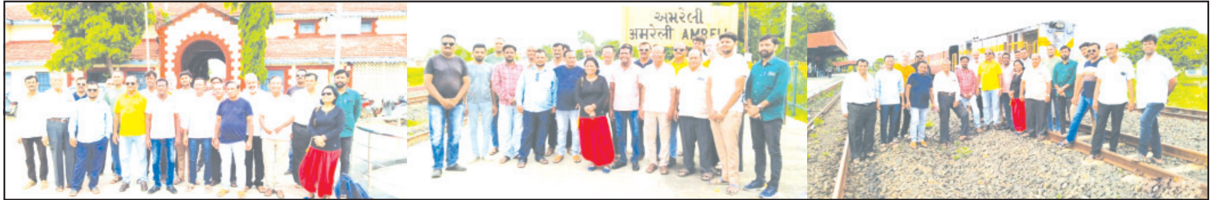
અમરેલી, તા. ૩૧ આપણું અમરેલી એવું અમરેલી કે જ્યાં સંત મુળદાસ જેવા સંત થઈ ગયા, રમેશ પારેખ જેવા કવિ અને અમરેલીને જિલ્લો બનાવનાર ગુજરાતના પ્રથમ મુખ્યમંત્રી એવા ડો. જીવરાજ મહેતાએ વતનનું ઋણ ચૂકવવા માટે અમરેલીને જિલ્લો તો બનાવી દીધો પરંતુ આજ સુધી અમરેલી જિલ્લાને જિલ્લો કહી શકાય અથવા તો અમરેલી શહેરને શહેર કહી શકાય એવો કોઈ વિકાસ અમરેલીમાં થયો નથી...!!! જેનું મુખ્ય કારણ છે અમરેલીમાં જે પાયાની સુવિધા હોવી જોઈએ વિકાસ માટે તેમજ પરિવહન અને પર્યટન માટે ખૂબ જ જરૂરી એવી બ્રોડગેજ લાઈન નથી. જેથી અત્યાર સુધી બ્રોડગેજથી વંચિત એવી અમરેલીની જનતા મોટા શહેરોમાં અને વિદેશમાં વસવાટ માટે જવા મજબૂર થઈ ગઈ છે. ત્યારે હમણાં બ્રોડગેજ વગર ખૂબ જ હેરાન થયેલી જનતાના અનુસંધાન પાના ૬ ઉપર

કોઈપણ સંમેગમાં જિલ્લાકક્ષાનાં શહેરમાં બ્રોડગેજ રેલ્વેની સુવિધા મેળવવા મક્કતા દર્શાવી કલેક્ટરથી લઈને પ્રાઈમ મિનિસ્ટર સુધી સતત રજૂઆત કરવાનું નક્કી કરાયું અમરેલીની જનતા છેલ્લા ૨૦ વર્ષથી બ્રોડગેજ રેલ્વે લાઈનની માંગ કરી રહી છે ડો. મનમોહનસિંહથી લઈને નરેન્દ્ર મોદી સુધીની સરકારે ન્યાય ન આપ્યો તે હકીકત છે