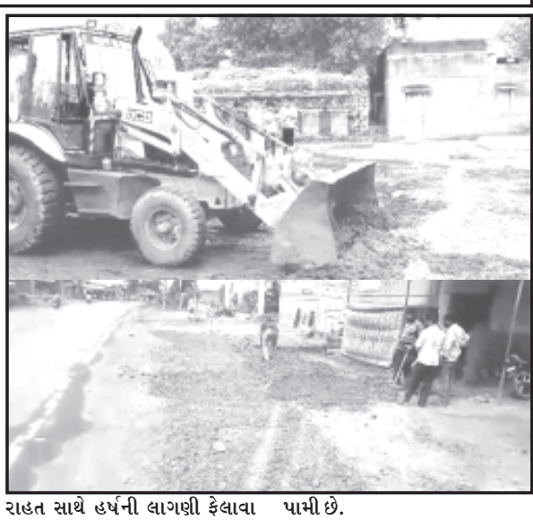
રાહત સાથે હર્ષની લાગણી ફેલાવા પામી છે.

ખાંભા, તા. ૩૧ ખાંભામાં છેલ્લા ૨ મહિનાથી અવરિત પડેલા વરસાદનાં કારણે પાંખામાં શેરીઓ, ગલીઓમાં કાદવ ક્રિયાનું સામ્રાજ્ય જામતા ખાંભા ગ્રામ પંચાયત દ્વારા સફાઈની કામગીરી હાથ ધરવામાં આવી.