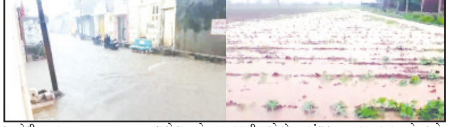
અમરેલી, તા. ૫ અમરેલી જિલ્લામાં સતત છૂટો છવાયો વરસાદ પડી રહ્યો છે. ત્યારે અમરેલી તાલુકાના ગ્રામ્ય પંથકમાં વરસાદ પડ્યો હતો. અસહ્ય બફારા બાદ શરૂ થયેલ વરસાદ અમરેલી તાલુકાના દેવરાજયા, સાજયાવદર, કેરીયાયાડ સહિતના ગામોમાં પડ્યો હતો. ભારે વરસાદના કારણે ખેતરોમાં વરસાદી પાણી ભરાયા તો અમરેલી શહેરમાં પણ ઝરમર વરસાદ પડ્યો હતો. લાઠી શહેરમાં પણ ઘનઘોર વાદળો અને ભારે બફારા બાદ એક ઈંચ વરસાદ પાબકયો હતો. થોડીવાર પડેલા ઘોંઘમાર વરસાદ કારણે લાઠી શહેરની ગલીઓમાં પાણી વહેતા થયા હતા તો લીલીયા પંથકમાં આજે પોણો ઈંચ જેટલો વરસાદ પડ્યો હતો. આ વિસ્તારમાં વરસાદને કારણે ખેડૂતોમાં ખુશીનો માહોલ જોવા મળ્યો હતો.