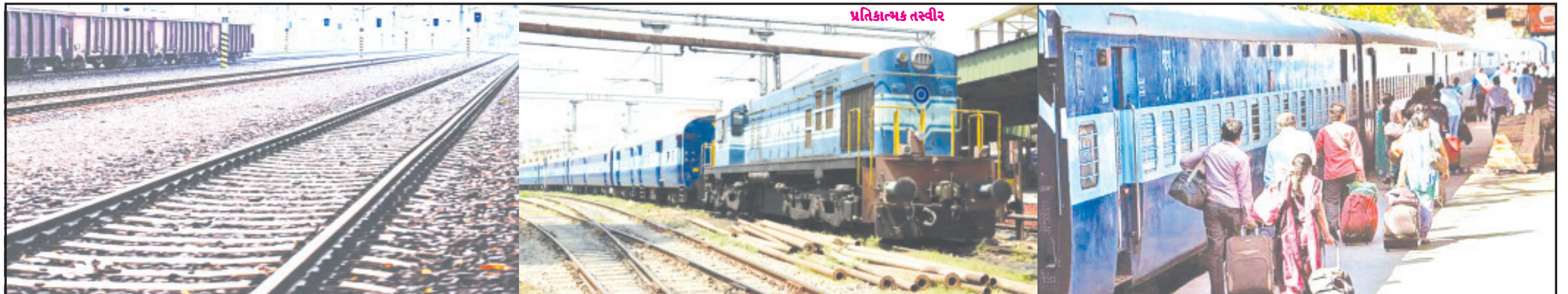
અમરેલી, તા. ૫ અમરેલી નગર એ રાજ્યનાં પ્રથમ મુખ્યમંત્રી અને અમરેલીનાં પનોતા પુત્ર ડો. જીવરાજ મહેતાની સ્વપ્ન નગરી છે. તેઓએ તેમનાં જાહેર જીવનનાં કાળમાં અમરેલી શહેર અને જિલ્લા માટે મહત્વનાં અનેક વિકાસકાર્યો બાદમાં તેઓનું નિધન થયા બાદ અમરેલી જિલ્લાને સમગ્ર નેતૃત્વનો અભાવ હંમેશા પરેશાન કરી રહ્યો છે. અમરેલી જિલ્લા સહિત સમગ્ર દેશમાં વર્તમાન ભાજપ સરકાર ધ્વારા આઝાદીનાં ૭૫ વર્ષ પૂર્ણ થતાં "અમૃત મહોત્સવ" ઉજવવામાં આવી રહ્યો છે. તેવા સમયે જિલ્લાકક્ષાને અમરેલી શહેરમાં બ્રોડગેજ રેલ્વેની સુવિધા નથી અને સત્તાધારી પક્ષનાં આગેવાનો અમરેલી જિલ્લામાં "૯ સાલ બેમિસાલ"ની ઉજવણી કરતાં હોય ત્યારે તેઓ ભૂલી જાય છે કે અમરેલી માટે "૯ સાલ"માં રેલની સુવિધા તેઓ અપાવી શક્યા નથી. વર્તમાન સમયમાં અનુસંધાન પાના ૬ ઉપર

નબળી નેતાગીરીનાં કારણે અમરેલી જિલ્લો આઝાદીનાં અમૃતકાળમાં વિકાસનાં ફળ ચાખી શકતો નથી તે કડવું સત્ય છે