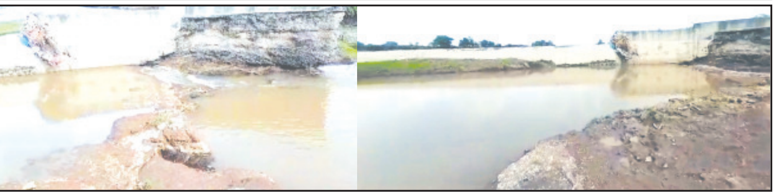
અમરેલી, તા. ૫ વડીયાની સુરવો નદી ઉપરના સૌથી મોટા ચેકડેમમાં મસમોટું ગાબડું પડી જતા લાખો લીટર પાણી વહી જતાં ખેડૂતોમાં ભારે રોષ જોવા મળી રહ્યો છે. વડિયા અને ચારણીયા ગામ વચ્ચે આવેલા ચેકડેમમાંથી પાણીનો મોટો જથ્થો વેડફાઈ ગયો છે. આ ચેકડેમના પાણીથી અંદાજીત ૫૦૦ હેક્ટર જમીનમાં વાવેતર કરતાં ખેડૂતોને કાયદો થતો હતો. અનુસંધાન પાના ૬ ઉપર

પૂર્વ સરપંચે ઉચ્ચકક્ષાએ ગાબડું બુરવા માટે રજૂઆત કરી