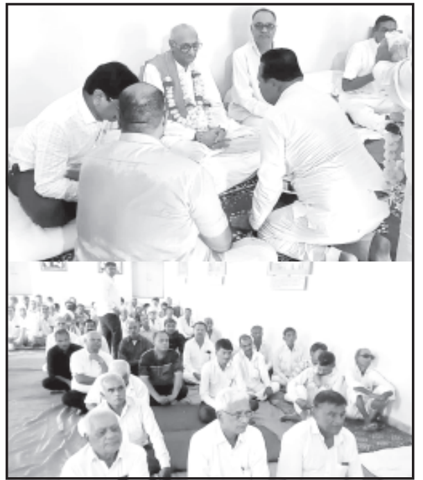
તેમજ ગોહિલવાડ સહિત ઠેકઠેકારણેથી

ગુરૂપૂર્ણિમાના શુભ દિવસે ચલાલામાં જગલિખ્યાત દાનબાપુની જગ્યા, ગાયત્રી સંસ્કારધામ-સંત દેવીદાસની મુળ વદરની જગ્યા, બજરંગદાસ બાપાની મઠેલી સહિતનાં આશ્રમોમાં હજારો ભાવિકભક્તજનોએ આસ્થાભેર ગુરૂપૂર્ણિમાના મહોત્સવની ઉજવણી કરી હતી.