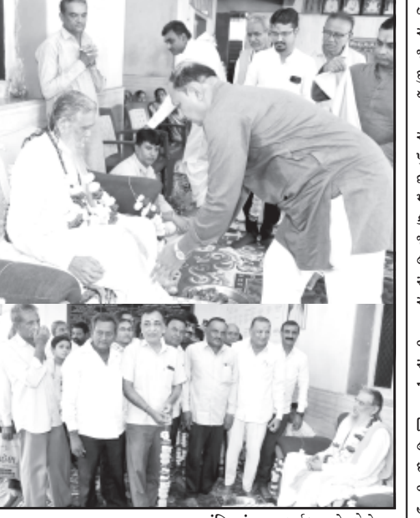
બગસરા, તા. ૪