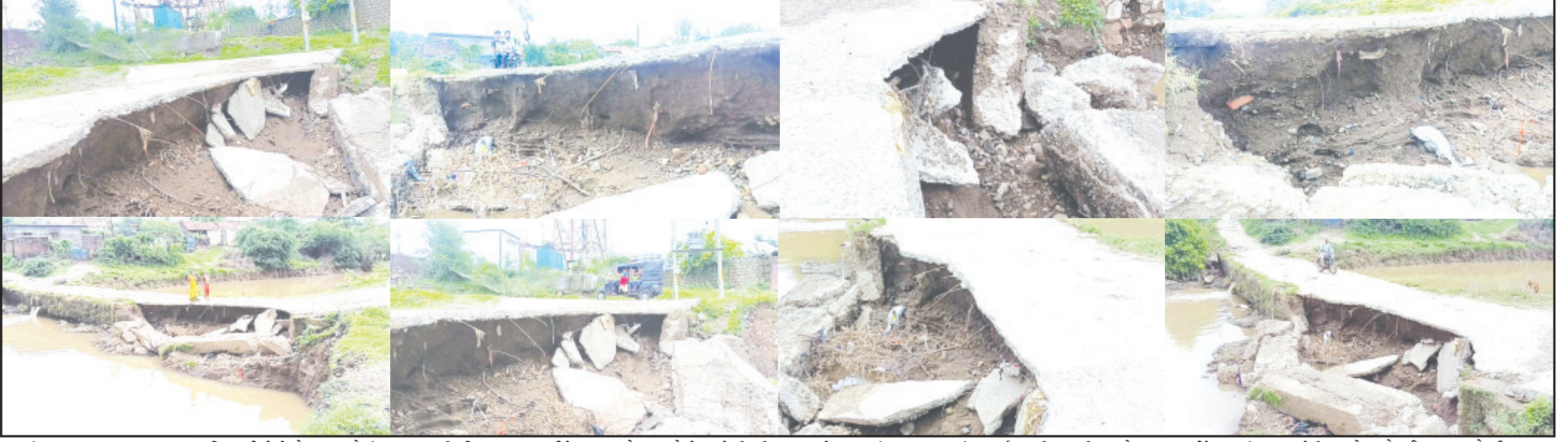
સાવરકુંડલા, તા. ૪ અમરેલી જિલ્લામાં થયેલી મેઘ મહેર રોડ-રસ્તાઓ માટે કહેર સાબિત થઈ છે ને રોડ-રસ્તાઓમાં માટી કામ ધોવાઈ જવાની અનેક ફરિયાદો વચ્ચે સાવરકુંડલાના ગાધકડાથી વિજયાનગર થઈને સાવરકુંડલા જવાનો માટી ઉપર સ્વેબ સાથેનો બ્રીજ માટી ધોવાઈ જતાં બ્રીજ હાલક ડોલક બન્યો છે. ત્યારે બ્રીજથી ગંભીર અકસ્માતો સર્જવાની દહેશત વચ્ચે જીવના જોખમે વાહનો પસાર થઈ રહ્યા છે. સાવરકુંડલાના ગાધકડા ગામથી વિજયાનગર થઈને સાવરકુંડલા, અમરેલી જવાનો ટુંકો માર્ગ આ બ્રીજ પરથી જવાનો સરળ માર્ગ છે. પણ અમરેલી જિલ્લામાં પડેલા સચરાચર વરસાદમાં વિજયાનગર થઈને સાવરકુંડલા-અમરેલી જવાનો માર્ગ પરનો બ્રીજ ઉપરથી સહી સલામત જોવા મળે પણ નીચેથી માટી ધોવાઈ જતા આખો બ્રીજ જુલતા મિનારા જેવો સ્પષ્ટ જોવા મળી રહ્યો અનુસંધાન પાના ૬ ઉપર

માર્ગ-મકાન વિભાગ દ્વારા યુદ્ધનાં ધોરણે માર્ગની મરામત કરવામાં આવે તે જરૂરી