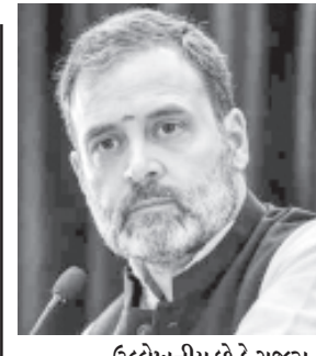
ઉલ્લેખનીય છે કે ગુજરાત હાઈકોર્ટે રાહુલ ગાંધીની સજા પર સ્ટે મૂકવાની અરજીને ફગાવી દીધી હતી. આ પછી પૂર્વ કોંગ્રેસ અધ્યક્ષે હાઈકોર્ટના નિર્ણયને સુપ્રીમ કોર્ટમાં પડકાર્યો હતો. જસ્ટિસ બીઆર ગવઈ

નવી દિલ્હી, તા. ૨૧ સુપ્રીમ કોર્ટે આજે મોદી સરનેમ ટીપ્પણી સંબંધિત માનહાની કેસમાં કોંગ્રેસ નેતા રાહુલ ગાંધીની અરજી પર સુનાવણી કરી હતી. સુપ્રીમકોર્ટે આ મામલે પૂર્ણેશ મોદીને પણ નોટિસ ઇશ્યૂ કરી હતી. તેમને ૧૦ દિવસમાં જવાબ આપવા પણ નિર્દેશ આપ્યો છે. આ સાથે ગુજરાત સરકારને પણ સુપ્રીમકોર્ટે નોટિસ ઇશ્યૂ કરી છે. રાહુલ ગાંધીએ એવી દલીલ કરી હતી કે વાચનાડામાં ગમે ત્યારે પેટાચૂંટણીની જાહેરાત થઈ શકે છે. હવે આ મામલે આગામી સુનાવણી ૪ ઓગસ્ટે કરવામાં આવશે.