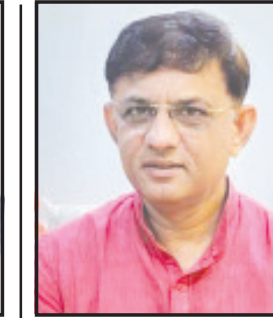
અમરેલી, તા. ૧૯ અમરેલીના સાંસદ નારણભાઈ કાછડીયા, નાયબ મુખ્ય