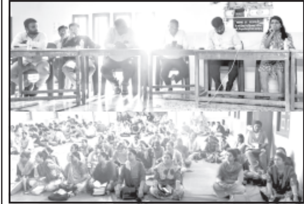
સાવરકુંડલા, તા. ૧૮

સાવરકુંડલા ખાતે તારીખ ૧.૧.૨૦૦૪ ની લાયકાતની તારીખના સંદર્ભમાં મતદાર યાદી સતત સુધારણા અને આગામી તારીખ ૨૧.૭.૨૦૨૩ થી શરૂ થનાર હાઉસ ટુ હાઉસ કાર્યક્રમ અંતર્ગત સાવરકુંડલા તાલુકાના બી.એલ.ઓ અને સુપરવાઈઝરોને ઓનલાઈન બી.એલ.ઓ. એલિલેક્શન, હાઉસ ટુ હાઉસ સર્વે માર્ગદર્શન બાબતે એસ.વી. દોશી ગલ્સ હાઉસ્ટુલ, સાવરકુંડલા ખાતે વિગતવાર