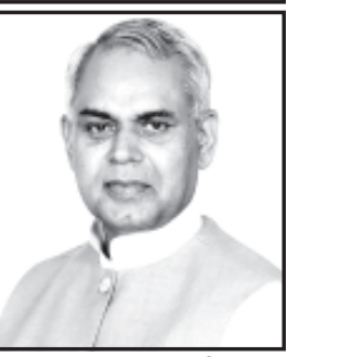
સહિત ઘોળકીયા પરિવારજનો ઉપસ્થિત રહેશે.