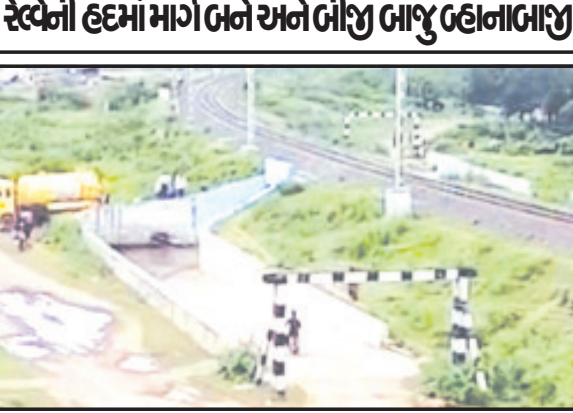
દામનગર, તા. ૧૯ દામનગર શહેરમાં આર્થિક

વર્ષો જૂનો પ્રશ્ન દૂર કરવામાં આવતો નથી દામનગરનાં ખેડૂતો અને ખોડિયારનગરને કાયમી માર્ગની સુવિધા આપવામાં તંત્રનાં ઠાગાઠૈયા સ્વેચ્છેની હદમાં માર્ગ બને અને બીજી બાજુ બહાનુબાજી