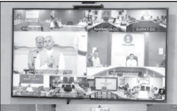
ખેતીના કારણે પ્રથમ વર્ષથી જ પૂરેપૂરું ઉત્પાદન મળે છે. એટલું જ નહીં, ખેડૂતોનો ખર્ચ પણ શૂન્ય થવાથી તેમની આવક બમણી કરવાનું પ્રધાનમંત્રી નરેન્દ્રભાઈ મોદીનું સ્વપ્ન પણ સિદ્ધ કરી શકાયો. આ માટે તેમણે અજિયા આધારિત કુદરતી ખાતર બનાવવાની વિધિ, જીવામૂત, ઘન જીવામૂત, આરબાઈન વિશે પણ વિગતવાર સમજણ આપી હતી.

તેમણે જણાવ્યું કે દેશી ગાયના એક ગ્રામ ગોબરમાં ૩૦૦ કરોડ જીવાનું હોય છે. આવી ગાયના ગોબર અને ગોમૂત આધારિત પ્રાકૃતિક